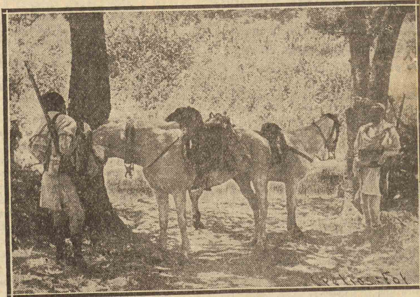
Un puesto avanzado de jinetes de Abisinia. La mayor parte del servicio de reconocimiento se realiza por excelentes jinetes

ATENAS.—El periódico "Eleftheron Vima", dice que el ministerio de Marina griego declara sin fundamento la información publicada por el periódico italiano "Tevere", según el cual, Inglaterra tiene la intención de establecer una base naval en la isla griega de Moudros, que domina los Dardanelos, para ejercer el control de los navíos procedentes de la U.R.S.S. y Rumanía, en caso de que ambos países se nieguen a participar en el embargo sobre el petróleo.