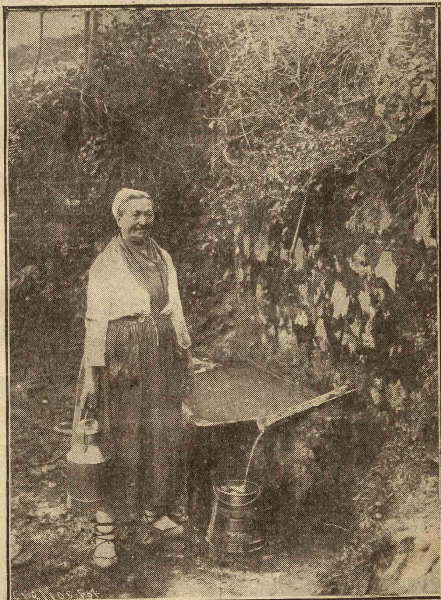
ITURRITXOAN.—La «etxeakoandere» va a la fuente. A la fuente de Agiña-Maltzaran, en la falda de Karakate. Y esto ven los montañeros