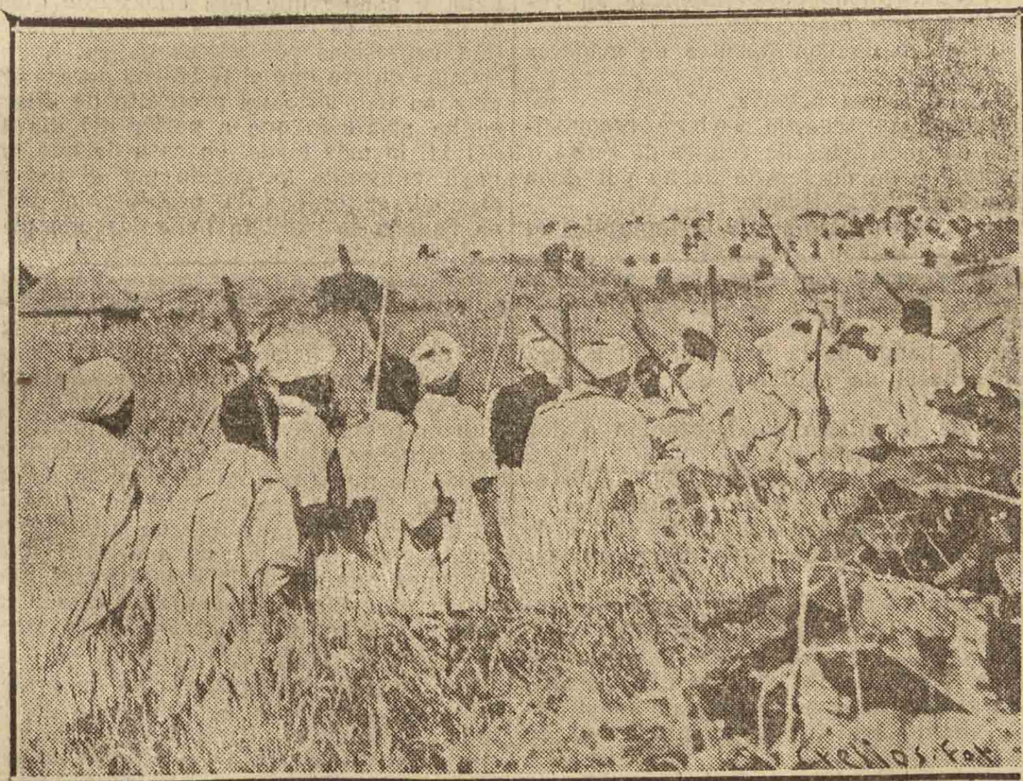
A TRAVÉS DE LOS CAMPOS CAMINAN LOS GUERREROS ABISINIOS HACIA EL FRENTE.

LONDRES.—El segundo cuerpo de ejército del general Pietro Maravigna ha emprendido