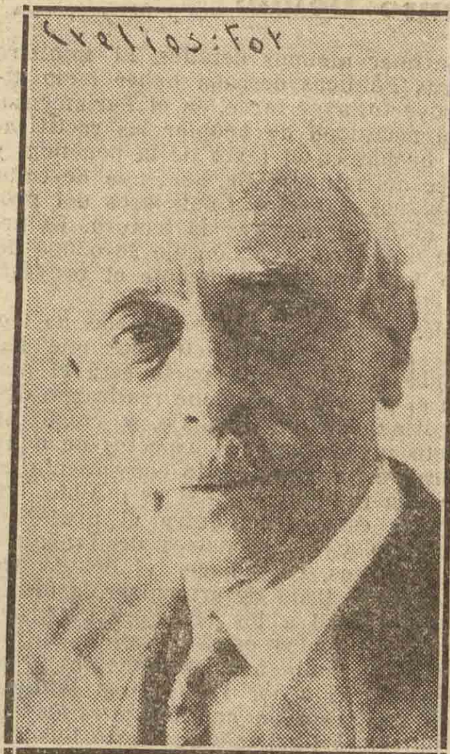
Paul Valéry, el famoso y discutido poeta y literato francés propuesto para el Premio Nobel de Literatura.