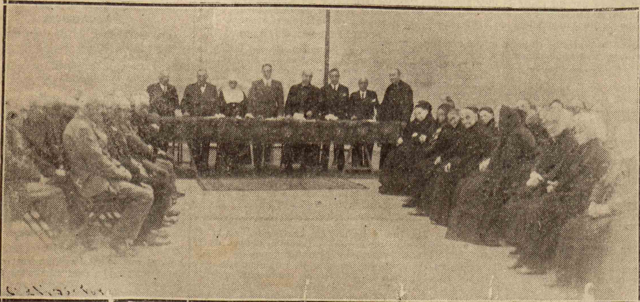
También en el Asilo de Zorroaga se celebró el "Homenaje a la Vejez", simpático acto, que se efectuó en el amplio frontón del establecimiento

Como consecuencia de estas normas y restricciones, los camiones, automóviles y de fuerza animal, deberán resolver la travesía de San Sebastián, siguiendo la Nueva Avenida de Ategorrieta, el Paseo de Colón, Plaza de Vasconia, puente de Santa Catalina, Plaza de España, calle de los Fueros y calle Pi y Margall hasta la calle de Zubiate.