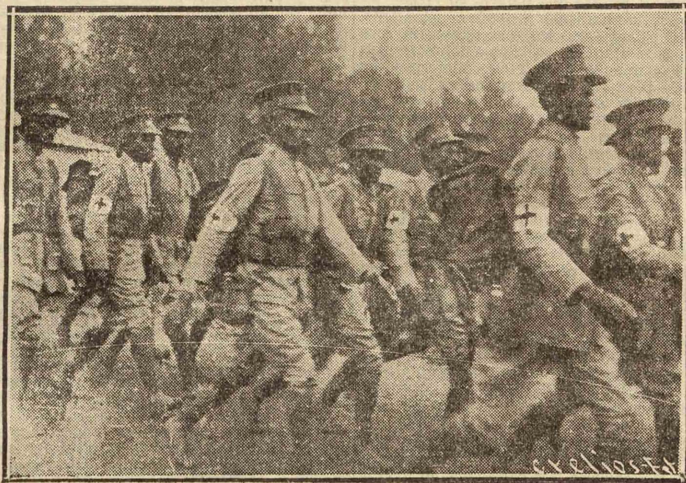
Formaciones regulares, militarizadas, de la Cruz Roja, forman en el Ejército de Abisinia

Las autoridades de Malta - pese a cuanto se ha venido diciendo desde días atrás - dicen que la Gran Bretaña no retirará del Mediterráneo ningún buque de guerra de la flota que allí ha reunido previsoriamente