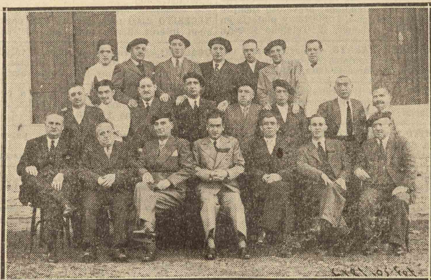
Estos simpáticos "irundarras", adoptivos y por derecho, se reunieron días pasados en banquete para festejar el quinto aniversario de la fundación de la Sociedad de "Belarrimochas"