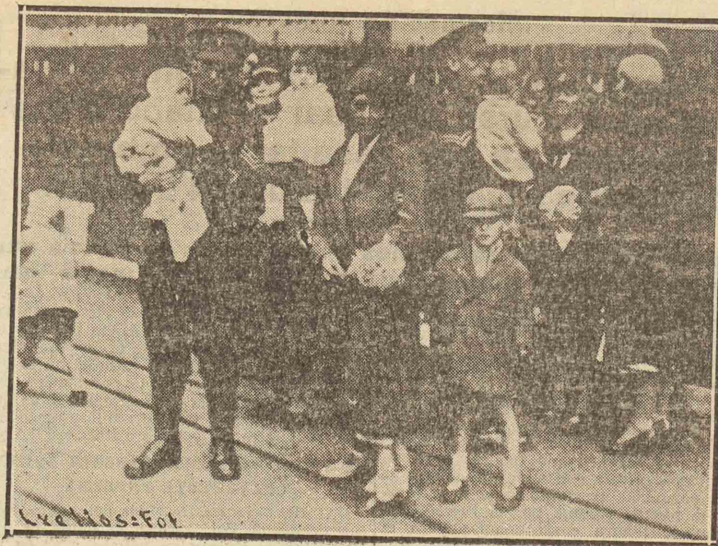
En el puerto de Southampton se producen estas escenas, exactamente iguales a otras de otros países: las despedidas los soldados. Estas son familias que se despiden de los seres queridos que marchan a Egipto

SWATELLE (California).—Buster Keaton, el conocido artista de cine ha sido hospitalizado en el hospital de veteranos de guerra, habiéndole impuesto los médicos un descanso obligatorio y comunicado que el artista, ex combatiente en la guerra mundial, se encontraba en estado grave a consecuencia de una enfermedad nerviosa y mental.