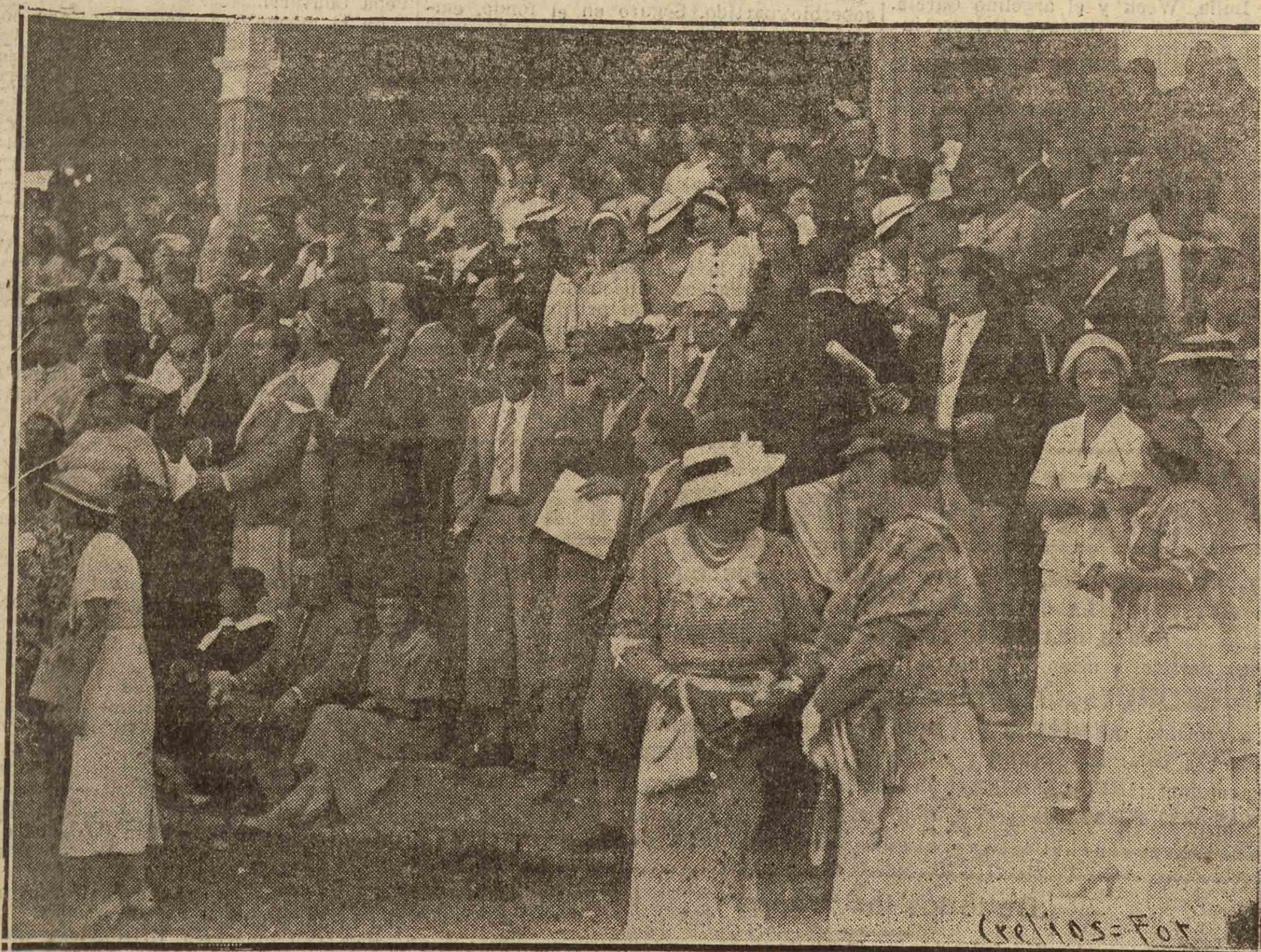
La última reunión llevó al Hipódromo una gran concurrencia. Era la despedida a las carreras de caballos, que este año han marcado un elevado grado de afición a esta fiesta de carácter mundano. He aquí la vista de una parte de la tribuna distinguida en la reunión de ayer

Se cerró la temporada de carreras. - Mucho público. - Una bonita victoria de "Atlantique" en el Premio "Nouvel An"