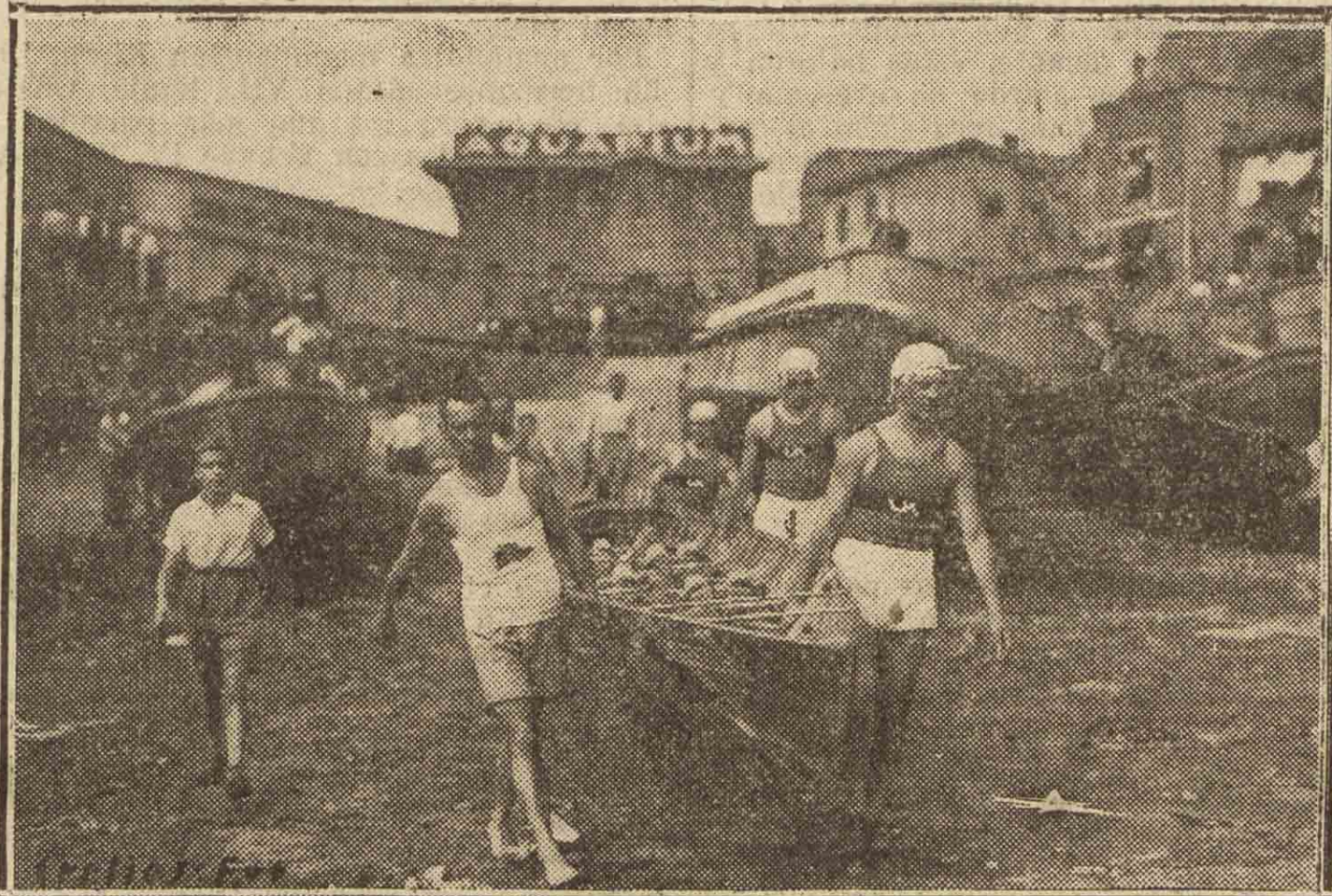
Esfuerzo, perseverancia, triunfos esto significa el nombre "Ur-Kirolak". Estos recios muchachos, deportistas integrales, son los sucesores de otros, predecesores de los que luego llegaron para seguir una brillante historia

El tiempo menor conseguido en otras actuaciones era de 8-30 en los campeonatos de España corridos el año pasado en nuestra bahía, y de 8-48, en unos entrenamientos. Pues bien: el viernes de la semana pasada cubrieron la distancia reglamentaria de 2.000 metros en 18 minutos 2 segundos!