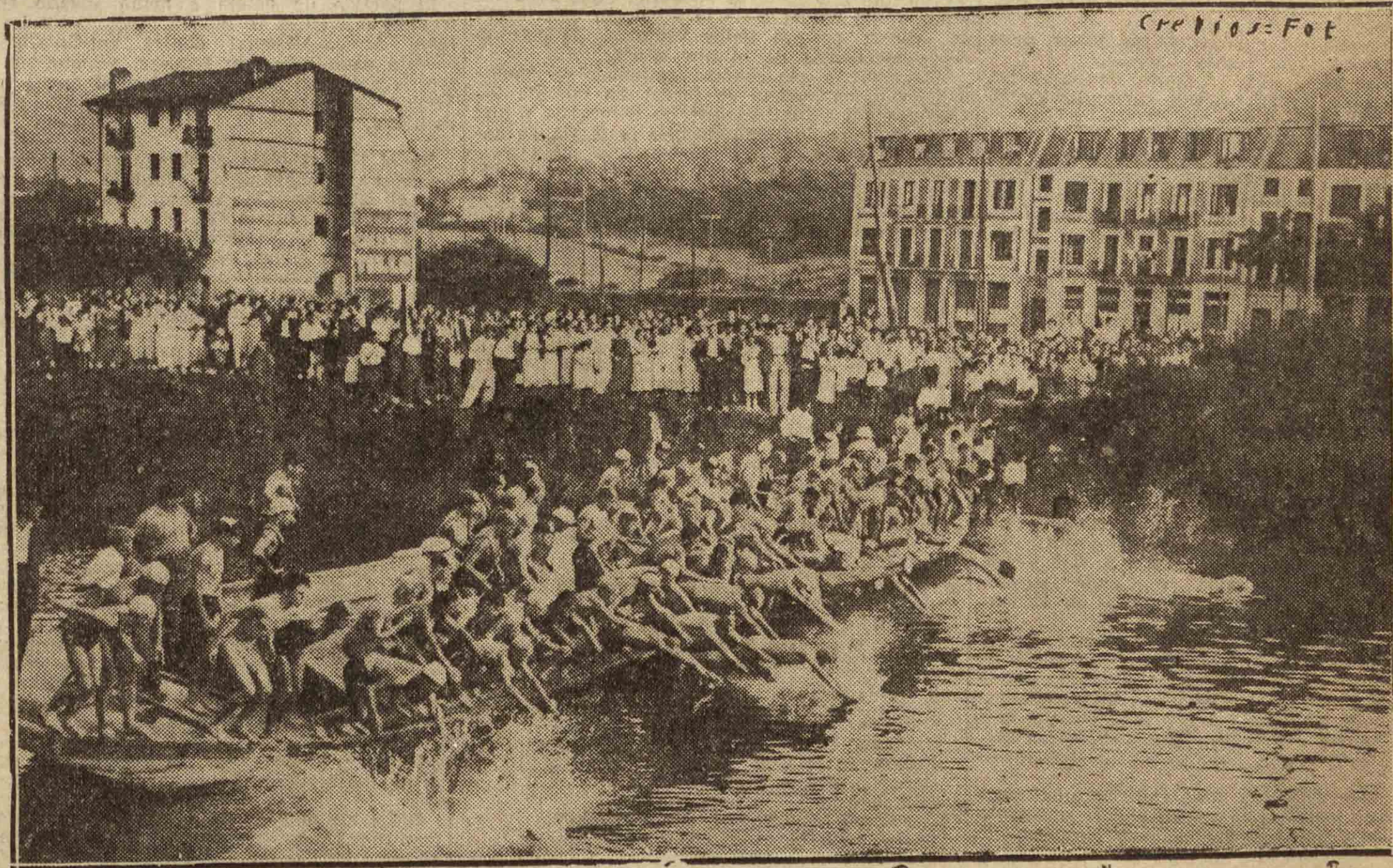
Magnífica manifestación deportiva la del domingo. Éxito rotundo. Este es el momento en que se lanzan a las aguas del Urumea los nadadores que habían de luchar bravamente