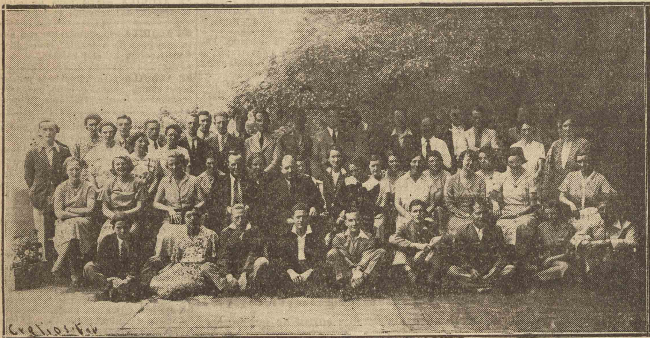
Los profesores de la Universidad de Liverpool que han asistido a las clases de las escuelas de Urgull durante el mes de agosto