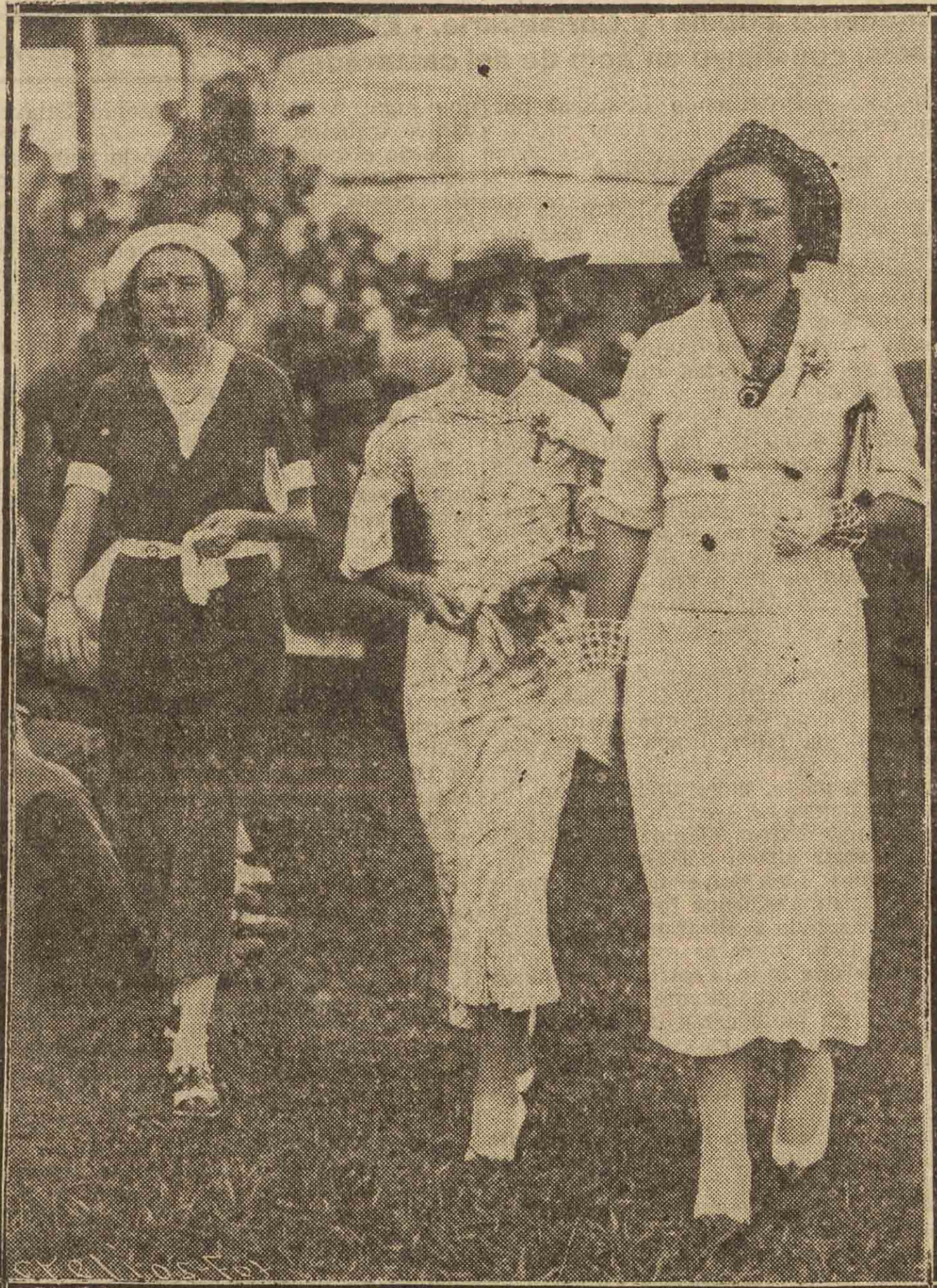
Siempre es agradable acudir al Hipódromo, porque siempre hay motivos para la admiración

Con la natural expectación se corrió el "Premio España", para el que se habían inscripto caballos de excelente calidad. Antes de darse la salida, desfilaron a la vista de los espectadores los siete participantes de esta importante carrera, que los admira-