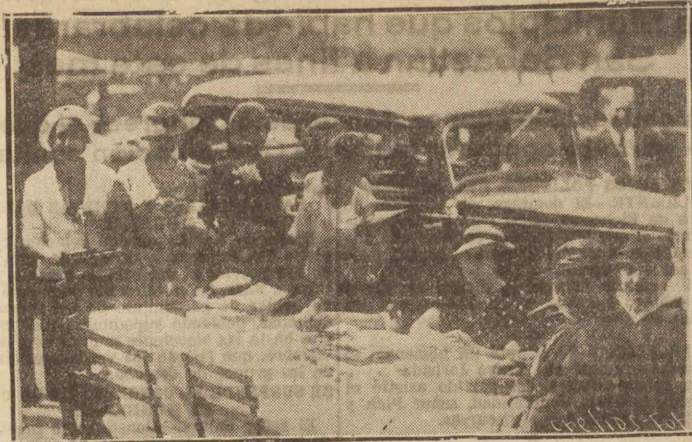
Una de las mesas petitorias, presidida por la señora del gobernador de Guipúzcoa