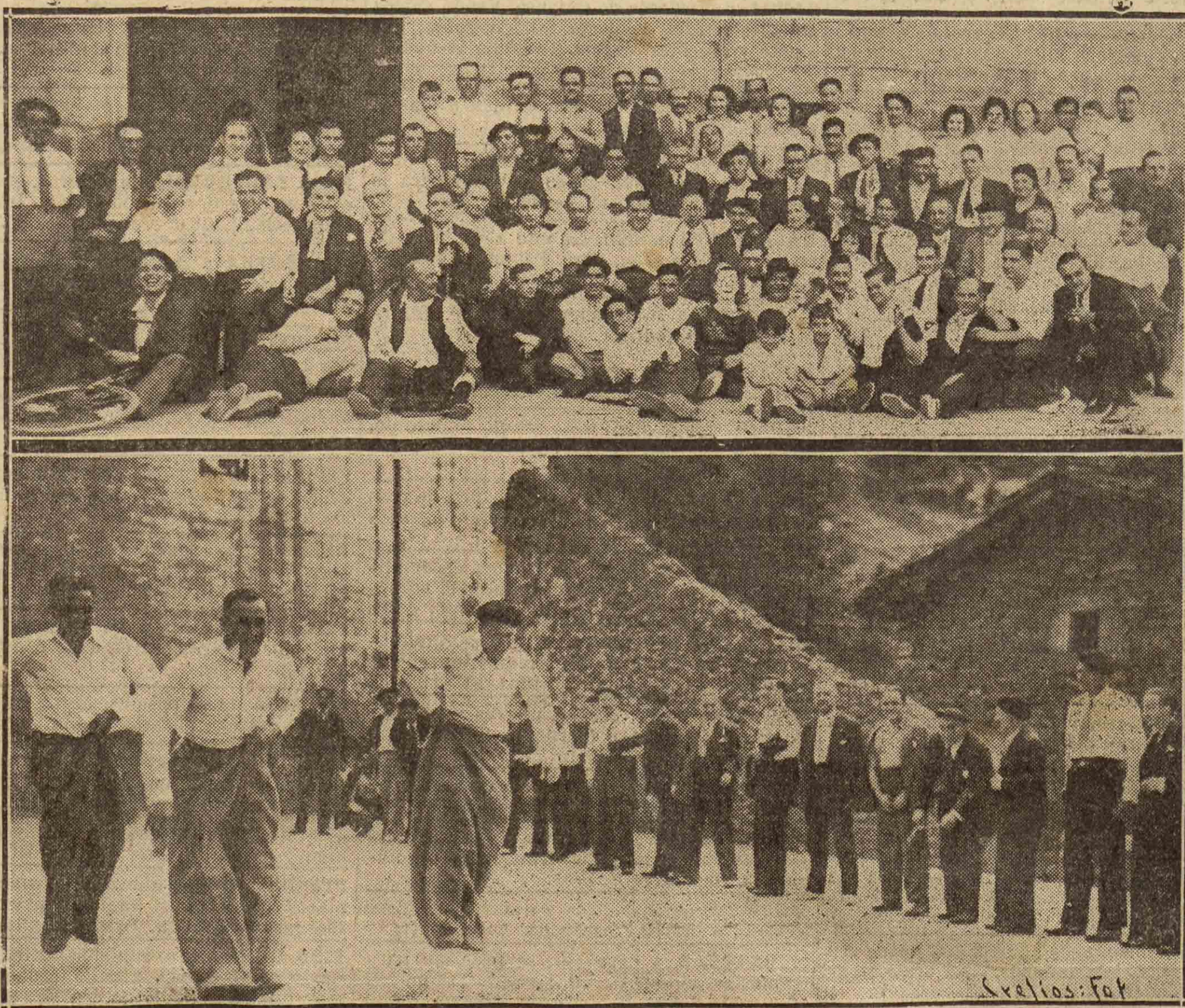
Arriba, el grupo de "euskal-billeristas" reunidos en Ituren para festejar el 34.º aniversario de la fundación de la kosh-kera Sociedad

¡Hemos entrado en julio: paso al verano de San Sebastián!