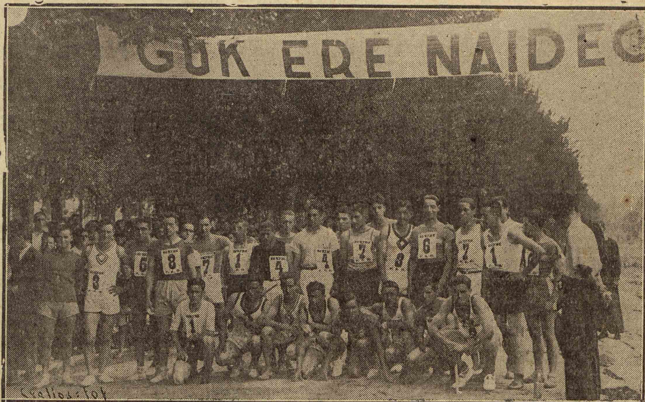
Grupo de corredores que intervinieron anteayer en la "Primera Prueba Pedestre Amara" y que constituyó un gran éxito.

J. M. Muñoz Especialista enfermedades de la piel, venéreas y sifilíticas. Consulta: 12 a 2 y de 5 a 9. Teléf. 15.478. San Francisco, 18, 1.ª derecha.