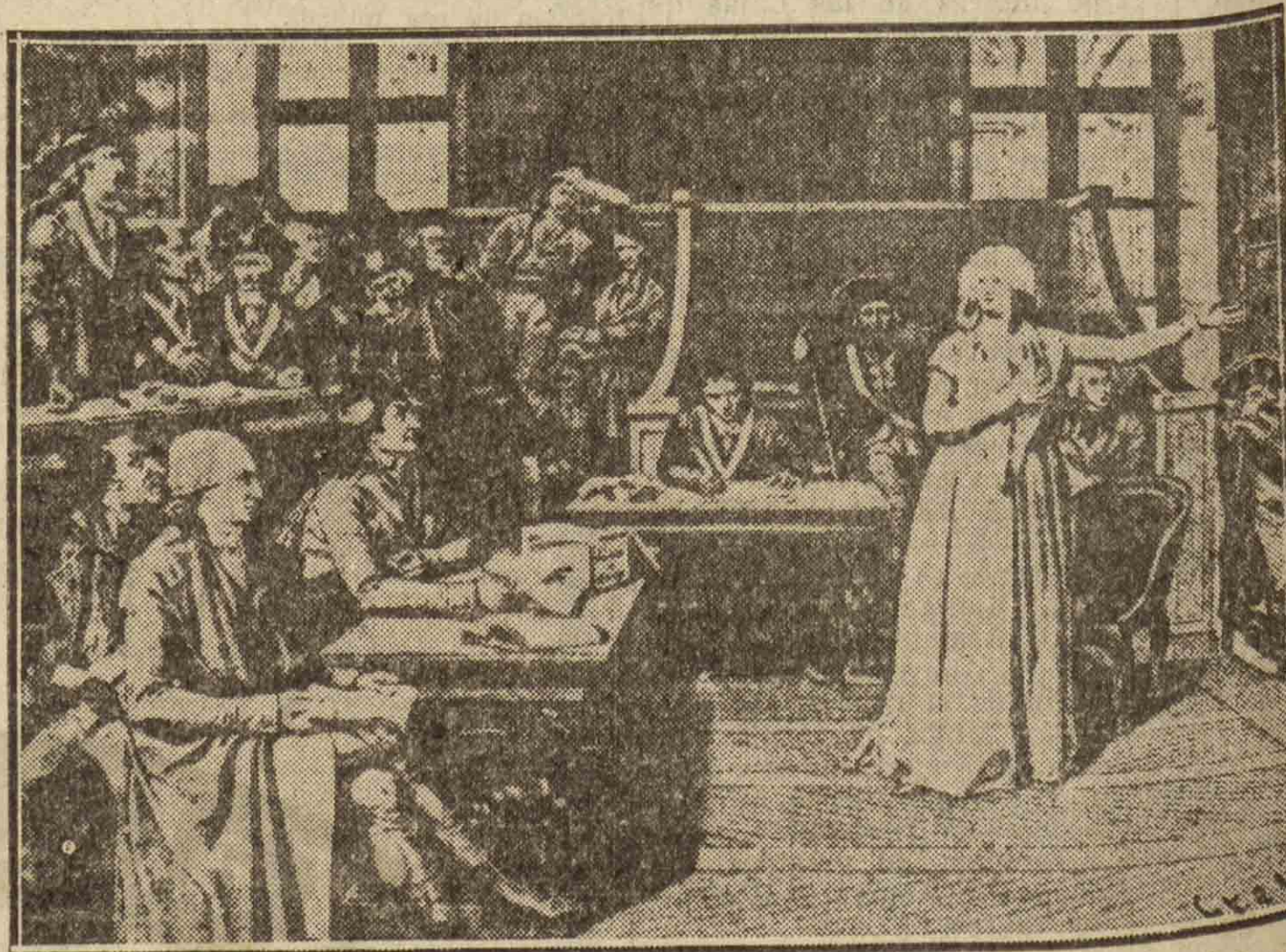
MARIA ANTONIETA, ANTE EL TRIBUNAL REVOLUCIONARIO QUE LE CONDENÓ A MUERTE. LA REINA SE MUESTRA SERENA Y DIGNA ANTE SUS JUECES Y ESCUCHA SU SENTENCIA CON RESIGNACION Y ENTREZA EJEMPLAR. «LA NOTICIA» COMENZARA A PUBLICAR LA HISTORIA DE MARIA ANTONIETA.