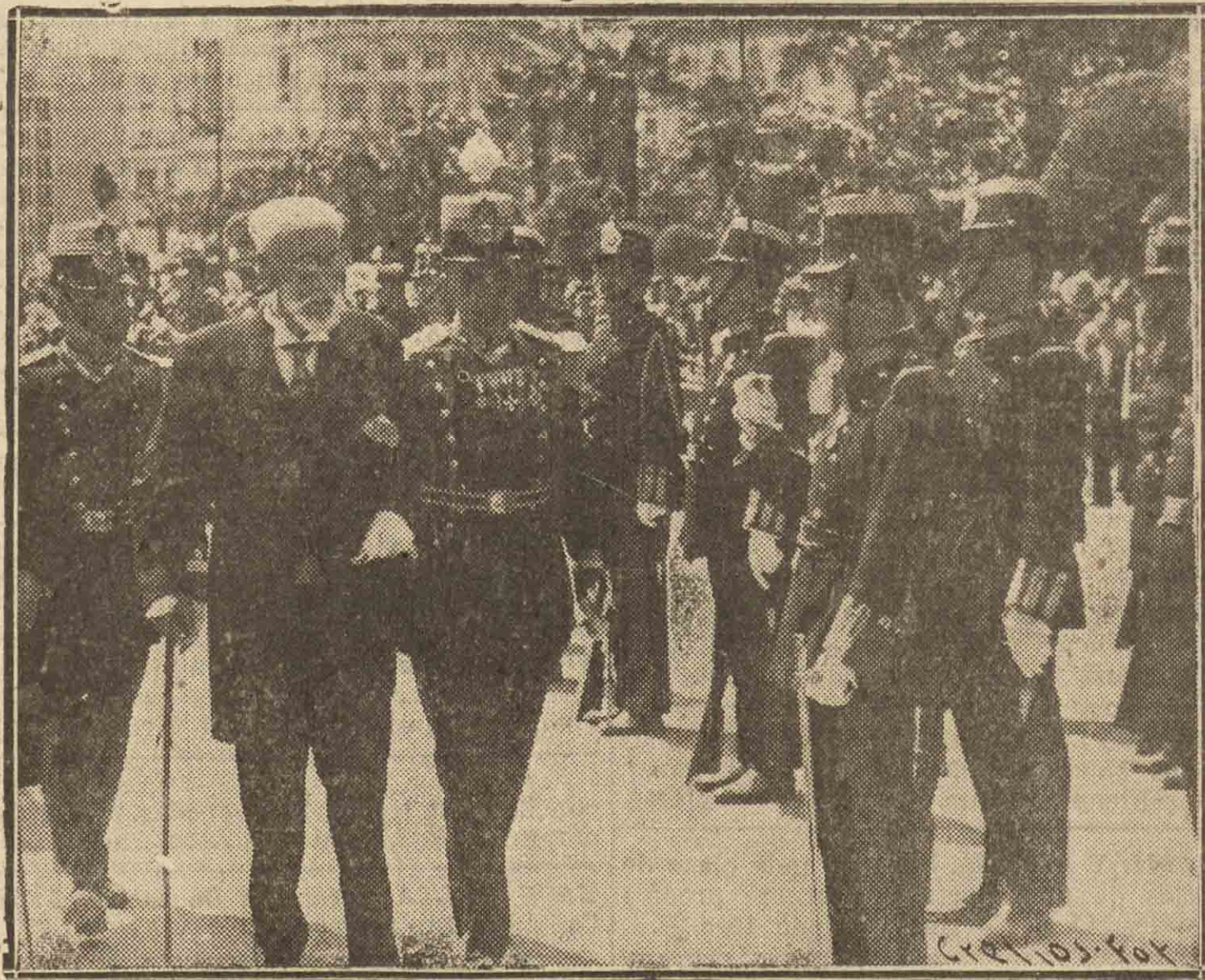
MADRID.—El veterano general Luque pasando revista a los milicianos formados ante el obelisco del Paseo del Prado