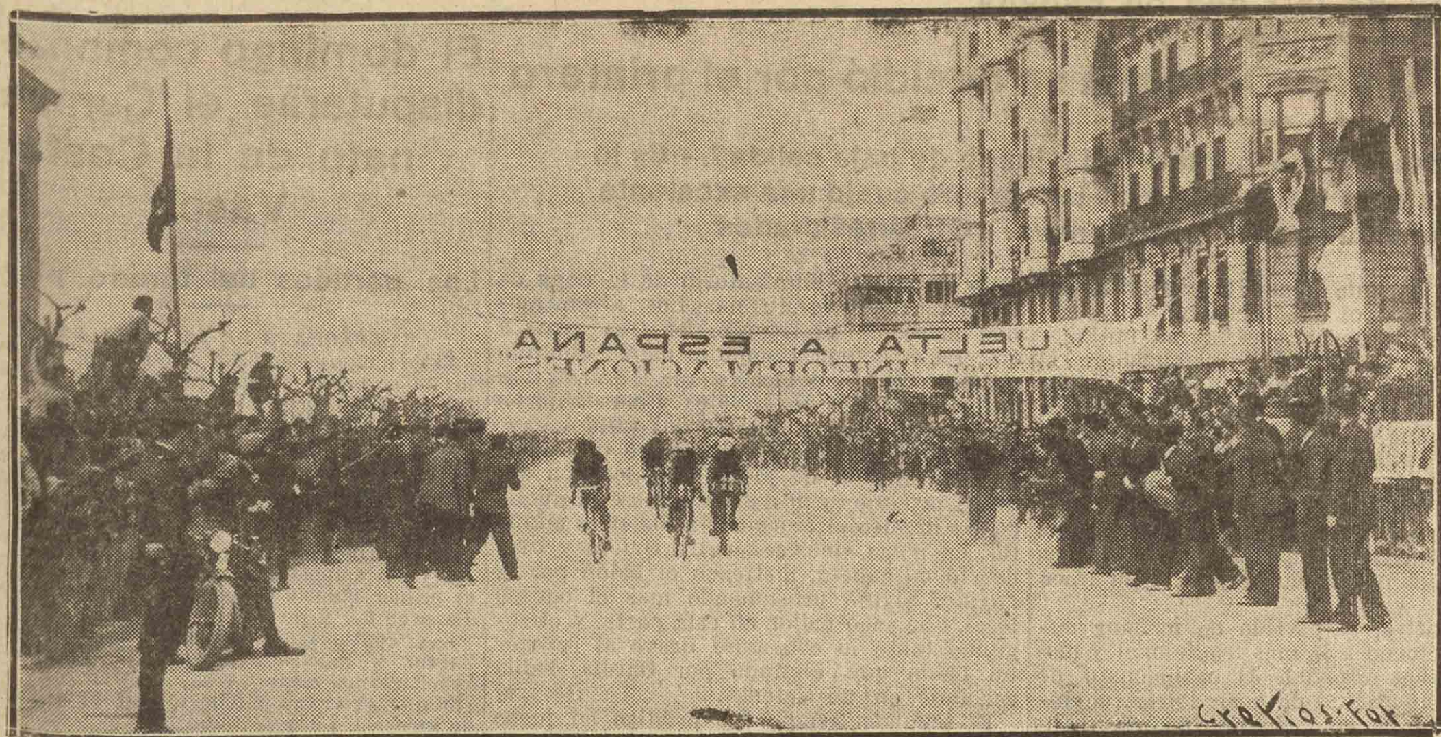
Llegada de otro grupo de corredores ciclistas a la meta