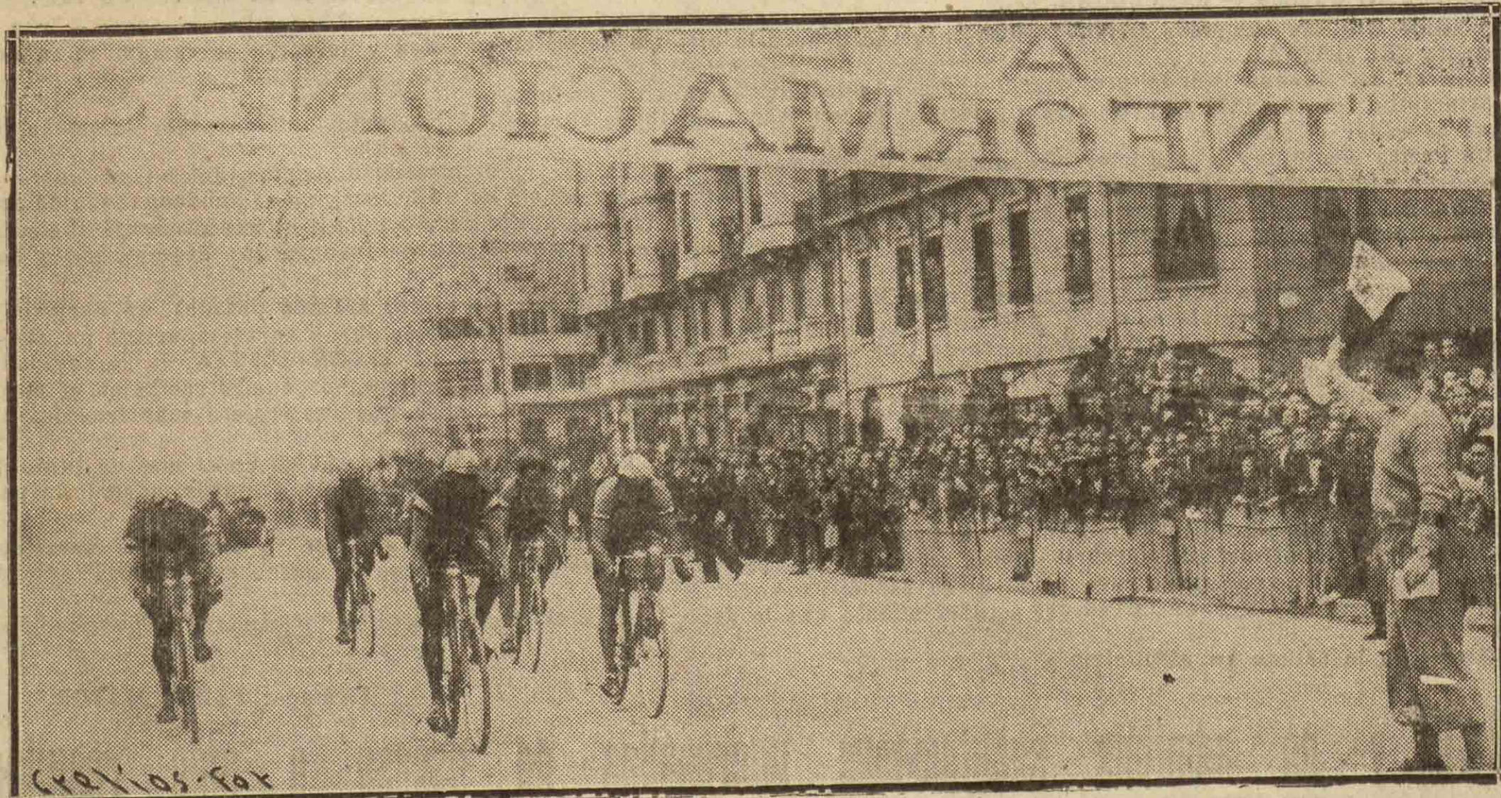
Llegada del primer pelotón de corredores a la meta del Gran Kursaal