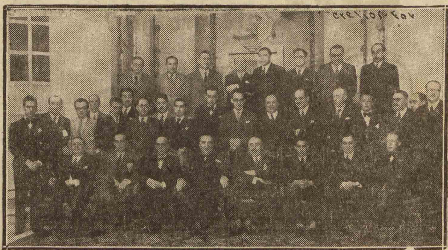
MADRID.—El presidente de las Cortes, don Santiago Alba, con los periodistas que hacen información parlamentaria, a los que obsequió con un banquete