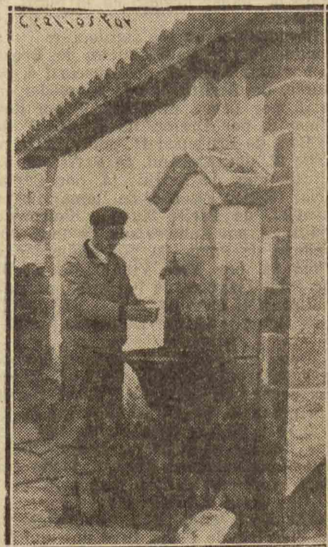
La fuente de «Iñarbil», del barrio de Errazu, donde aún existen el vaso y su cadena, colocados hace 27 años.