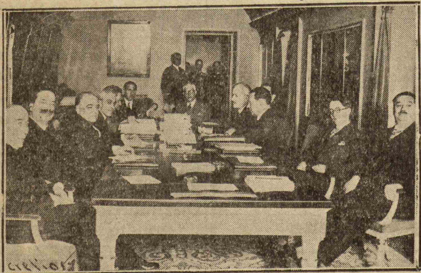
MADRID.—En el ministerio de Estado se reunieron los delegados españoles y franceses que han de estudiar las bases del acuerdo comercial entre los dos países