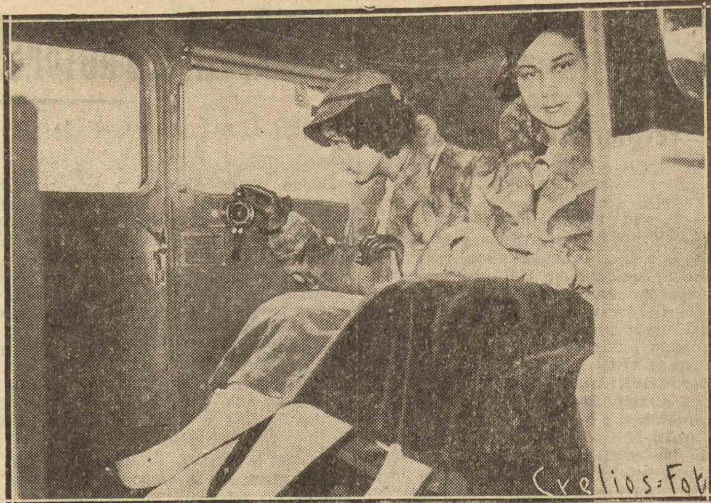
En París han adoptado los taxis la telefonía sin hilos. Es un truco hábil para que el usuario, si es megalómano, utilice el vehículo para servicios inverosímiles. Por ejemplo, del bulevar de los Capuchinos a la Magdalena dando la vuelta por el Trocadero, orilla del Sena Nuestra Señora, etc... La foto muestra dos "demoiselles" en un taxi provisto de Radio. Y a lo mejor quieren oír a la Misstinguette o a la Sorel contar la historia del Diluvio vivida por ellas