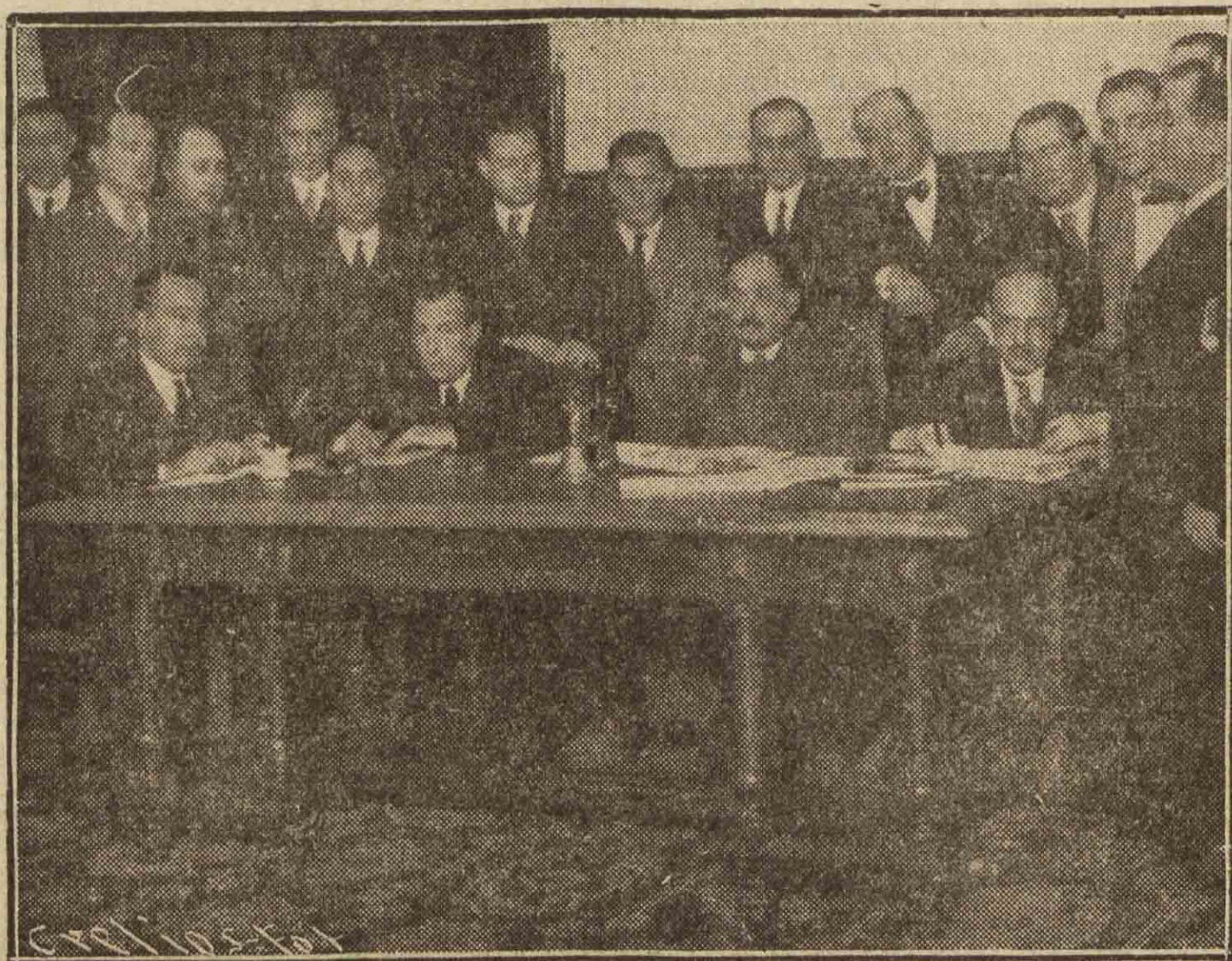
La minoría del partido reunida en el Congreso de Diputados para tratar de su retorno al Parlamento.