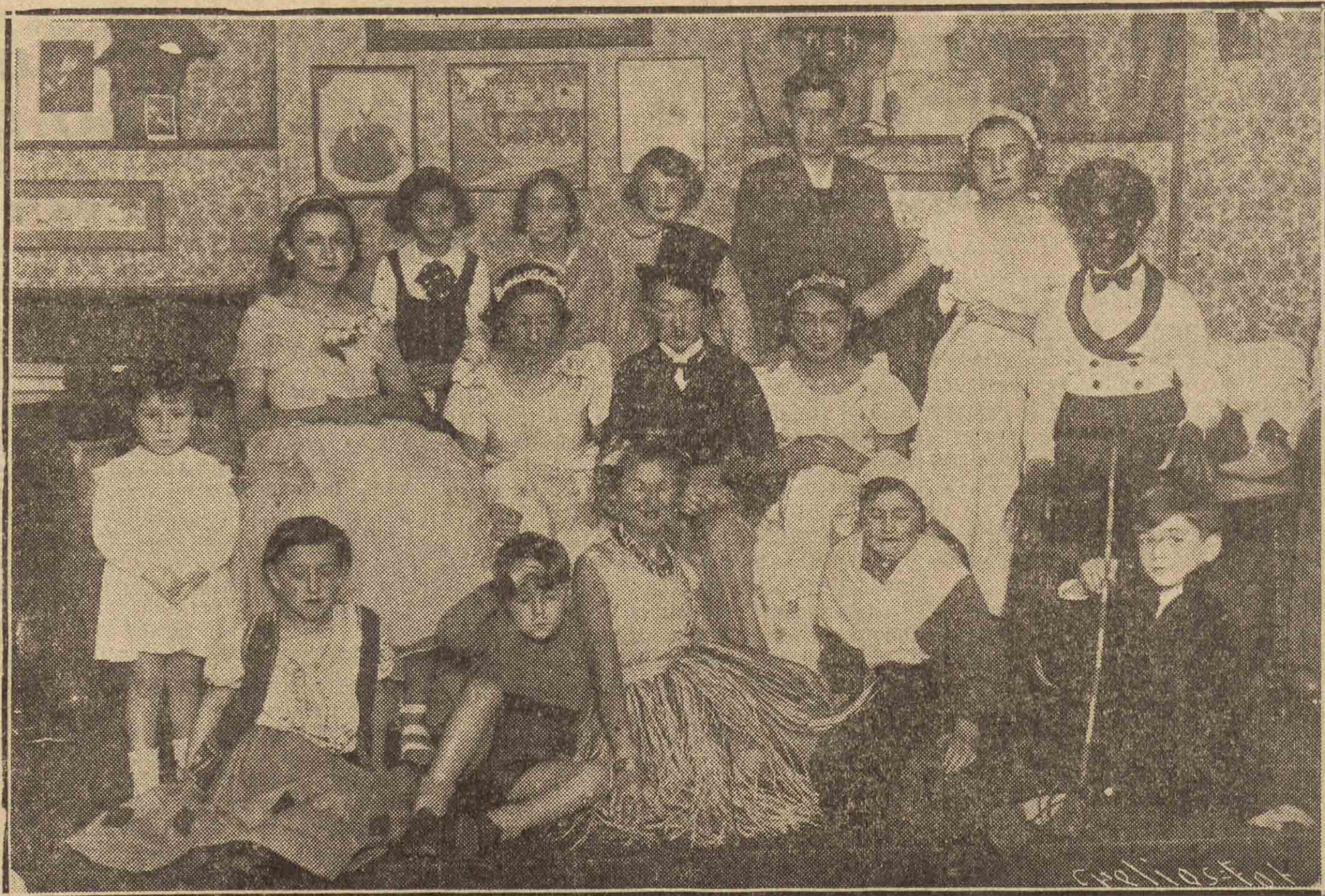
Grupo de pequeños artistas que con tanto éxito actuaron en la fiesta infantil celebrada ayer en el Ateneo Guipuzcoano