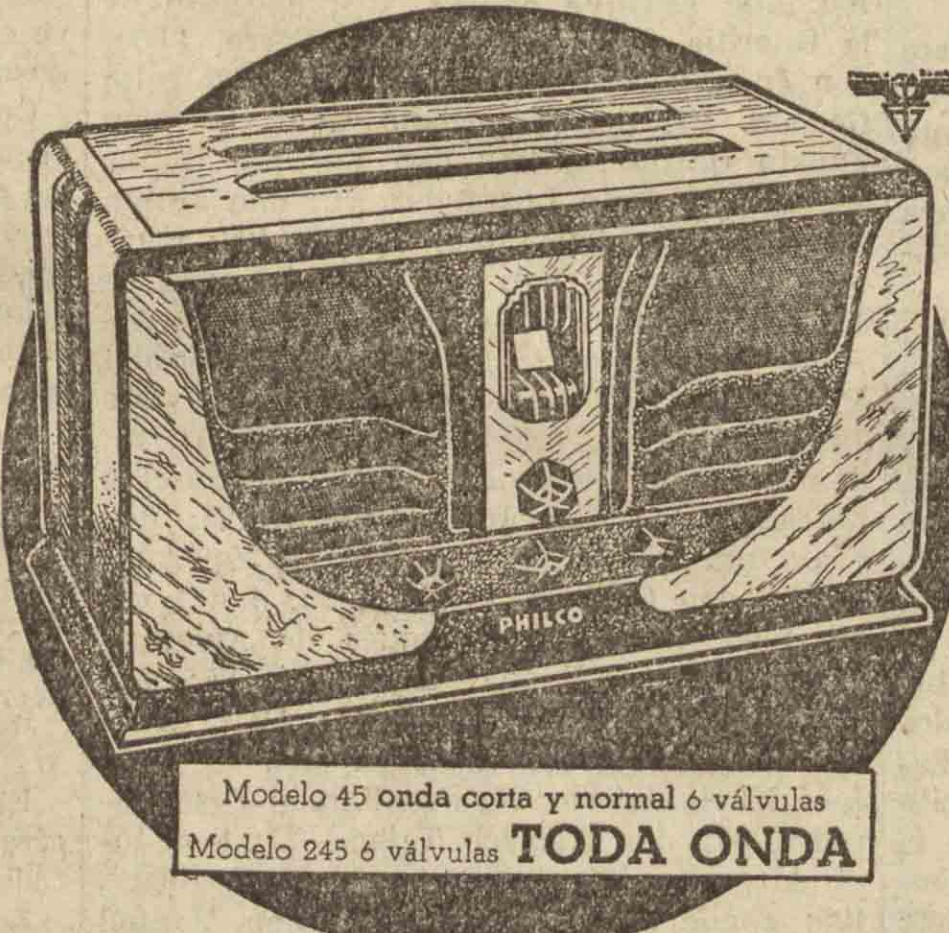
Modelo 45 onda corta y normal 6 válvulas Modelo 245 6 válvulas TODA ONDA