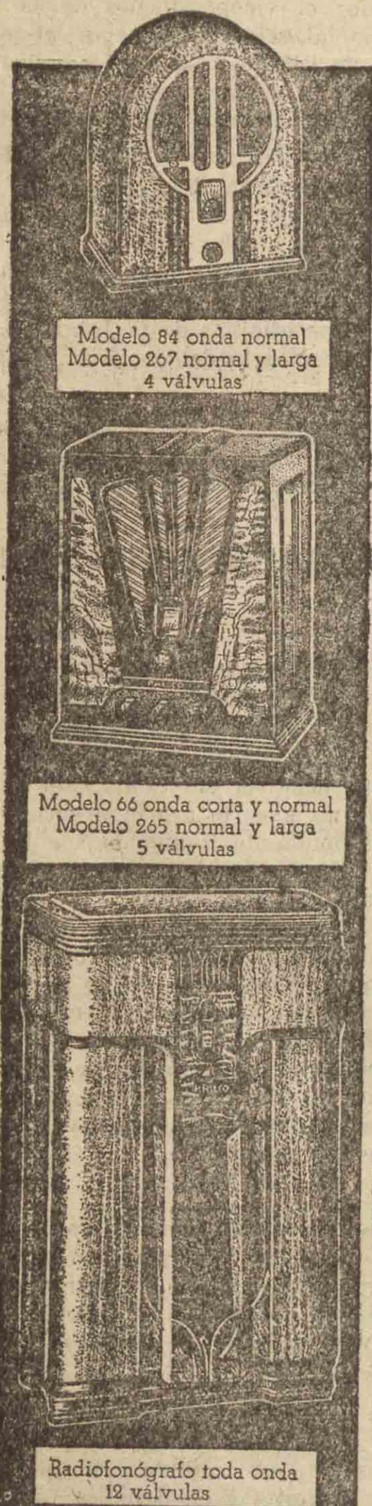
Modelo 84 onda normal Modelo 267 normal y larga 4 válvulas

a cuantos pueda interesar los adelantos en radio-receptores oír nuestros aparatos y comprobar su rendimiento y la fidelidad máxima de reproducción que poseen, además de lo razonable de sus precios, cualidad sin competencia debido únicamente a nuestra enorme producción. La fabricación de la PHILCO representa el 55 por ciento de la producción total americana.