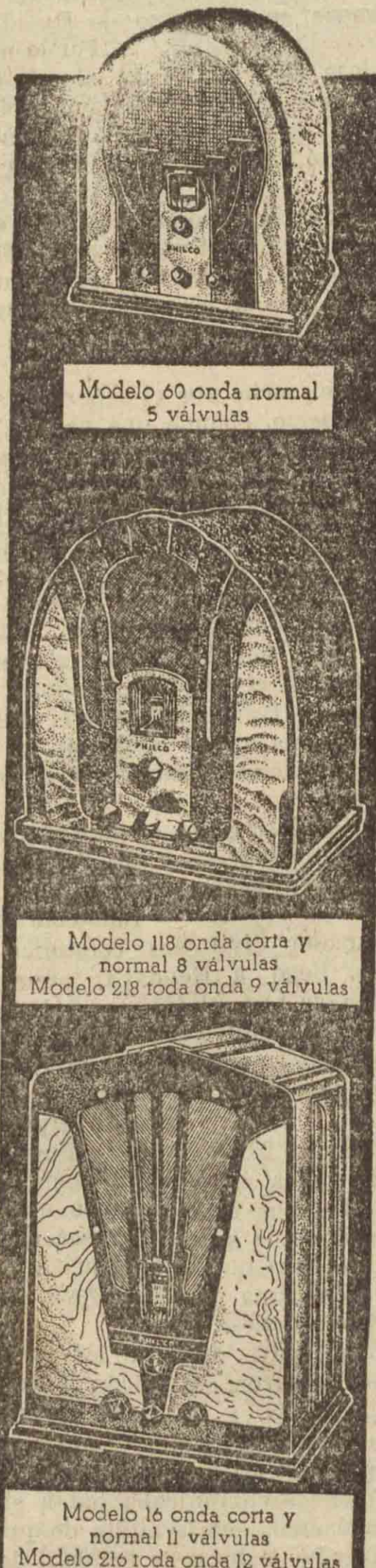
Modelo 60 onda normal 5 válvulas