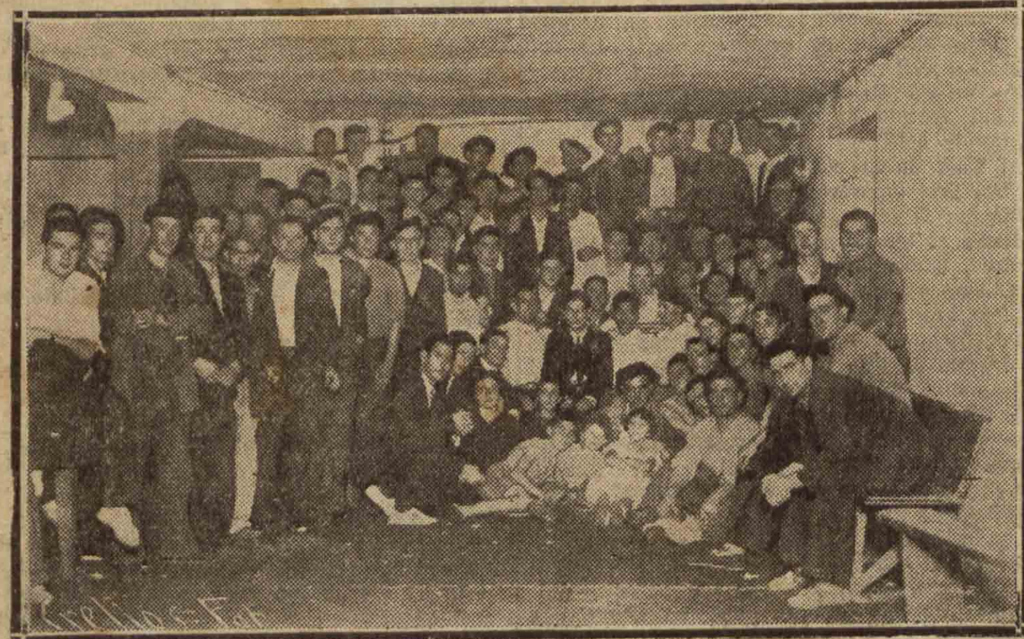
Hace unos días, la Piña Taurina de Rentería obsequió con un homenaje al torero «Chiquito de Rentería», homenaje en que participó también «Jardines», el modesto y popular novillero.