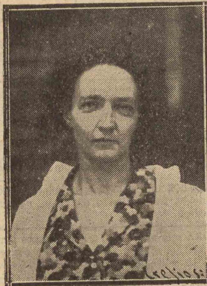
Madama Joliot-Curie, la hija de los famosos descubridores del radio, y que ha descubierto, tras largas y pacientes investigaciones, en las que trabajó también con su madre, un sustitutivo del radio.

Proa al sol, para ofrecérselo a un niño, va el navegante solitario, cuya buena suerte deseamos sinceramente.