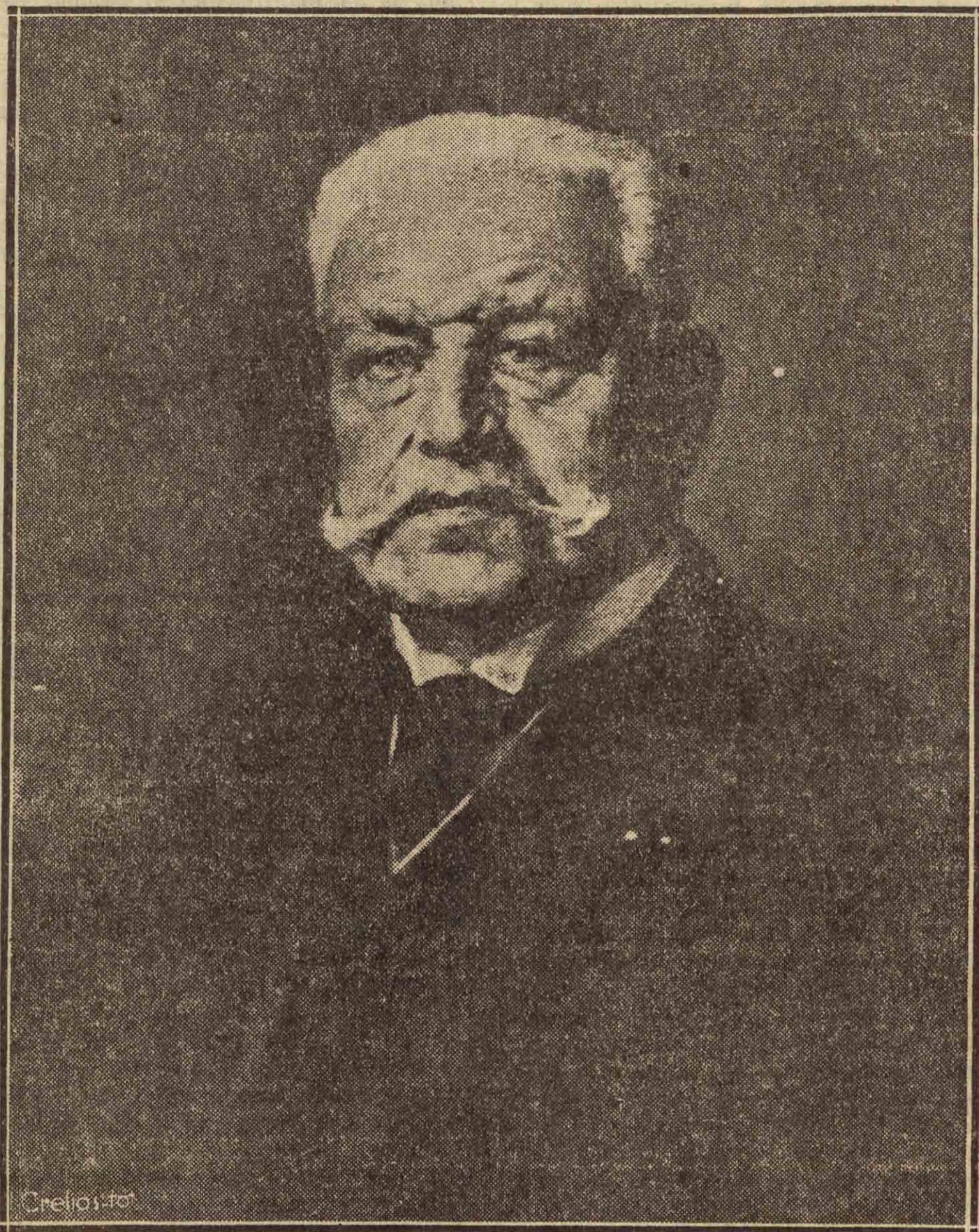
presidente de la República alemana, fallecido ayer en Neudeck.

El 8 de agosto de 1918 la derrota era clara. Sin embargo, Hindenburg esperaba sacar partido de una defensa estratégica; pero la deserción de Bulgaria, que provocó el hundimiento del frente macedónico, y el abandono de Turquía y de Austria redujeron a Alemania a sus propios recursos. Hindenburg y Ludendorff esperaban aún que la nación alemana consiguiera nuevos sacrificios; pero la moral del ejército había decaído de tal forma que disi-