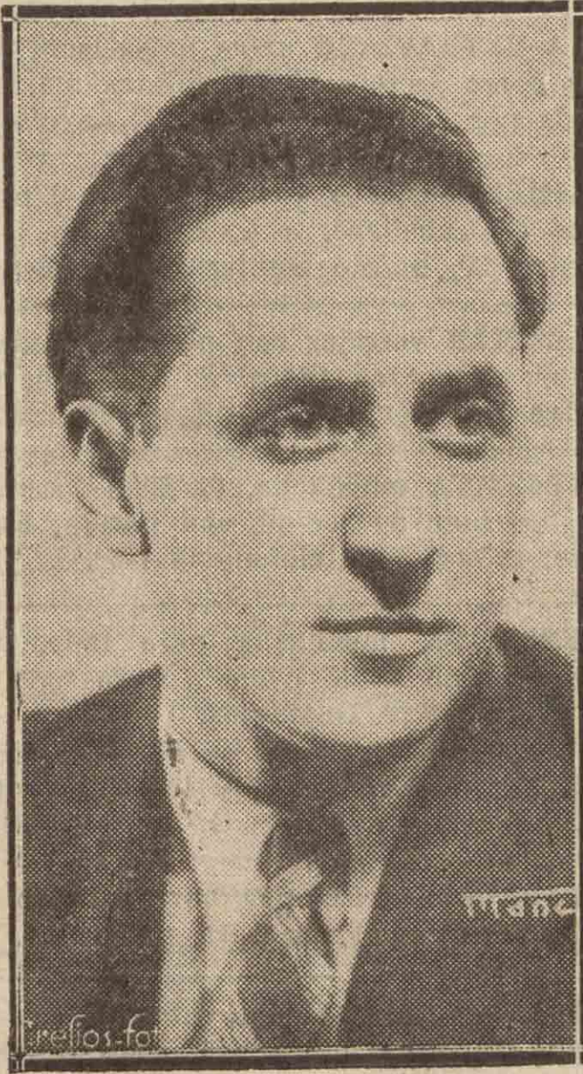
NICANOR ZABALETA, el gran arpista donostiarra que triunfa en América

Como todos los triunfos de nuestros artistas nos congratula éste de Nicanor Zabaleta, que inicia su verdadera vida de artista—ya que hasta ahora considerábamos su labor como incipiente artística—ha de ganar muchos triunfos, porque posee un gran temperamento, es un gran músico, excelentemente preparado y como instrumentista es admirable, tanto que lo habrán de decirnos los públicos ante los