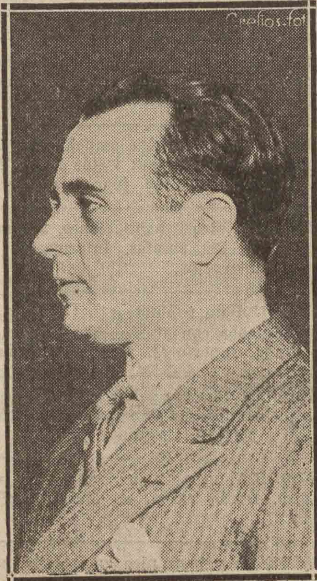
PEPE ITURBI, pianista formidable, director de orquesta, que se ha adueñado de América