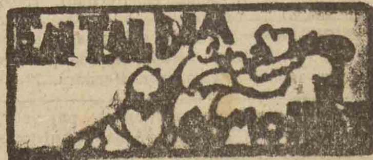
SAN SEBASTIAN HACE 30 AÑOS

Siendo numerosos los ataques al Concierto Económico concertado con el Estado, tratando éste de establecer impuestos directos en estas provincias, como el del lujo, rentas y del Estatuto del Vino, pedimos a los delegados gestores, que si no se sienten con energías suficientes para defender al ataque del poder central a nuestras autonomías, deleguen en los Municipios, como representantes del pueblo, en la seguridad de que éstos harán una enérgica defensa de los intereses de todo el país vasco.—EL COMITE.