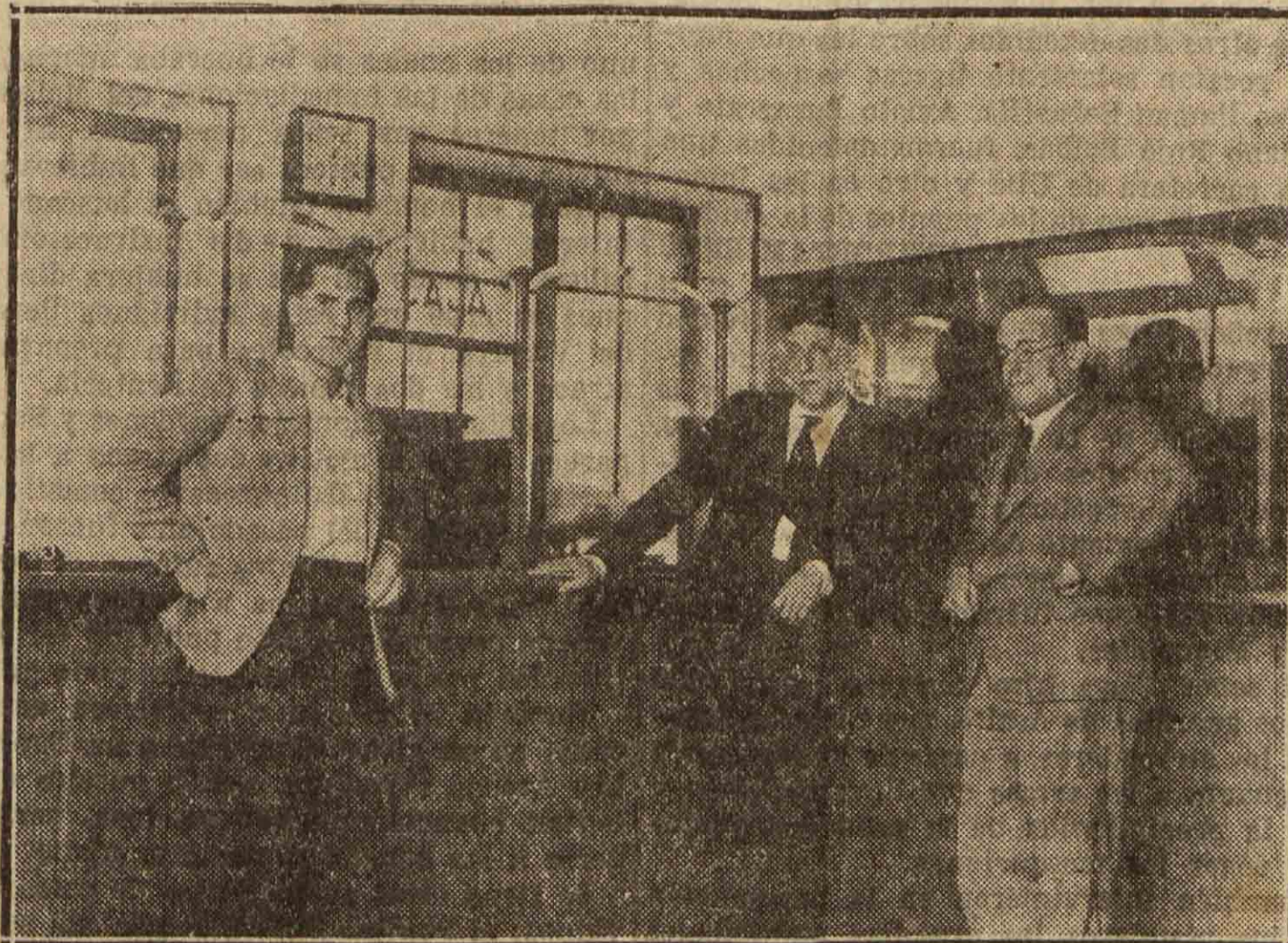
El director y empleados de la Sucursal del Banco de San Sebastián, después de cometido el asalto

A las diez menos minutos de la mañana se recibió la noticia en el Gobierno civil—el señor Muga se encontraba en su despacho desde las nueve—de que en Rentería se había cometido un doble atraco a dos sucursales de Bancos instaladas en aquella villa. Según la versión que le fué facilitada, dos individuos penetraron en el Banco Guipuzcoano, armados de pistolas, y en tanto uno de ellos quedaba en la puerta, guardando la salida, el otro, poniendo un pie en el mostrador, saltó la cancela, pene-