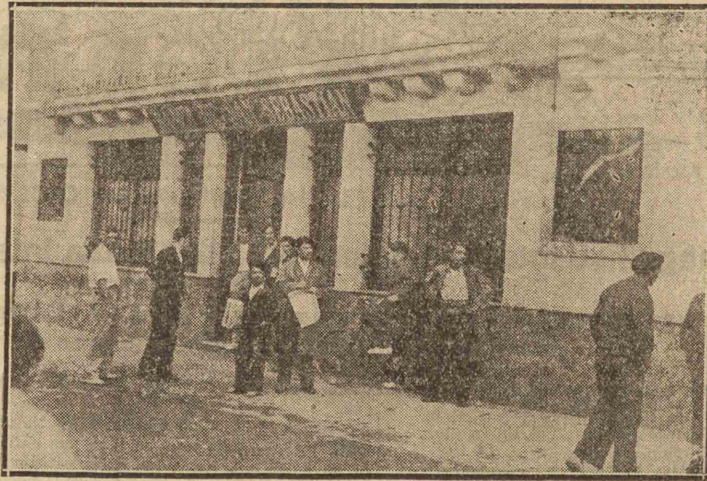
La Sucursal del Banco de San Sebastián, simultáneamente asaltado por los pistoleros

grito de ¡Manos arriba! obligaron a los tres empleados, juntamente con el director y ordenanza a levantarse de sus puestos. Los amenazados instintivamente se dirigieron a la puerta trasera con objeto de evadirse, más los atracadores se dieron cuenta, obligándoles a agruparse en un lado de la oficina para ser más tarde encerrados en el water.