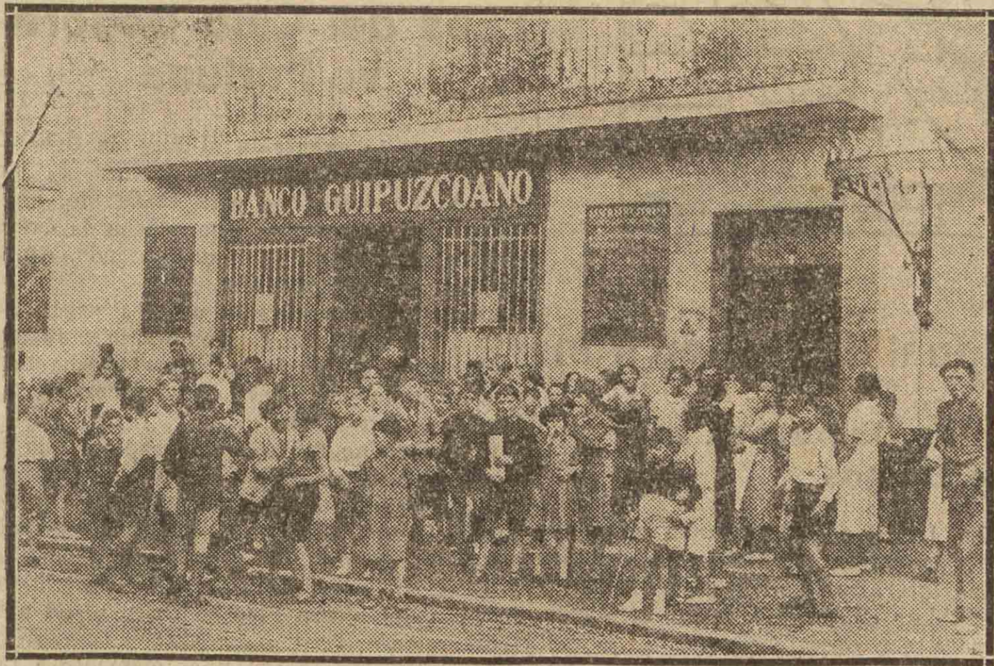
Fachada de la Sucursal del Banco, luego del atraco y ante el cual se han reunido los pequeños renterianos para hacer su comentario