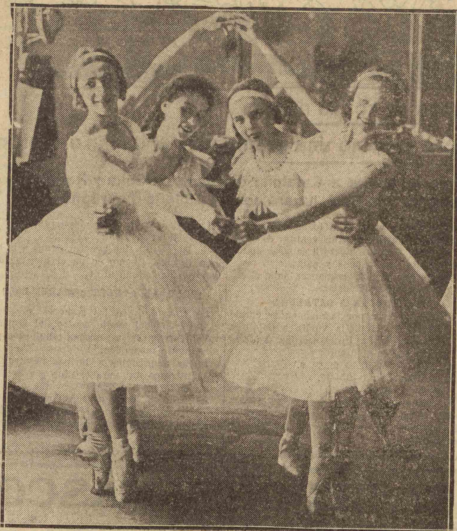
Aún no ha muerto. Y vivirá... en el conservatorio de París se ha celebrado un concurso de danzas clásicas. Y estas cuatro jovencitas han sido de las bailarinas, aspirantes a figurar en el cuerpo de baile de la Ópera