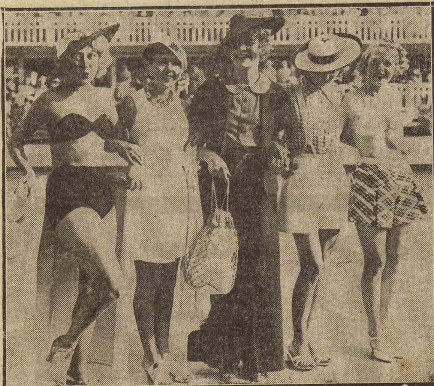
En París hay una piscina, un Casino elegante, que debe de ser algo nuevo, algo como el "Casablanca" de Madrid, pero aún mejor, con agua que en vez de salir por surtidores sirve para el chapuzón. En ese Casino se organizan y se hacen grandes fiestas, incluso para niños, pero espaciando el espectáculo para purificar el ambiente. En una de esas fiestas, muy reciente, la parte principal correspondió a conocidas artistas de París... Era la fiesta náutica, según el anuncio, pero debió de denominarse la fiesta del aborro, porque excepción hecha de la artista del centro, que hizo un derroche de tela muy en consonancia con el tiempo de su vida, las demás han economizado tela.