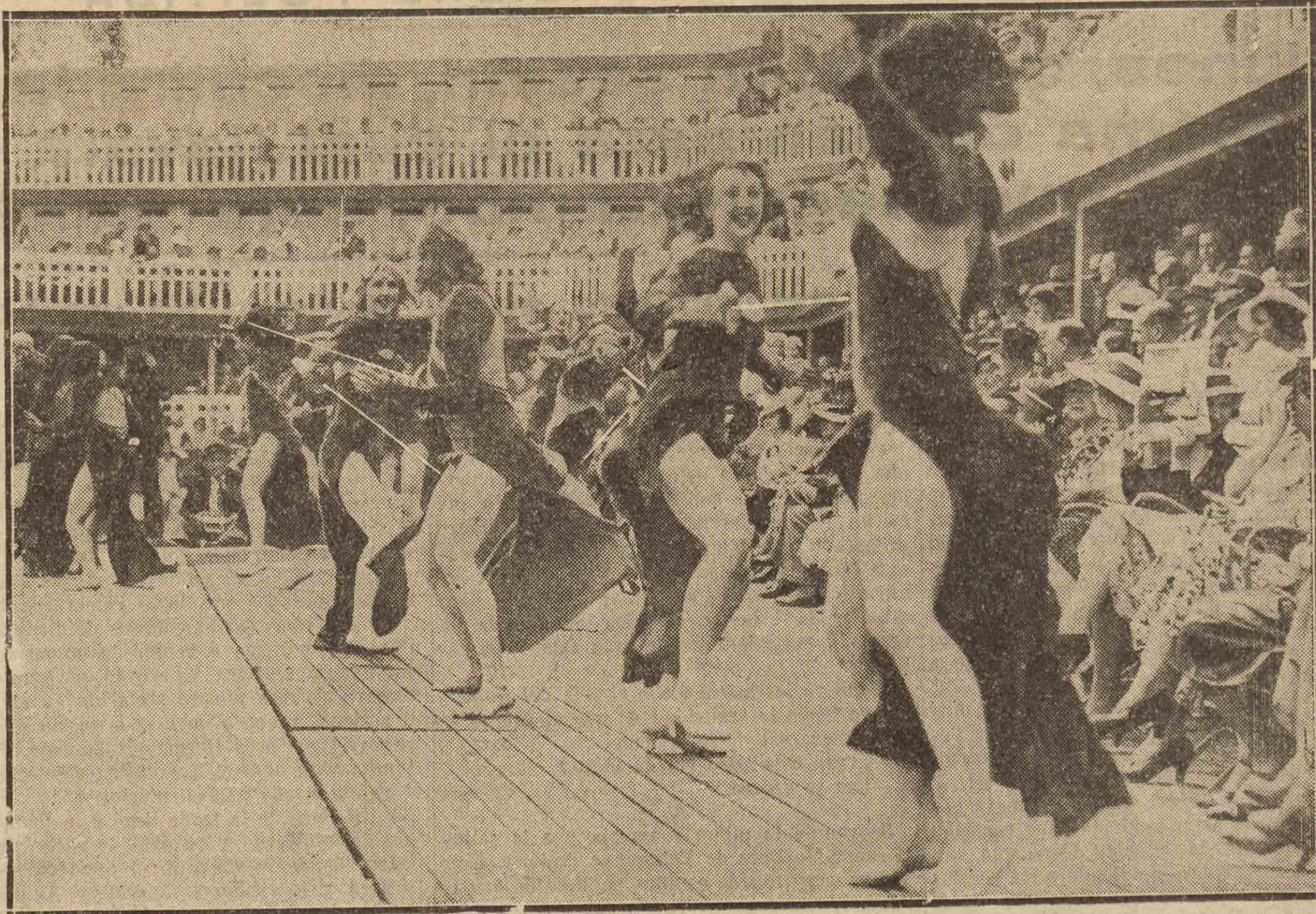
A pesar de que las damas actuantes no visten "maillot" por ropaje externo y de que manejan floretes, esto es una fiesta náutica y lo que hacen en esa "hizarra" posura es un "ballet". Si, son las chicas de Hoffman, no el de los cuentos, que también han tomado parte en el festival desarrollado en la piscina de moda parisina, como puede verse, acude el mundo elegante.

Como de costumbre, en la plaza se reunirá buena parte del vecindario donostiarra.