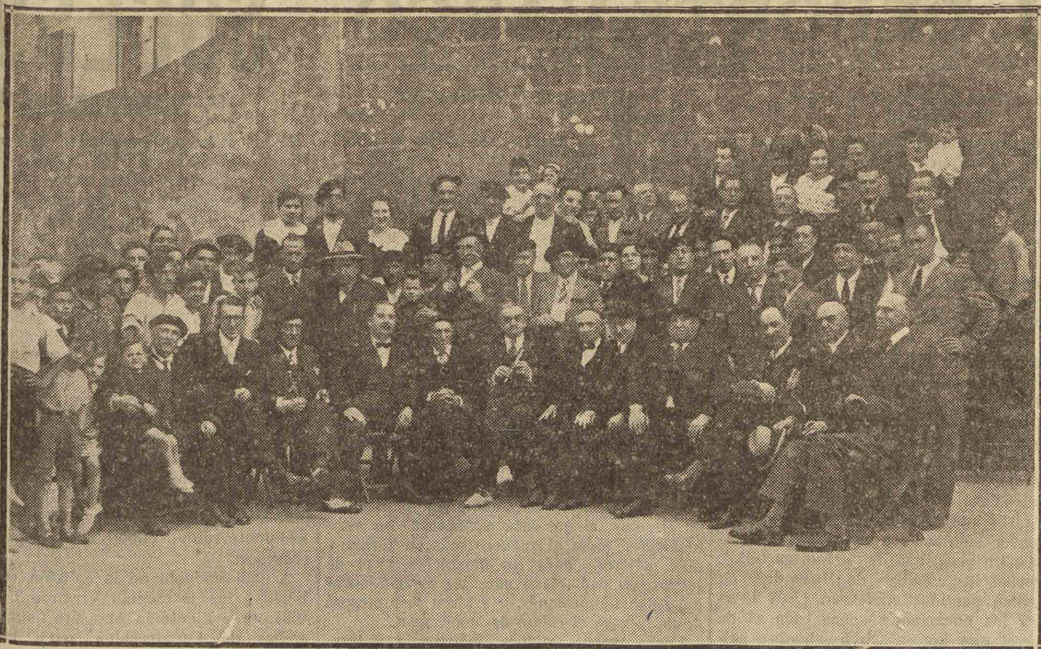
Los viejos liberales que asistieron en Hernani a los actos que ayer se celebraron en aquella villa.