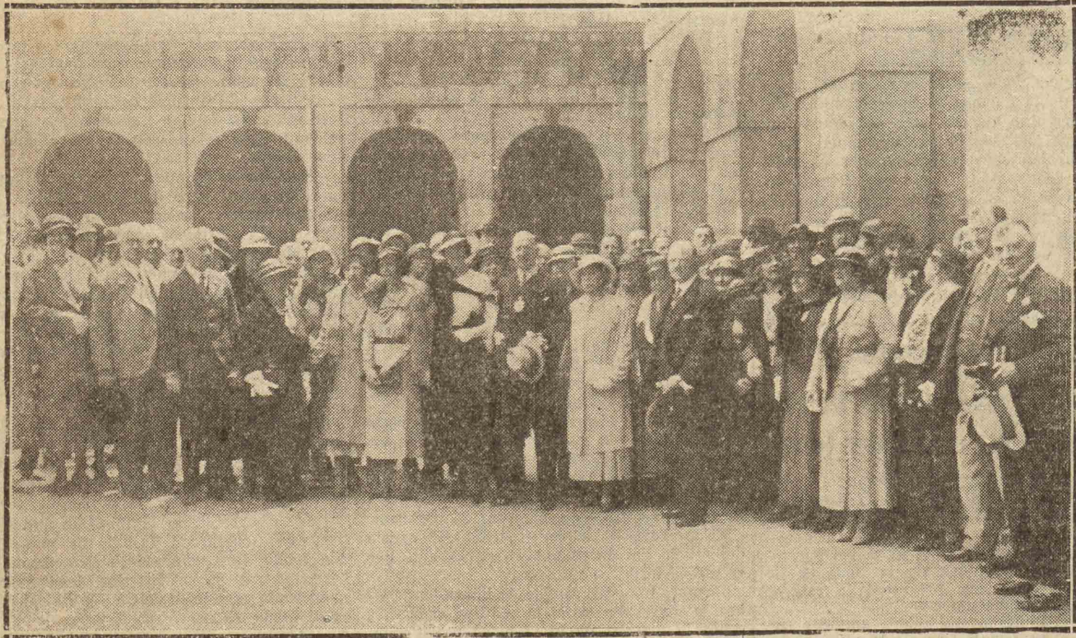
El grupo de excursionistas de "The City Livery Club", que ayer visitó al Ayuntamiento, con su presidente sir George Wilkinson y acompañados del vicecónsul británico en San Sebastián

Durante el almuerzo, los txistularis y danzaries del itaron a los extranjeros