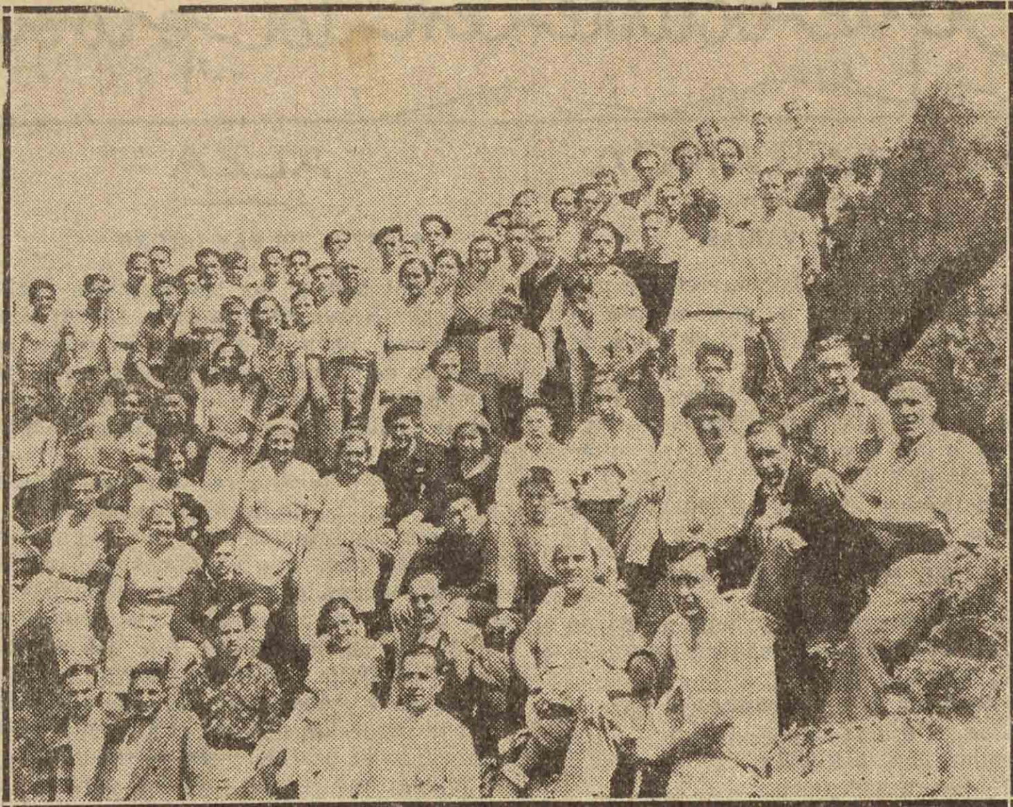
Alpinistas guipuzcoanos y vizcainos que se reunieron en la cumbre del monte guipuzcoano de "Karakate" para inaugurar la fuente construida por la Federación Vasca de Alpinismo