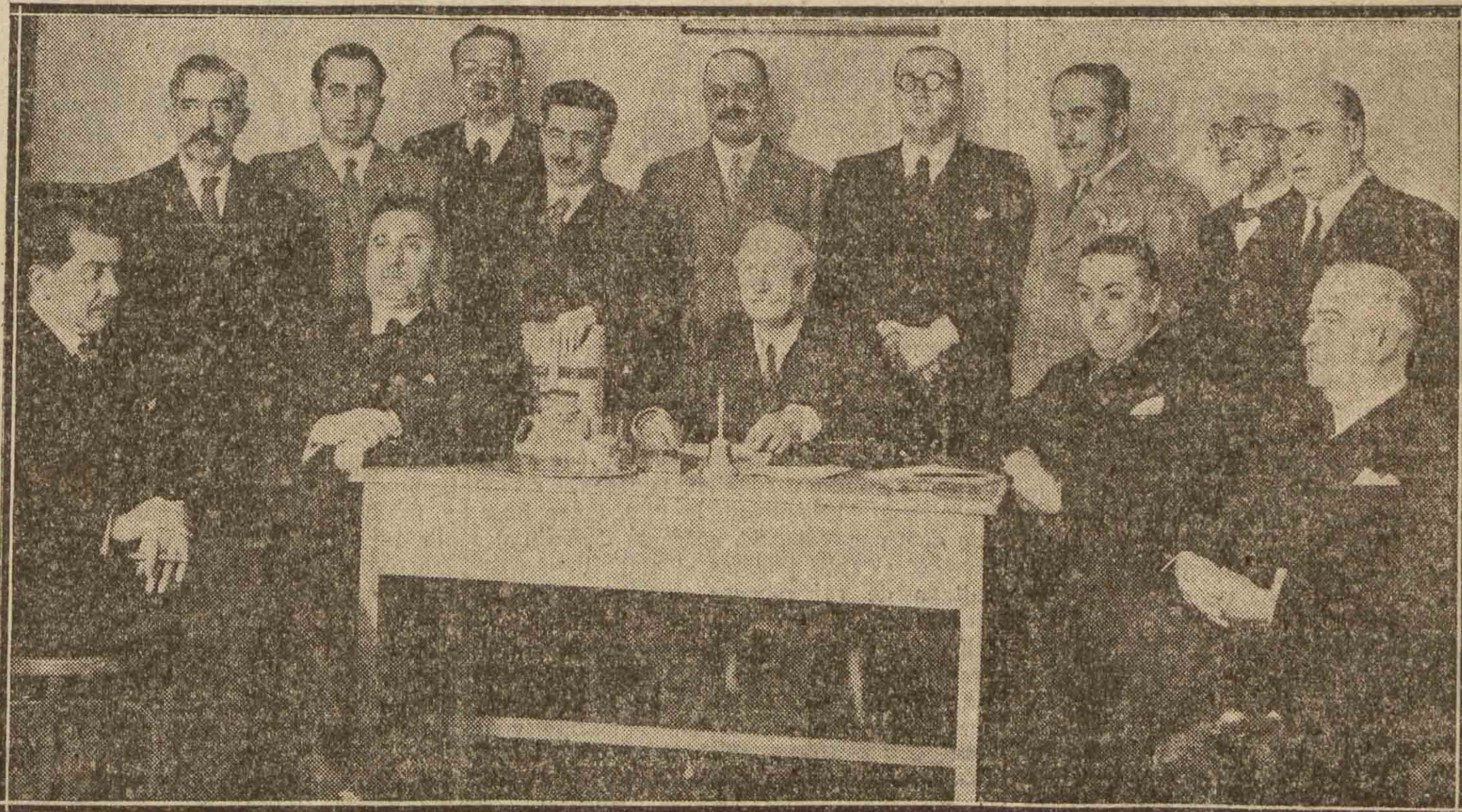
He aquí reunido al Consejo Nacional del Partido Radical, bajo la presidencia de su jefe, don Alejandro Lerroux. De esta reunión ha salido la escisión de Martínez Barrio, que se aparta del grupo del bien que produciría al régimen la unión de todos los auténticos republicanos, se ofrece esta nueva división, nacida de un anterior "malentendu", acaso más que divorcio

Según manifestaron ayer por la tarde algunos radicales disidentes, hoy, viernes, volverán a reunirse en el domicilio del señor Martínez Barrio para acordar la formación de una nueva fuerza política.