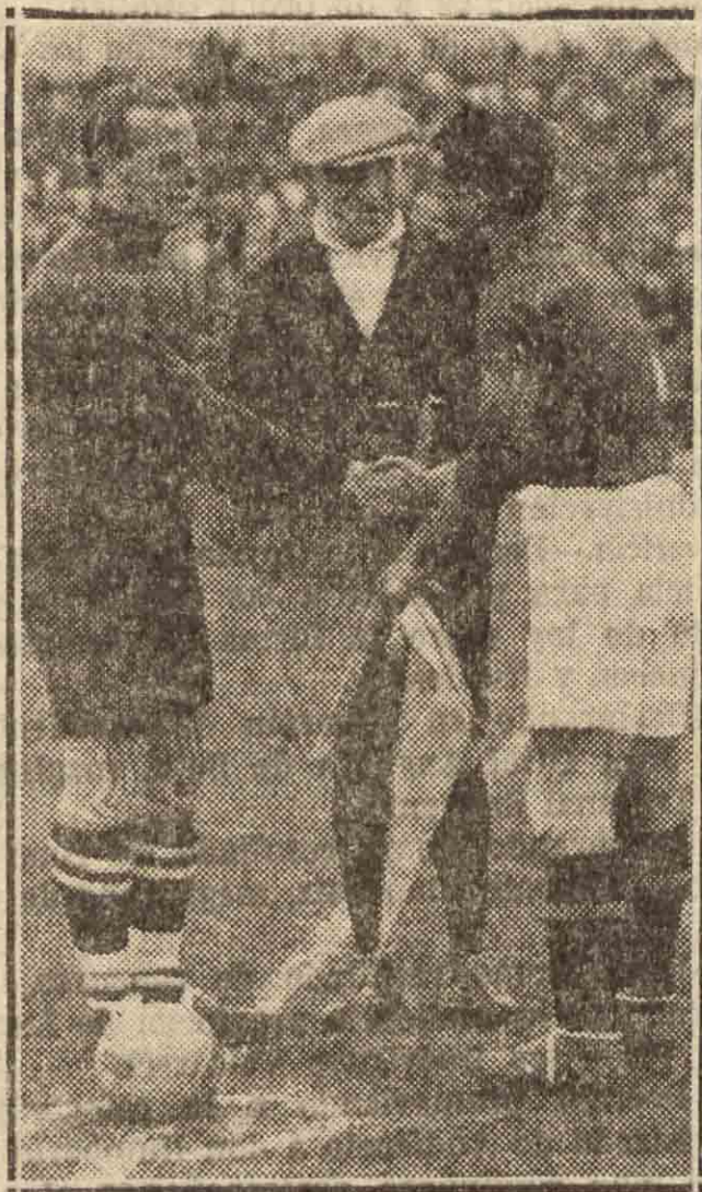
MADRID.—El árbitro belga Van Praag con los capitanes español y portugués cambiando los saludos de ceremonia y disponiéndose a sortear los campos.

Comienza el ceremonial de rigor. Salen los equipos. Las ovaciones se confunden