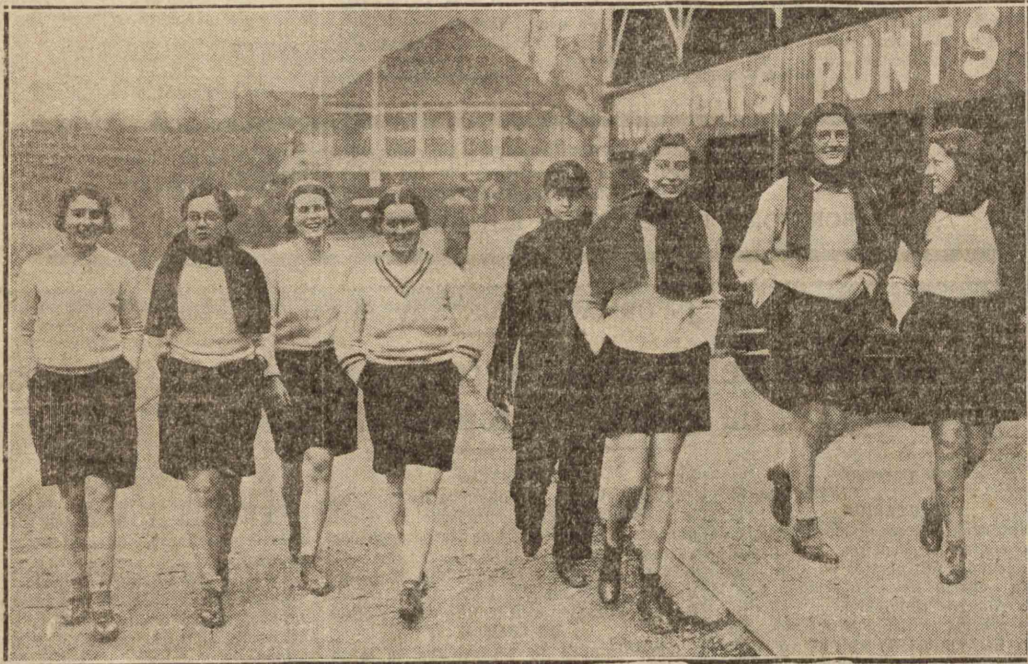
INGLATERRA.—El deporte del remo, está vinculado, en la Gran Bretaña, a una competencia anual famosa: Oxford y Cambridge. Fuertes "boys", en un día revestido de sensacionalidad, juegan deportivamente sobre sus embarcaciones, a este deporte tan típico en la nación insular, como de nuestra costa cantábrica. Pero, además de Oxford y Cambridge, hay en Inglaterra equipos femeninos de remo, como el que componen estas ocho muchachas, quienes, en un día de invierno, se dirigen por un muelle a botar su yola al río. Este equipo—las gafas de algunas de sus componentes parece que lo indican—está formado por jóvenes universitarias.

Dirección y Redacción ..... 10-9-89 Administración y Talleres ... 10-0-24