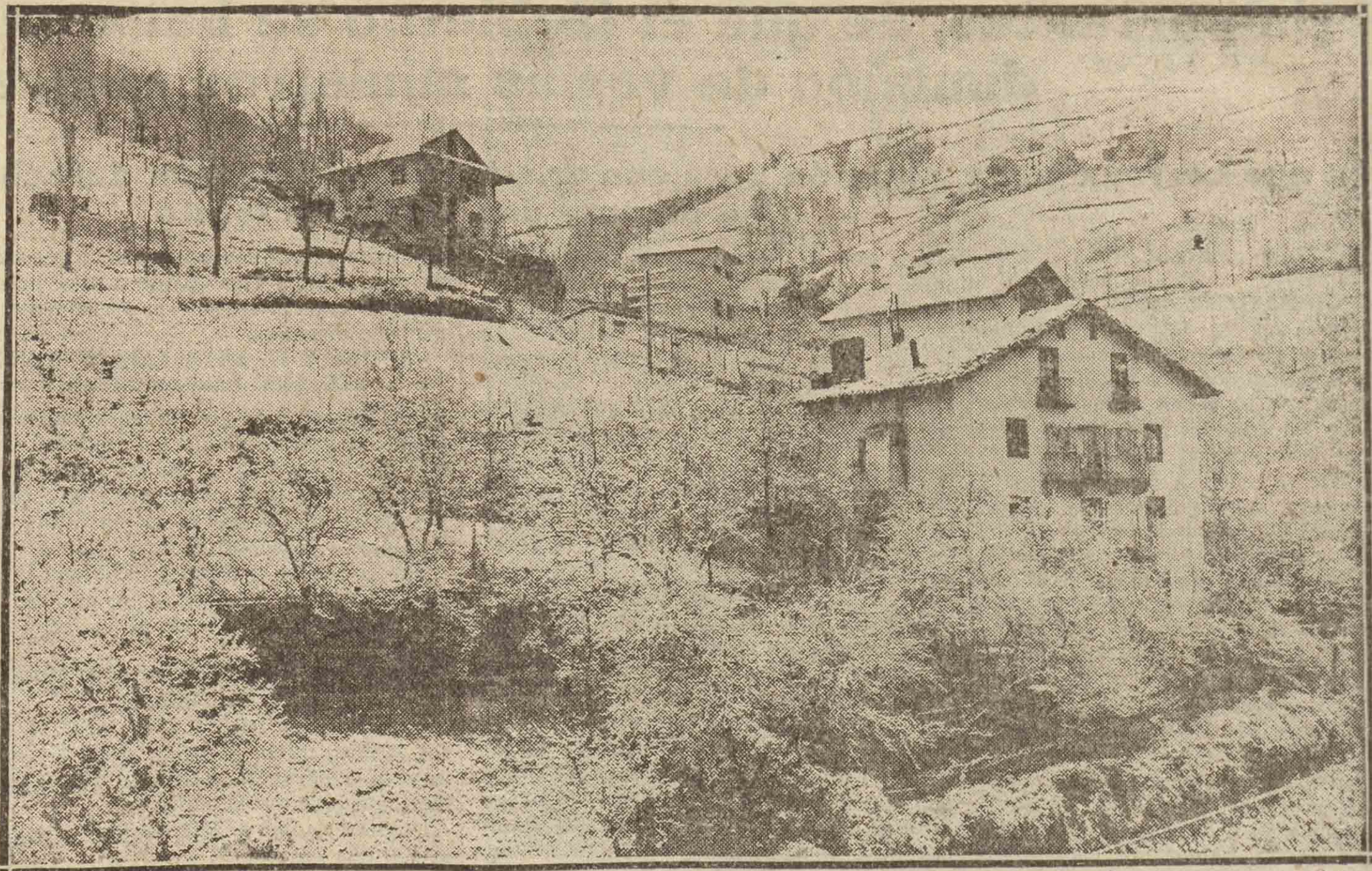
Una vista de "Mekola" y sus alrededores, después de la copiosa nevada que cayó el pasado martes, y que compuso esta bella simulación de la alta Suiza en el corazón de nuestra Guipúzcoa.