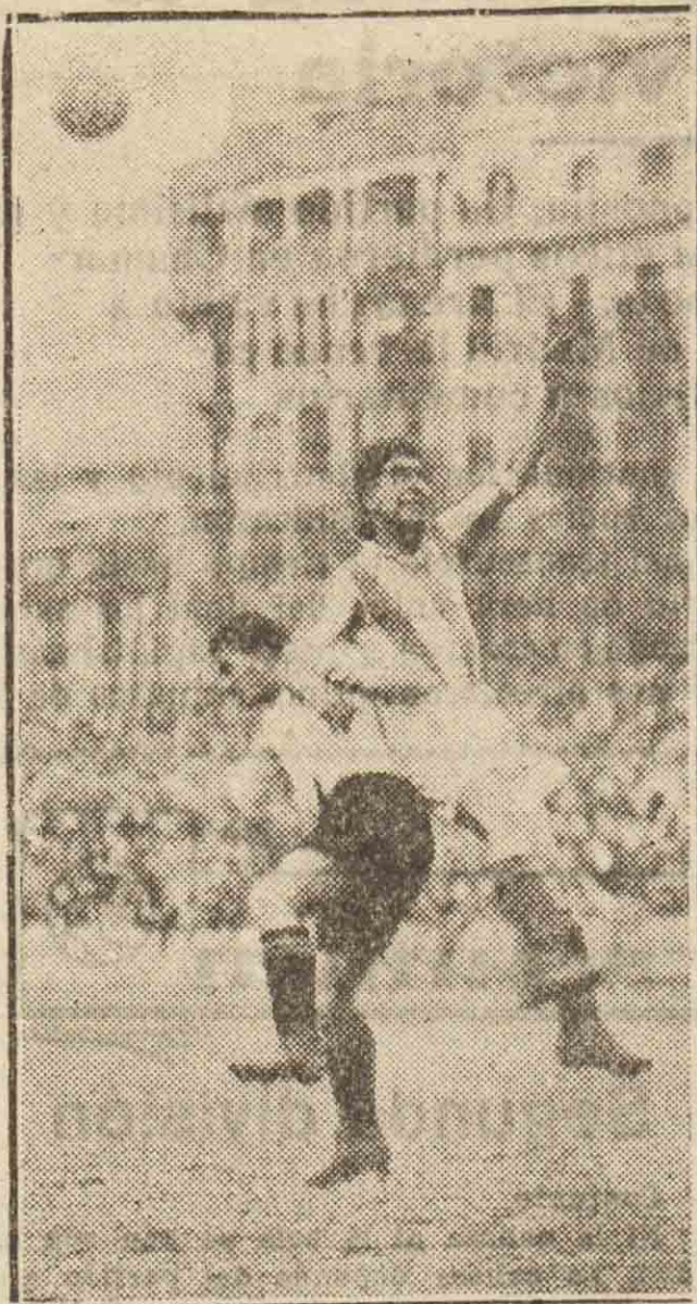
Un interesante momento del partido Donosti - Racing.

PUBLICARA INTEGRA LA VERSION TAQUIGRAFICA DEL TRASCENDENTAL DISCURSO PRONUNCIADO EL DOMINGO EN MADRID POR EL SEÑOR AZAÑA.