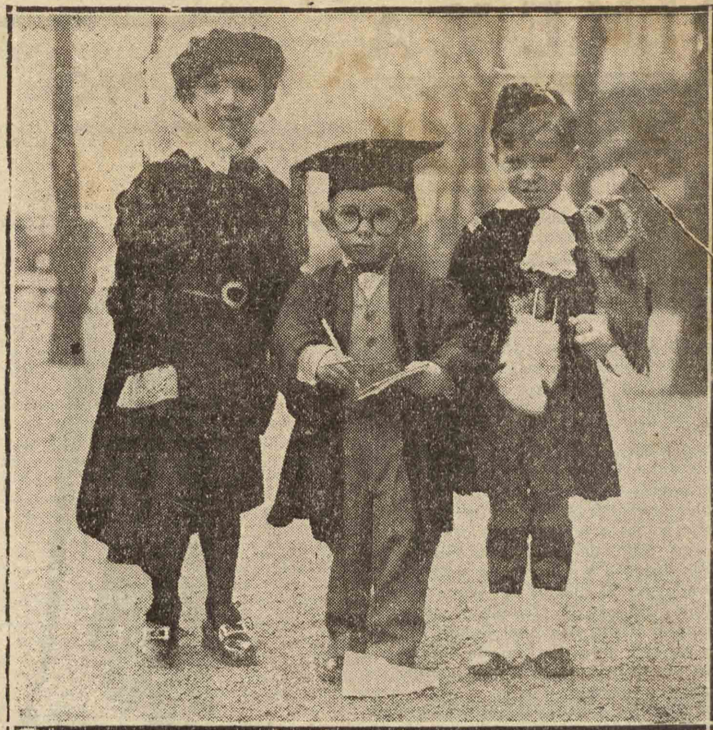
Tres "boys" donostiarras, graciosamente disfrazados.

El magnífico servicio de ambigü, que fué justamente elogiado los pasados días, estará a cargo de Aparicio.