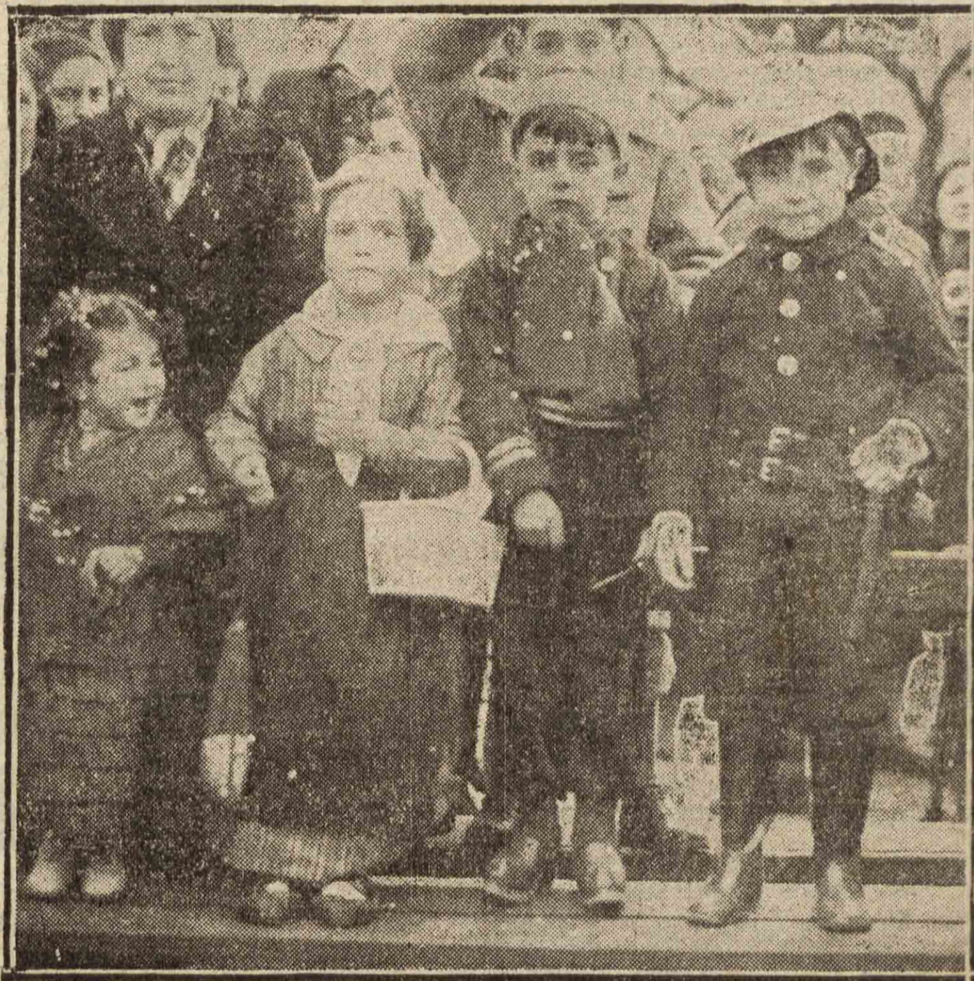
Un grupo de niños disfrazados el domingo de Carnaval.