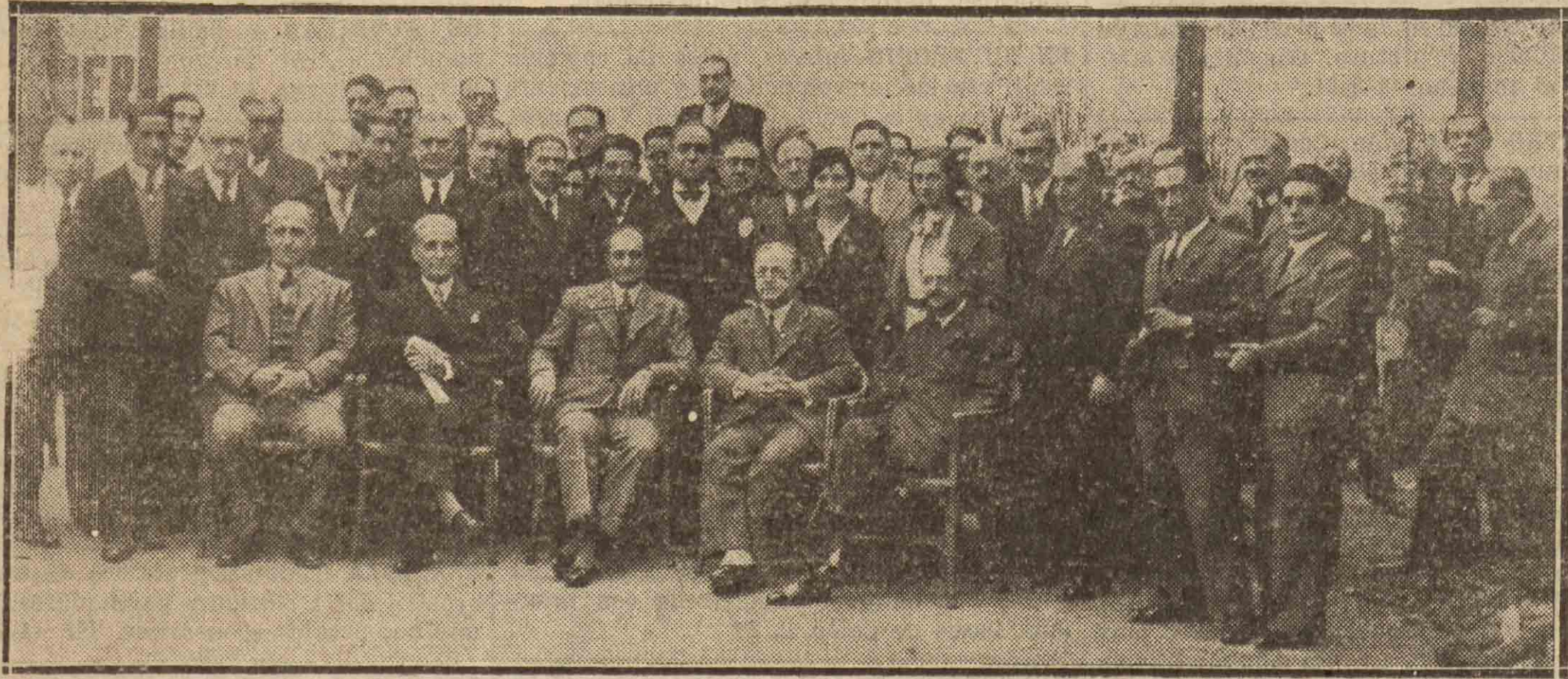
El gobernador y los directivos del Partido Radical, después del banquete celebrado el domingo en el Círculo Radical de Donostia.

Fueron muchos los afiliados al Partido Republicano Radical de San Sebastián y bastantes los que, ostentando la representación de radicales de pueblos de la provincia, se reunieron el domingo en los locales del Círculo Republicano Radical de San Sebastián para, en fraterno banquete, celebrar el 61 aniversario de la primera República Española.