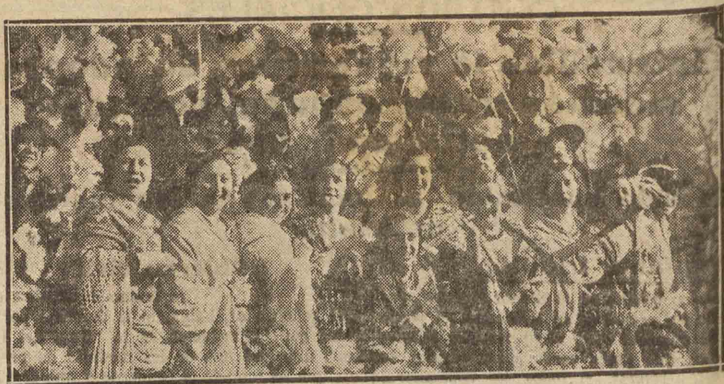
MADRID.—«Kermesse», una de las carrozas—guarnecida de lindas mujeres—que se presentó al concurso celebrado el domingo de Carnaval en la capital de la República.