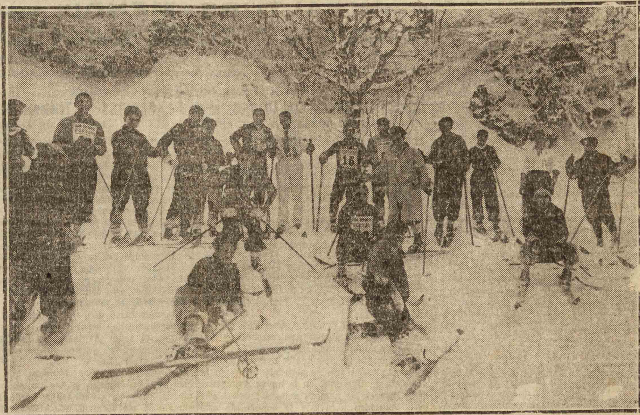
Grupos de "skiadores" del Club Fortuna, en un momento de reposo del campeonato que, organizado por el veterano Club, se jugó el domingo en el puerto de Velate.