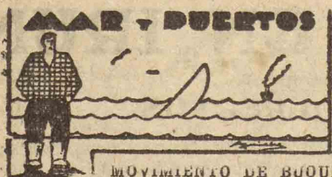
MOVIMIENTO DE BUQUES

El domingo no se registró en nuestro puerto ningún movimiento de buques mercantes.