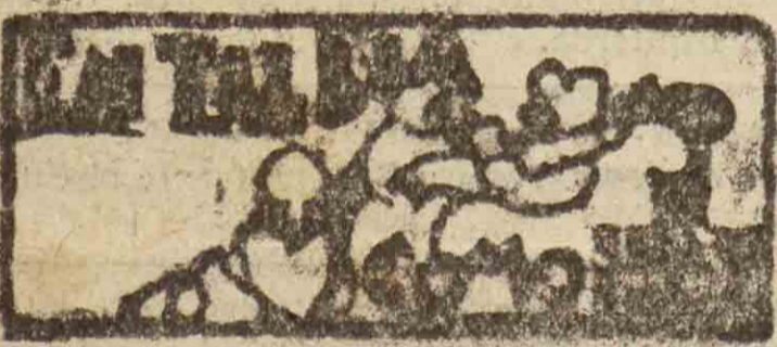
SAN SEBASTIAN HACE 30 AÑOS

27 DE ENERO DE 1904 ~ Para el concierto que la Scholla Cantorum de Pasajes iba a dar en Bellas Artes, a las cinco menos cuarto de la tarde del día siguiente, había muchas localidades mandadas reservar, desde los pueblos de la provincia. De Marsella había venido, para darle un repaso, el constructor del órgano de Bellas Artes—que luego se quemó con el edificio—, y en cuyo órgano iba a ejecutar varias obras el famoso organista monsignor Guillaumet.