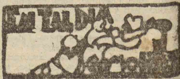
SAN SEBASTIAN HACE 30 AÑOS

Ya decimos también que, a medida que vayan produciéndose las aceptaciones, las iremos comunicando a los lectores.