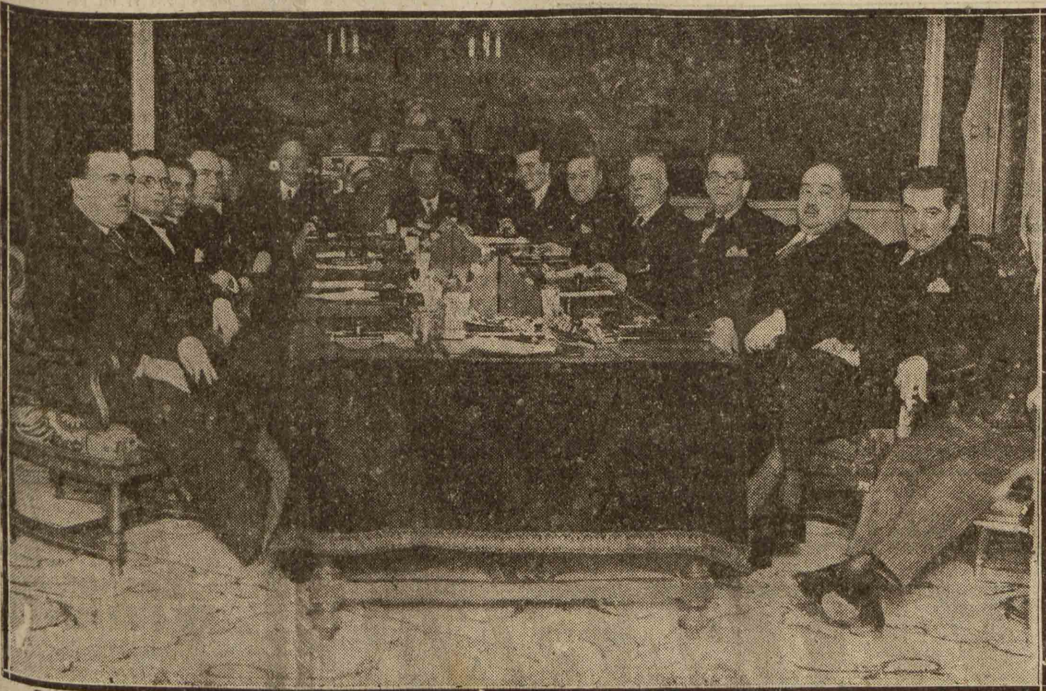
MADRID. — El Gobierno presidido por don Alejandro Lerroux, durante la celebración de su primer Consejo, bajo la presidencia del jefe del Estado.

El viernes por la mañana los comisionados vascos serán recibidos por S. E. el presidente de la República.