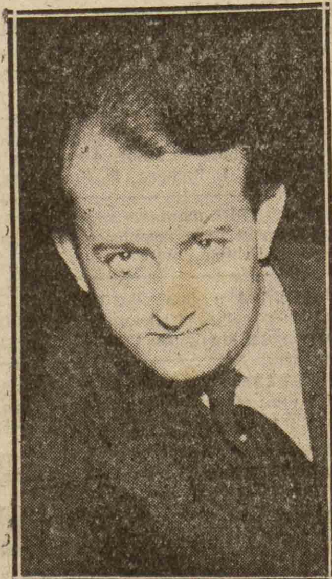
El joven escritor André Malraux, reportero muy conocido, a quien se ha adjudicado el Premio Goncourt de 1933, a la mejor novela publicada durante los nueve primeros meses del año. El premio tiene atribuida la cantidad de 5.000 francos, y la tirada mínima de la novela será, probablemente, de 50.000 ejemplares.