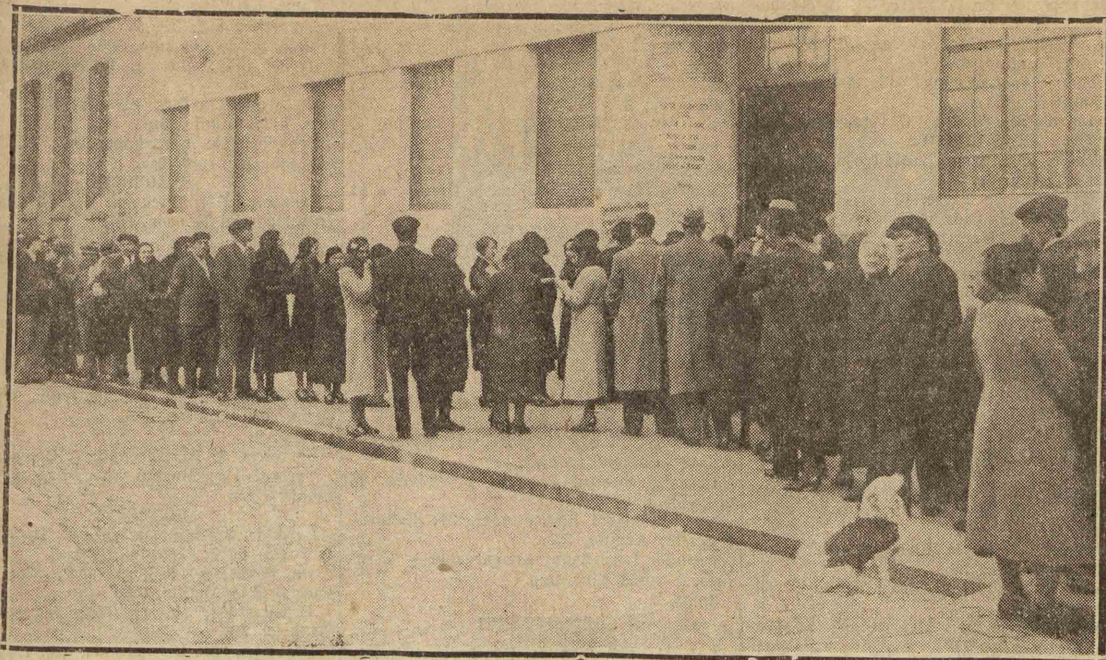
En las primeras horas de la mañana del domingo, ante el colegio establecido en el "nuevo edificio municipal" de la calle de Eusebio, en la entrada por Urdaneta, se veía esta larga fila de electores, muy nutrida de mujeres.