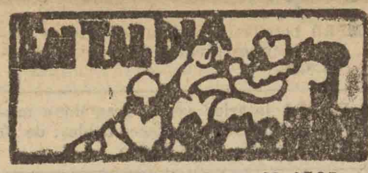
SAN SEBASTIAN HACE 30 AÑOS