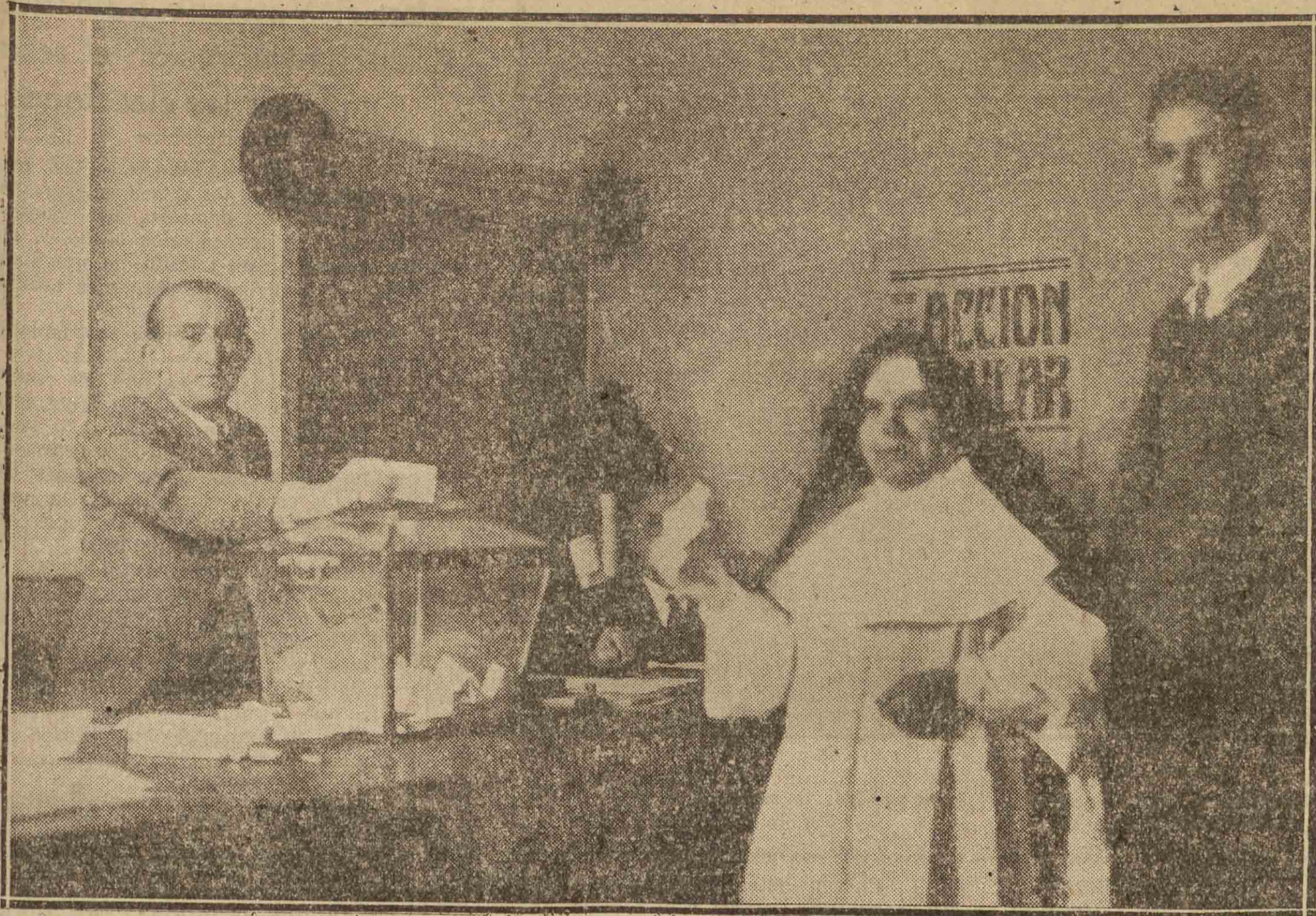
MADRID. — El domingo, en Madrid y en el resto de España, entre las mujeres electoras figuraron muchas monjas. He aquí a una de éstas, cuyo voto debe estar introduciendo en la urna el presidente de Mesa, mientras la sierva del Señor exhibe otro papellito en su mano derecha.