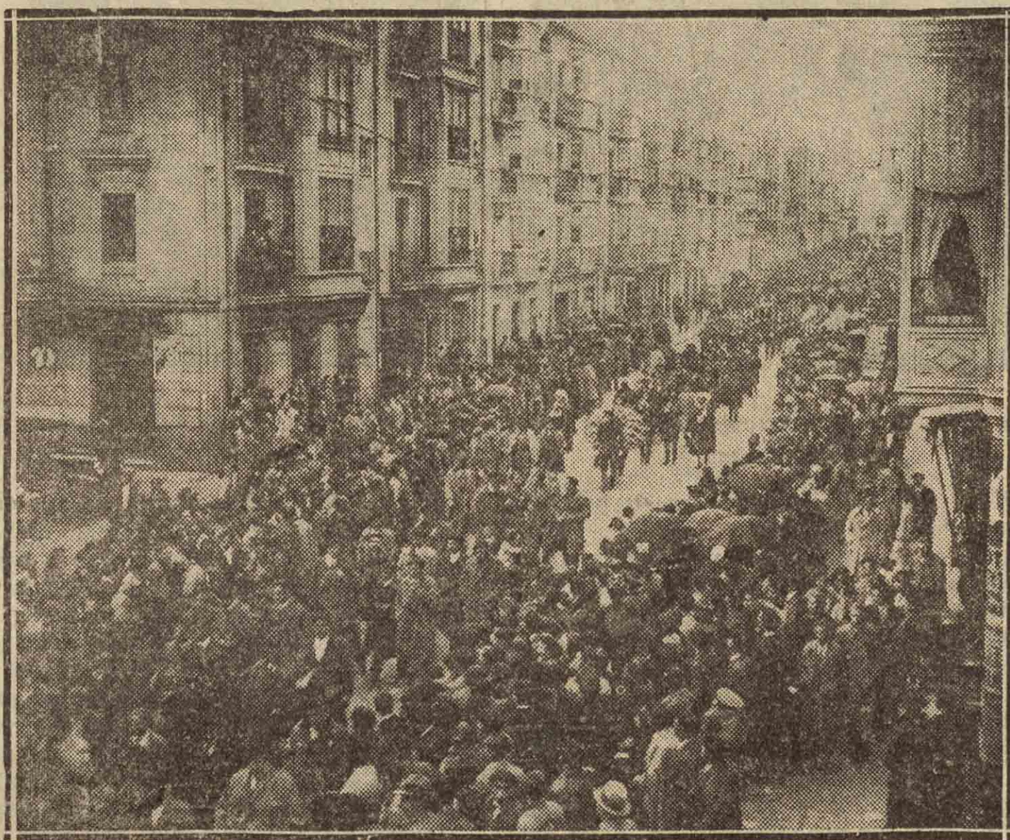
La procesión cívica, a su paso por las calles de la ciudad, dirigiéndose a la plaza de la Provincia.

Hay enemiga contra el Estatuto, no puede negarse; pero hay más reservas, que son al objeto tan perjudiciales como la enemiga, y acaso más, porque creyéndoles amigos y partidarios del Estatuto, irán contra el Estatuto. Por eso creemos que se ha caminado un poco demasiado de prisa. Es preciso desvanecer