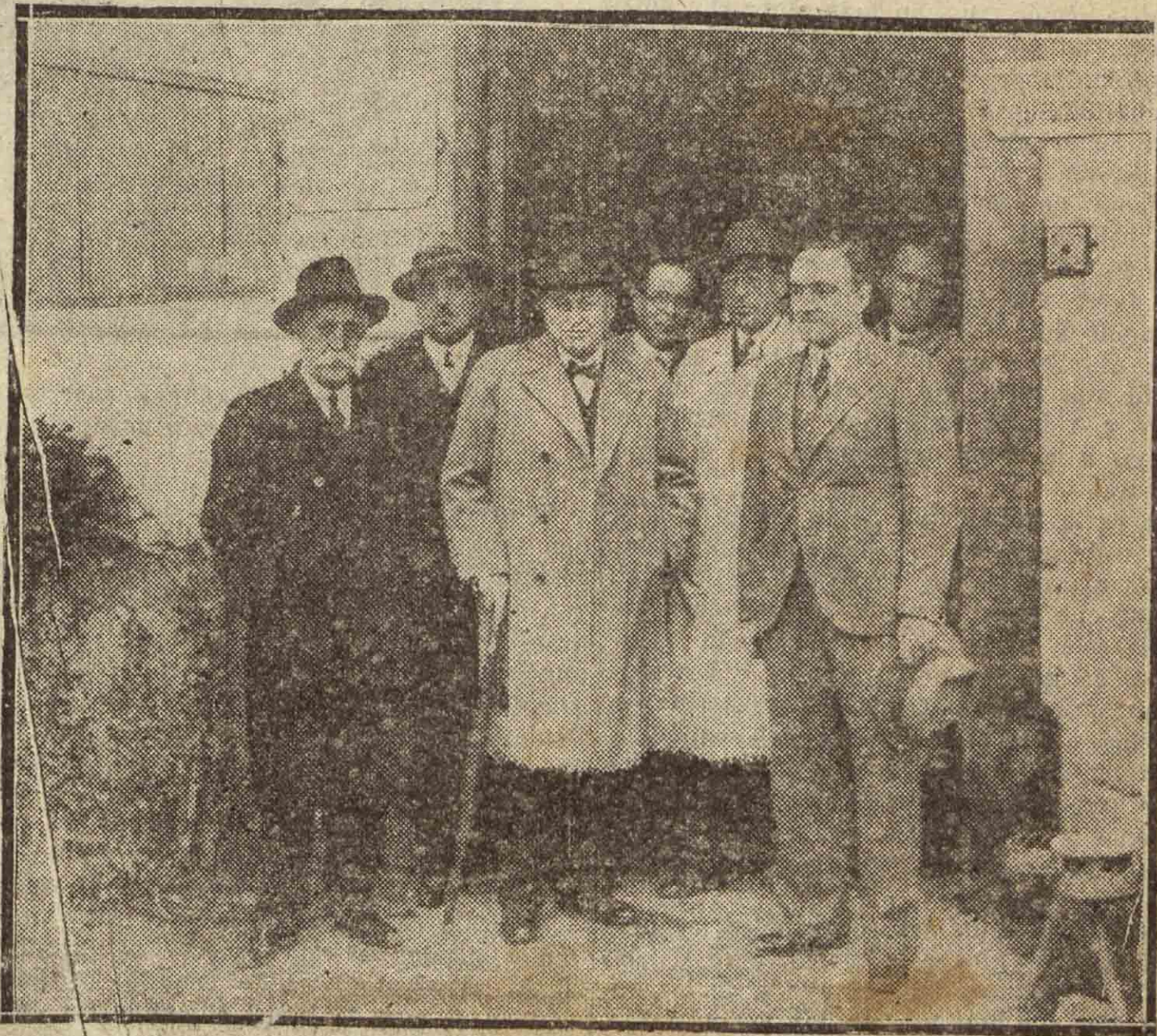
IRUN. — El ministro de Instrucción pública, don Domingo Barnés, con las autoridades provinciales y las irunesas, y el señor Usabiaga, durante su visita al Hospital de la ciudad fronteriza.

Confirmó el señor Barnés la noticia que anticipábamos el domingo, de que el Gobierno