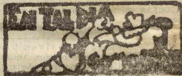
SAN SEBASTIÁN HACE 30 AÑOS

Cuarteto en do menor, op. 51, núm. 1.—Brahms Allegro. Romanze, poco adagio. Allegretto molto moderato e comodo. Allegro.