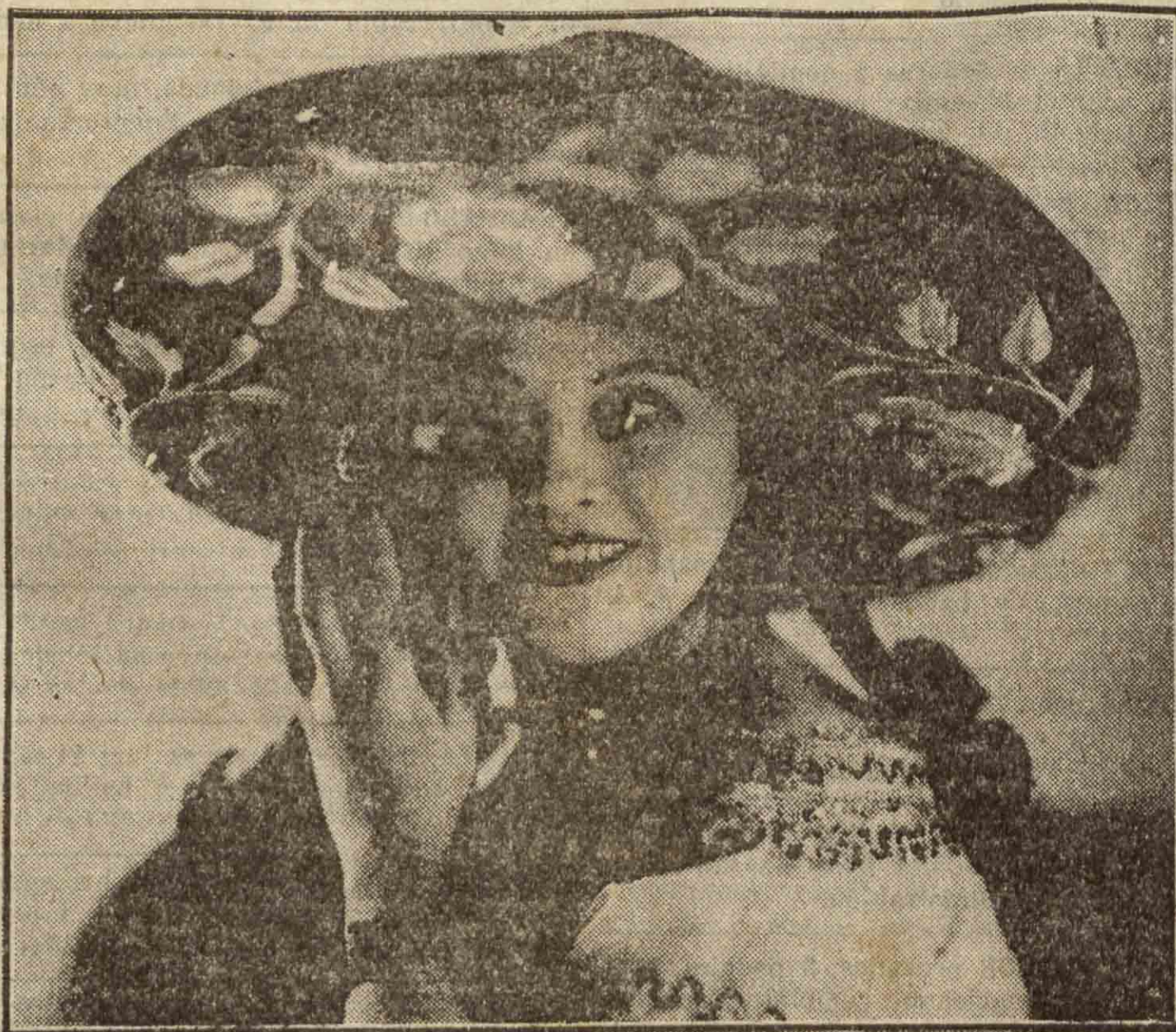
Lupe Rivas Cacho, la gran «vedette» mejicana, que interpreta con garbo y emoción las canciones, danzas y decires de la República hija de España.

Para las nueve de la noche de este día se anunciaba el debut, en el Teatro Principal, de la Compañía de zarzuela de Pablo Cornadó. El debut sería con «La Tempestad». (Seguramente no se alejaría mucho el trueno.)