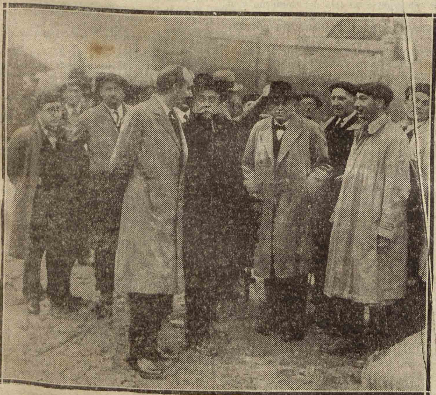
PASAJES. — El ministro de Instrucción, don Juan Usabiaga y otras personas, visitando la factoría de la "Campsa" en Molinao.

En el salón de sesiones conversó afablemente con el alcalde y concejales, de los daños que esta ciudad ha sufrido en las últimas inundaciones, haciéndoles llegar también la confianza de que el Gobierno siente nuestro