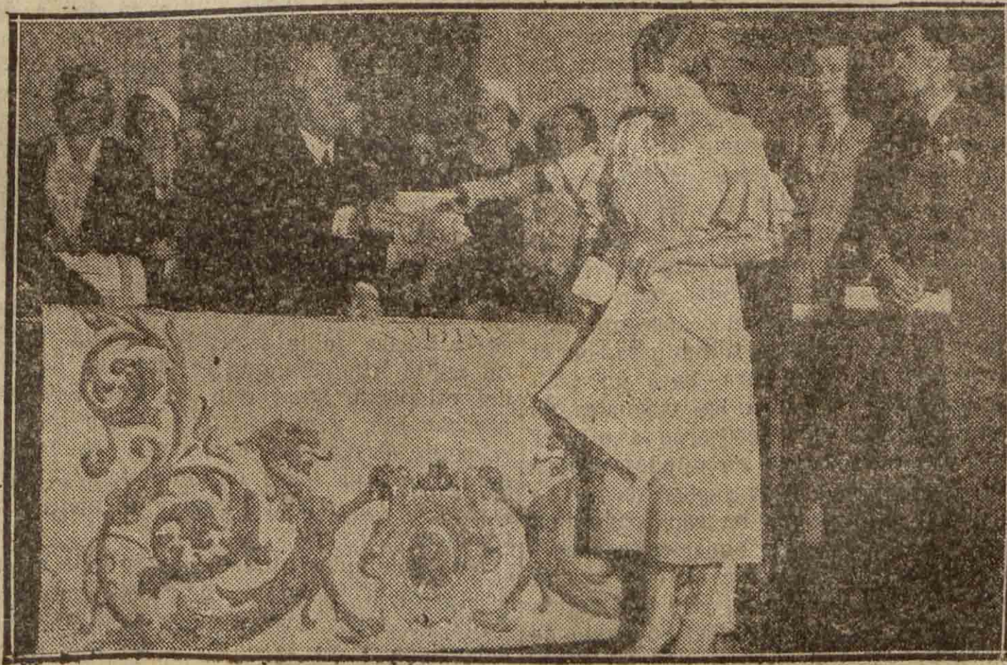
MADRID.—El presidente de la Asociación de la Prensa, con los demás miembros de la Directiva, presidió días pasados el acto inaugural del curso de enseñanza que sostiene esa entidad, entregando diplomas a los alumnos premiados en el curso anterior.

El Sr. Bonilla abogó por que el Estado desarrolle una amplia política de seguros, pues el seguro social es una barrera contra las