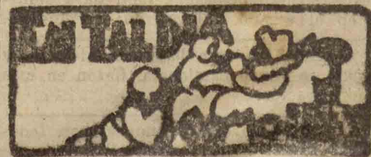
SAN SEBASTIAN HACE 30 AÑOS

17 DE OCTUBRE DE 1903. — En el Palacio de la Diputación se comenzaron en este día las obras para la instalación de la calefacción, cuyas obras habían sido adjudicadas a una Casa de Madrid.