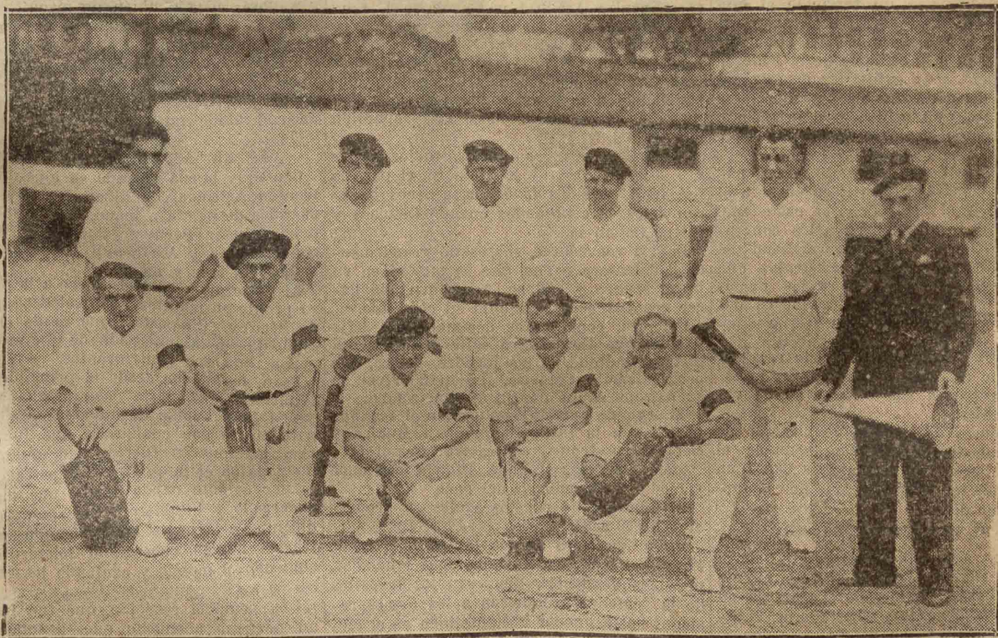
Los notables jugadores franceses y españoles que el domingo próximo mañana jugaron un interesantísimo partido de rebote en la plaza de Maitea.