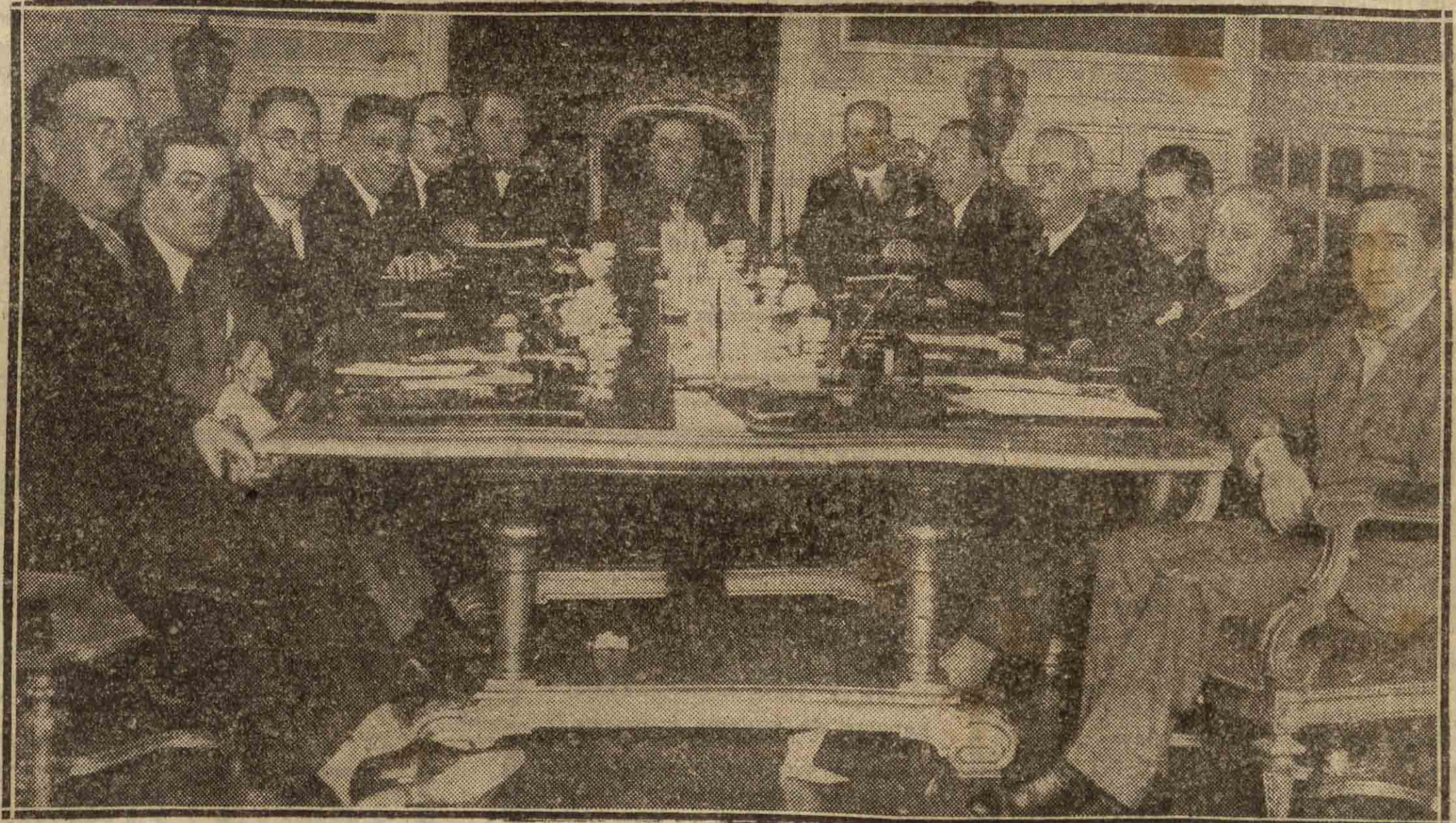
El nuevo Gobierno se reunió en Consejo, bajo la presidencia del señor Martínez Barrios. Esta es la fotografía de su primera reunión.

Se trató también de la provisión de altos cargos y del nombramiento de gobernadores civiles. Los nombres de los designados no se conocerán hasta que los apruebe el jefe del Estado. Seguramente hoy, después del Con-