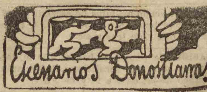
EN EL VICTORIA EUGENIA