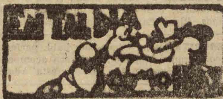
SAN SEBASTIAN HACE 30 AÑOS

12 DE OCTUBRE DE 1903 ~ Entonces no se había acordado que este día fuese «El Día de la Raza». Solamente era el día de la Virgen del Pilar, Patrona de los maños, que la solían celebrar con un poquito más entusiasmo que ahora. Sin que esto quiera molestarlos en lo más mínimo.