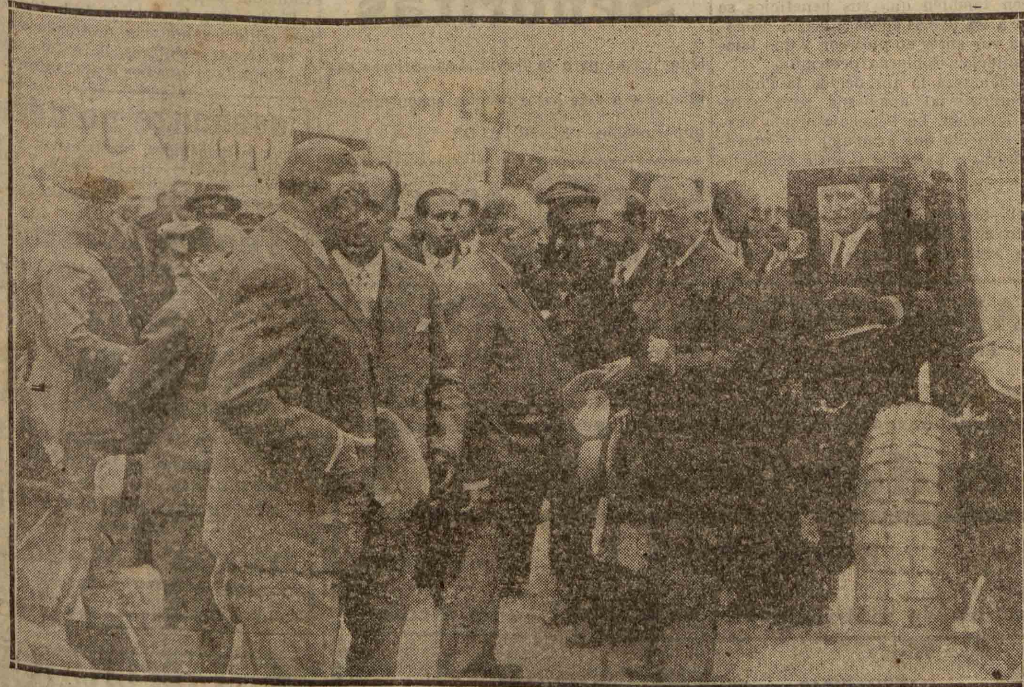
En las carreras de automóviles fué saludado el presidente de la República por el presidente del Automóvil Club de España, don Santiago Alba, que atiende como correcto cortesano que fué al jefe del Estado.

Gran festival extraordinario, dándose como regalos preciosas cajas de secreto con sorpresas, y actuando la notable orquesta "Galdona's". Cine sonoro: A las 4, "Azais o la Ley de las compensaciones". A las seis, "Beau Ideal". Parque de atracciones. Gran Restaurant.