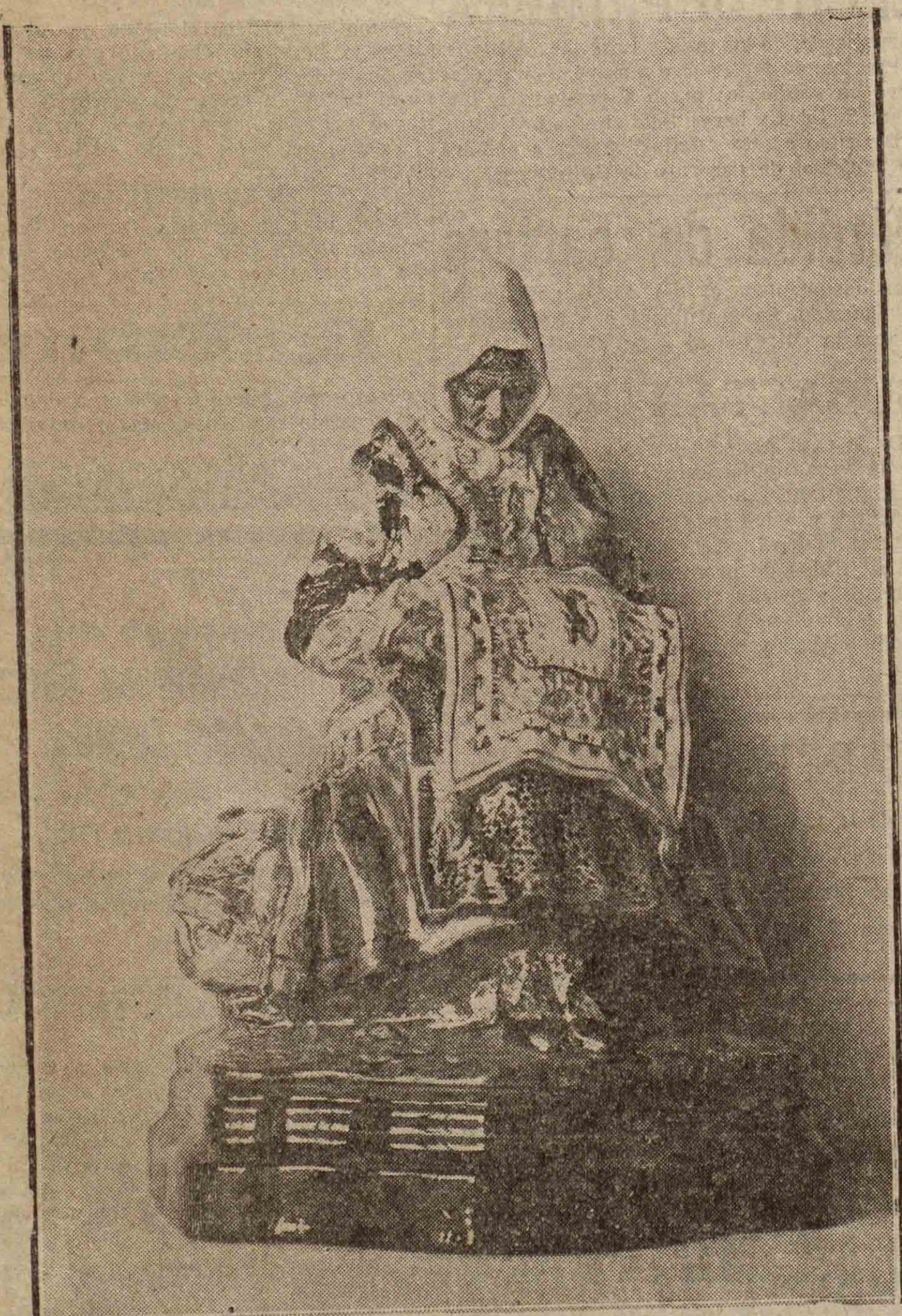
Una preciosa figura de lagarterana.