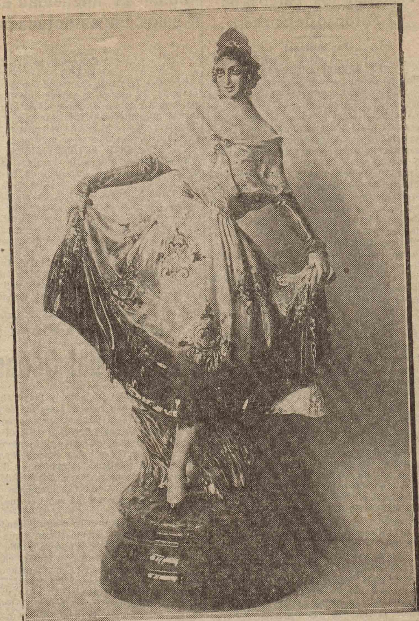
Un admirable tipo de valenciana