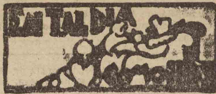
SAN SEBASTIÁN HACE 30 AÑOS

20 DE AGOSTO DE 1903. ~ Celebró sesión ordinaria el Ayuntamiento. Y por poco no la celebra. Como hacía un calor enervante, los concejales no acudían, y el alcalde mandó a buscarlos a casa. Por fin se reunió el número preciso y celebraron una sesión en la que no hicieron más que nombrar un peón caminero.