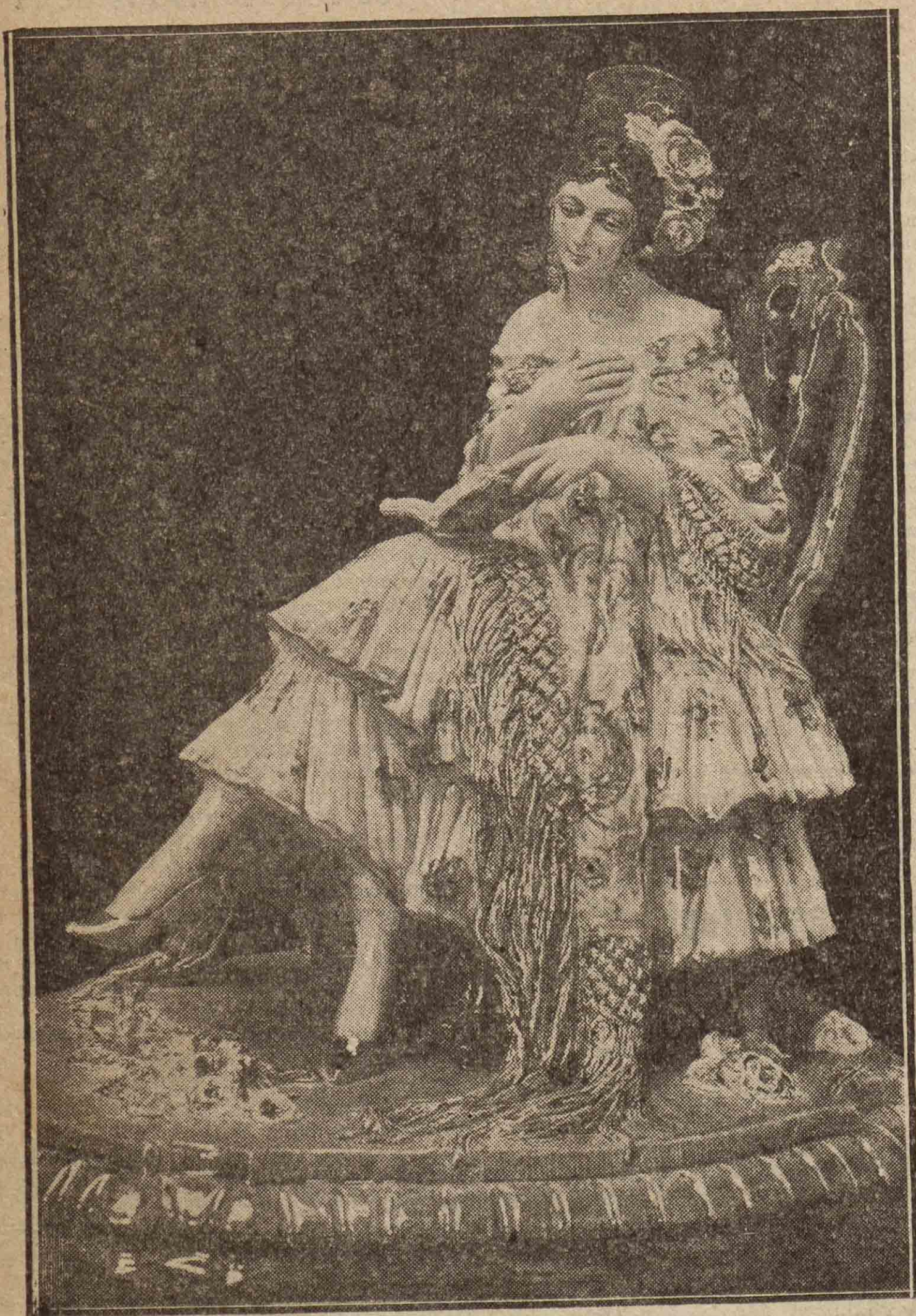
Una delicada sevillanita que lee a Bécquer.