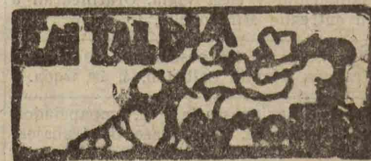
SAN SEBASTIAN HACE 30 AÑOS