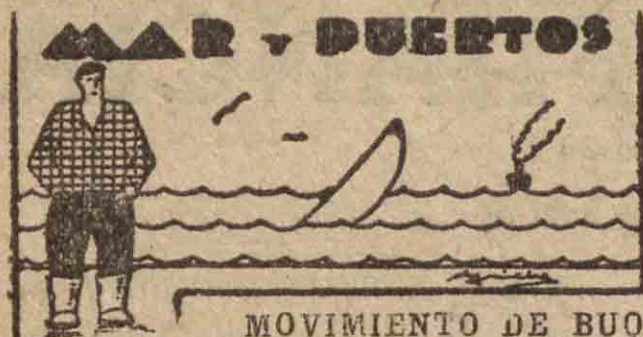
MOVIMIENTO DE BUQUES

Ayer entraron en nuestro puerto los vapores "Amada", con carga general, procedente de Santander, y "Concepción Hevia", de Zumaya en lastre.