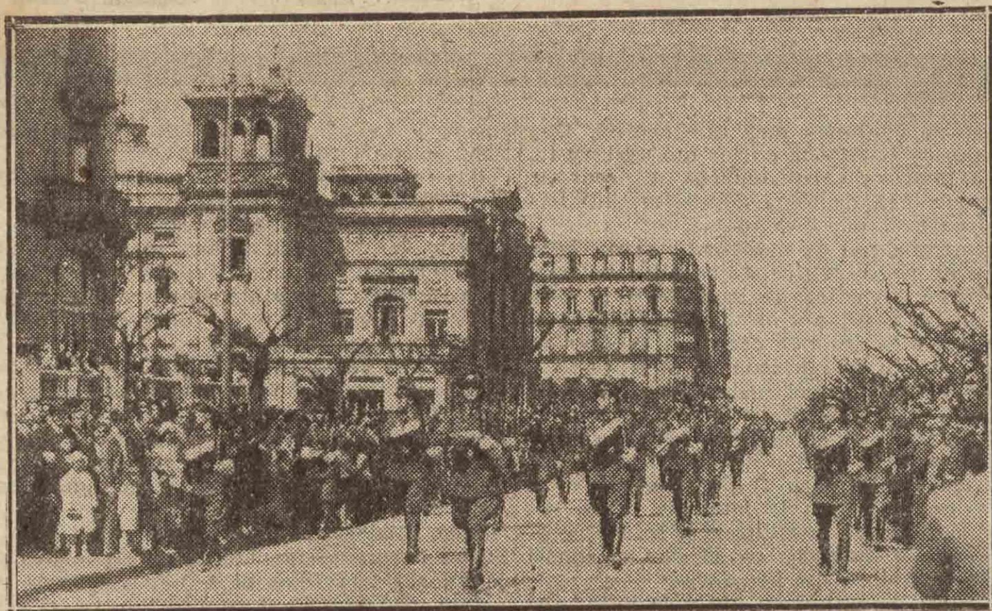
Soldados del Ejército republicano desfilando el domingo pasado ante las autoridades, en el brillante acto que se organizó con motivo del segundo aniversario de la proclamación del Régimen.