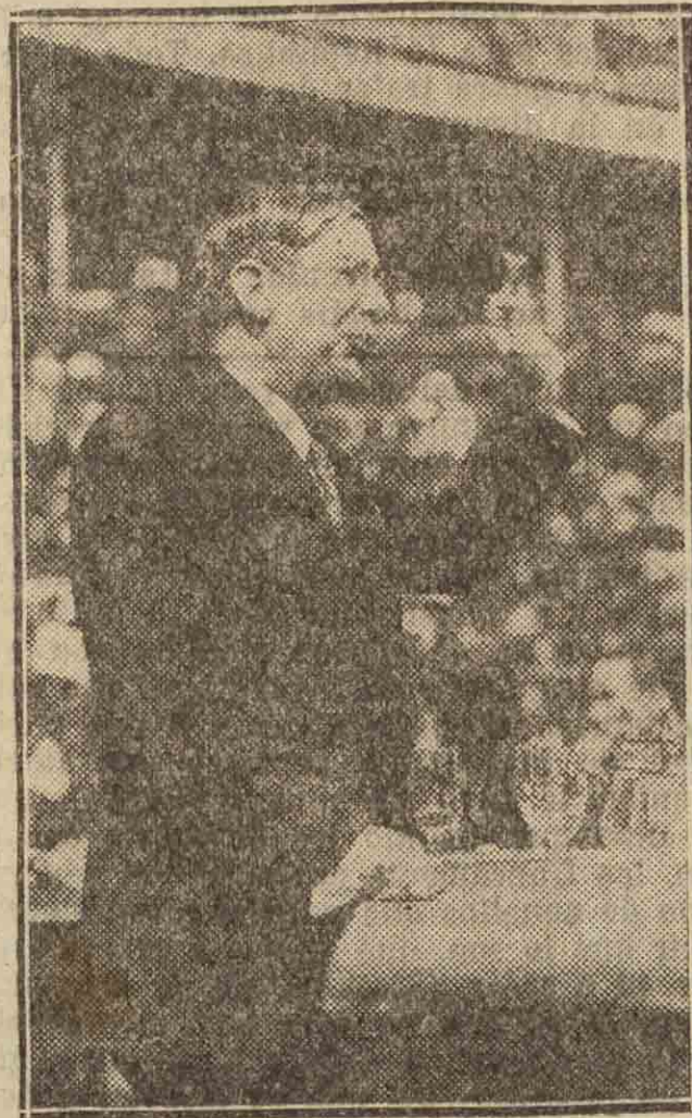
El ministro de Agricultura, don Marcelino Domingo.