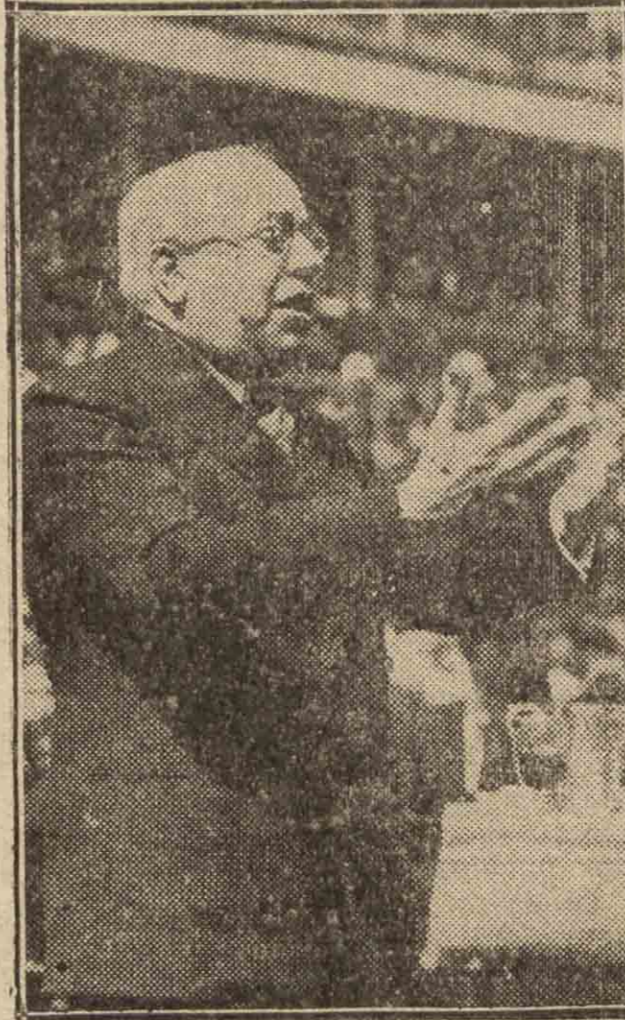
El presidente del Consejo de ministros, don Manuel Azaña.

Por esto, ciudadanos, afrontando los problemas de la República con el sereno optimismo que da, no nuestra confianza en las fuerzas personales, sino la seguridad de vuestra aprobación y el ímpetu de vuestro aliento, afrontando los problemas que nos trae la gobernación de la República, nos encontramos a