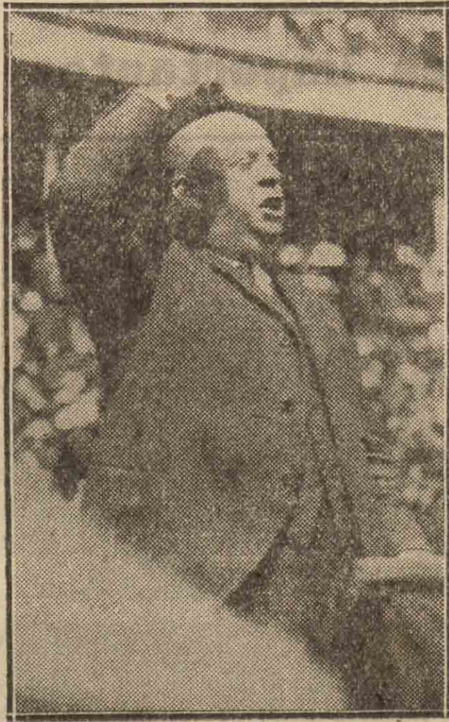
El ministro de Obras públicas, don Indalecio Prieto.

Ante España, y buscando también hábilmente el eco apetecido ante el mundo, presentase al país vasconavarro como una porción del territorio peninsular inasequible, impermeable a las doctrinas democráticas. Yo no puedo negar la existencia de núcleos