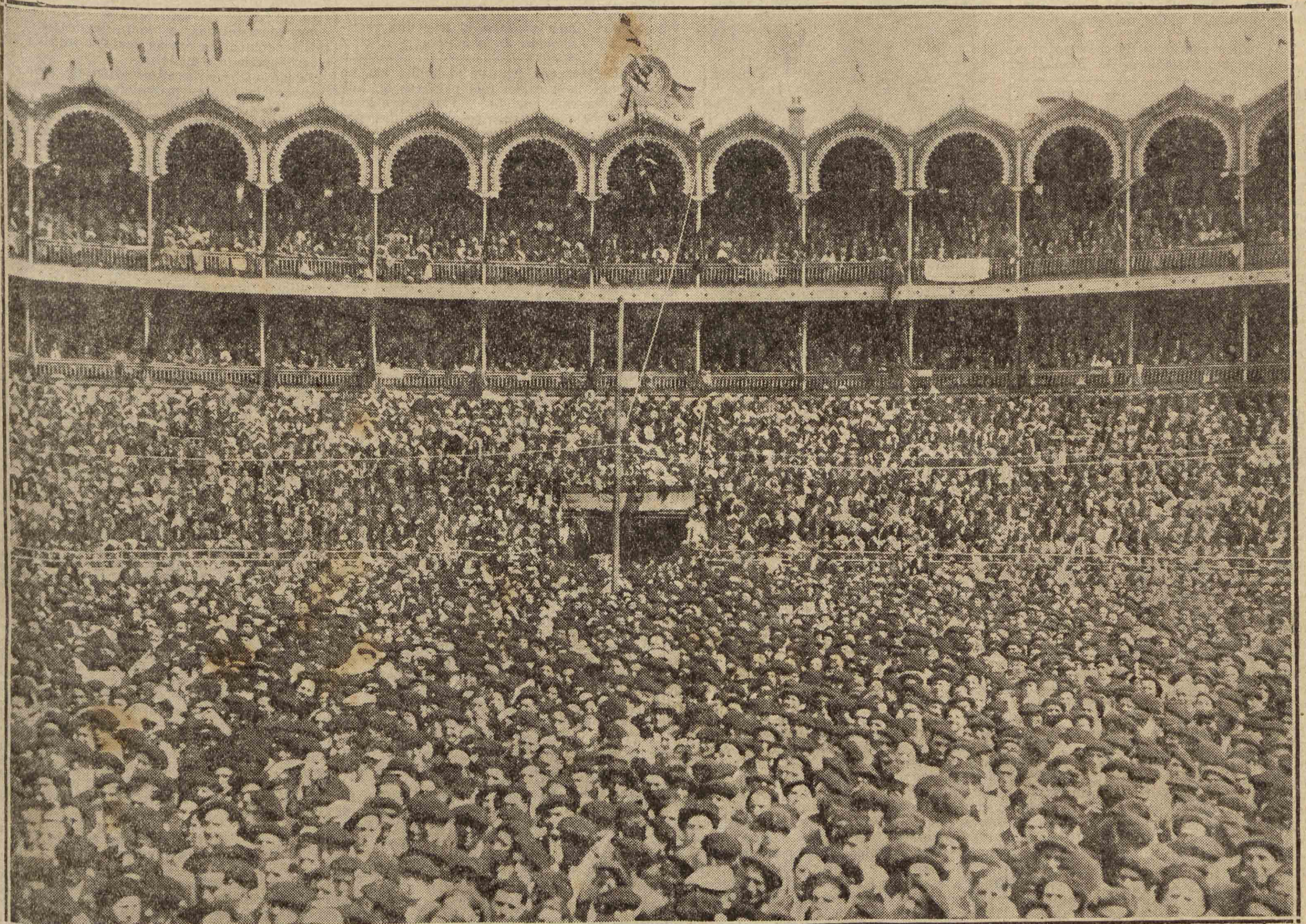
BILBAO. — BRILLANTISIMO ASPECTO DE LA PLAZA DE TOROS DE VISTA ALEGRE, DURANTE LA CELEBRACION DEL MITIN EN EL QUE TOMARON PARTE LOS SEÑORES AZAÑA, PRIETO Y DOMINGO.

Texto taquigráfico de los tres importantes discursos