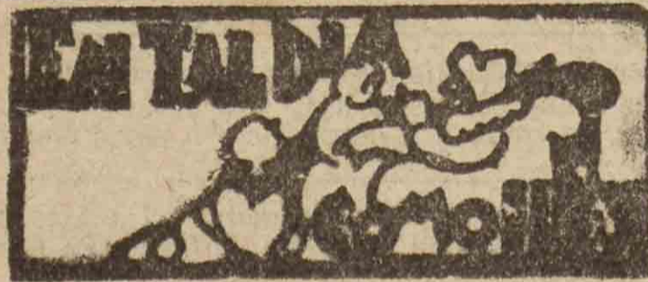
SAN SEBASTIAN HACE 30 AÑOS

A las once y cuarto de la noche, fuegos artificiales en la bahía de la Concha.