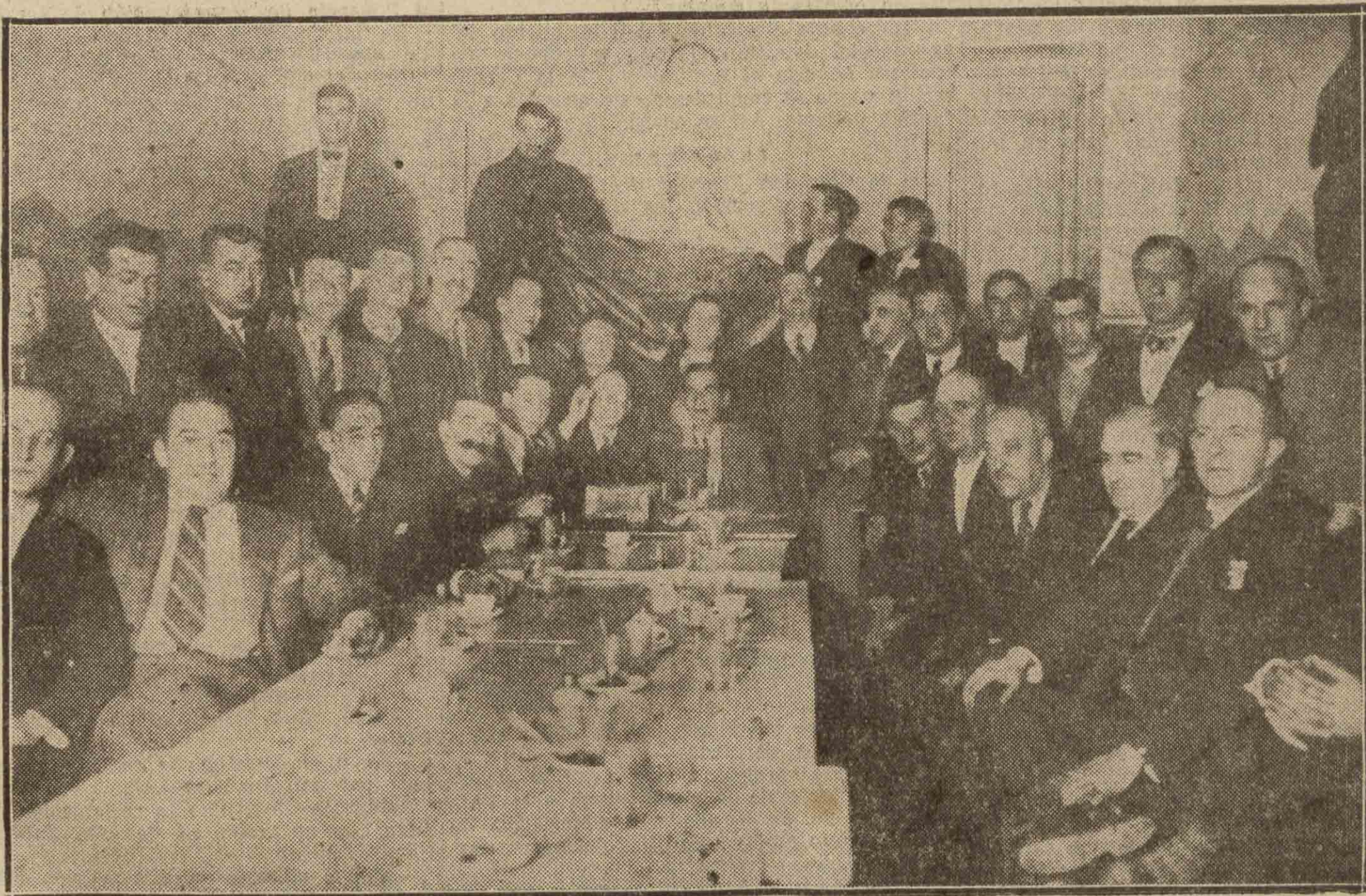
PAMPLONA. — En el veterano Centro Republicano se conmemoró, el pasado día 11, el aniversario de la primera República. En torno a la mesa se sentaron antiguos y fervorosos republicanos, acompañados de representantes de las jóvenes promociones demócratas, y todos pusieron una gran emoción en el recuerdo de la fecha gloriosa.

Quiosco Barcelonés. Rambla Canaletas (frente a la Banca Arnús). Quiosco Nuevo. Rambla del Centro (frente al Hotel Internacional). Quiosco Urquinaona Plaza Urquinaona (entre la calle Fontanella y la Ronda de San Pedro).