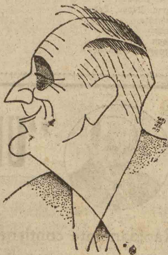
Mr. FRANKLIN DELANO ROOSEVELT

Un individuo dispara cinco tiros contra el presidente electo yanqui que resultó ileso