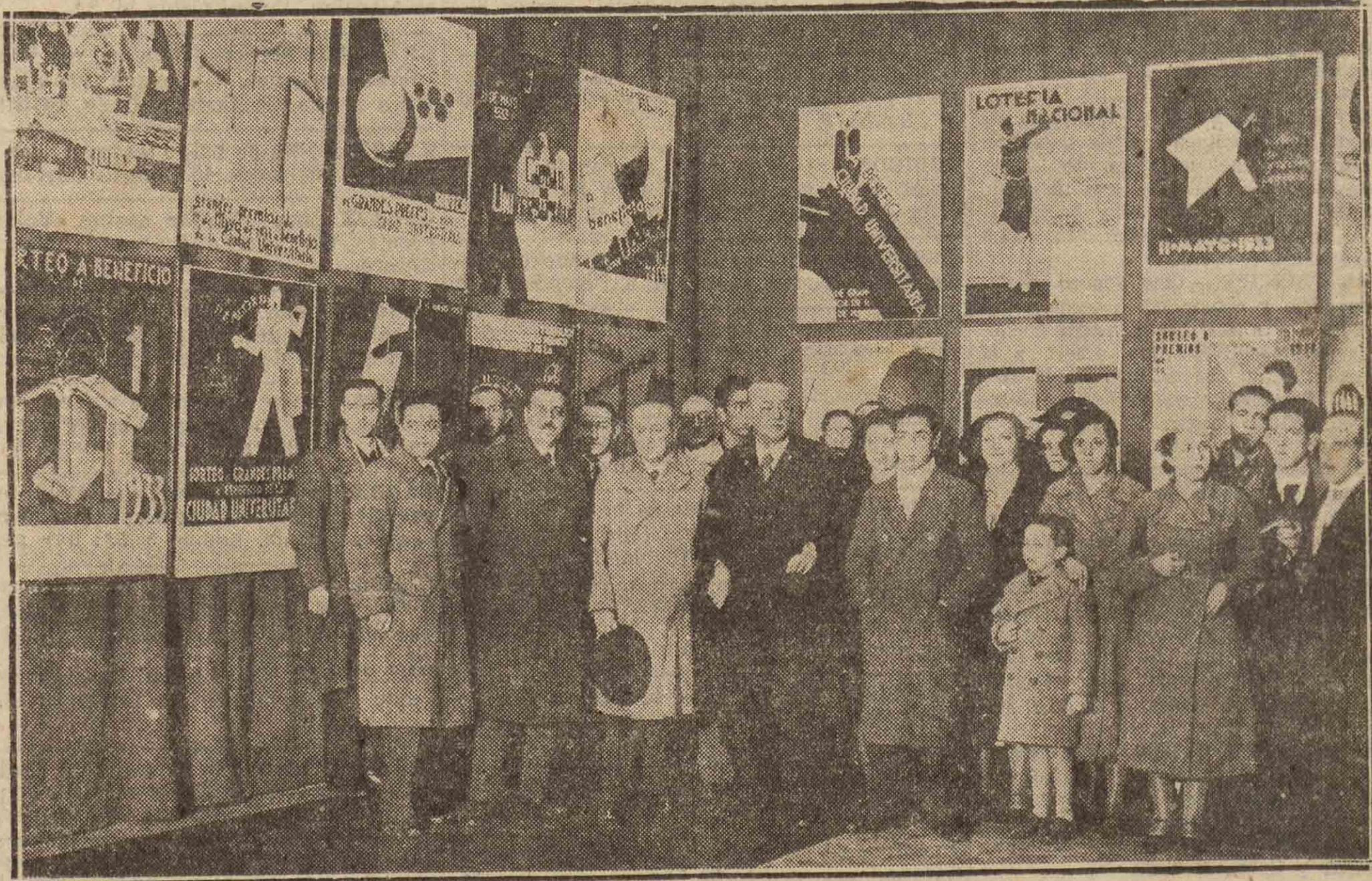
MADRID. — Inauguración de la Exposición de carteles para elegir los que han de anunciar la Lotería a beneficio de la Ciudad Universitaria.

Impresión de tarjetas, sobres recordatorios, etc. Imprenta LA VOZ DE GUIPUZCOA