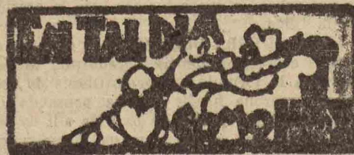
SAN SEBASTIAN HACE 30 AÑOS

—Pasó ayer por nuestra ciudad con dirección a Francia, el doctor Marañón.