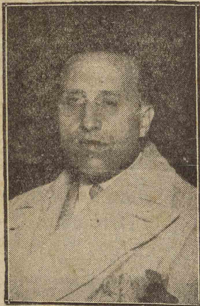
E. GIMENEZ CABALLERO

Ernesto Giménez Caballero—andarín cultural, polifacético, robinson relativo, medio voluntario, medio forzoso, de la literatura española, nieto del 98, según autocalificación—expuso anoche una concepción personal y audaz de judaísmo y jesuitismo. Audaz, en cierto modo, porque el conferenciante tuvo buen cuidado de paliarla, con frecuentes