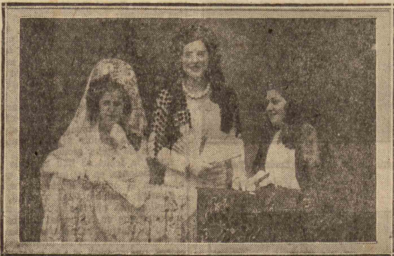
TOLOSA. — Bellas señoritas que presidi eron la becerrada organizada por la Sociedad "Gure Chokoa".

Preguntó después el señor Aguerri si los días de Jueves y Viernes Santos últimos los concejales de la derecha se reunieron en el salón de sesiones con los sacerdotes de la parroquia en cierta invitación tradicional, pues quería saber quién corría con el gasto del convite y anticipaba que se oponía a que fuese el Ayuntamiento.