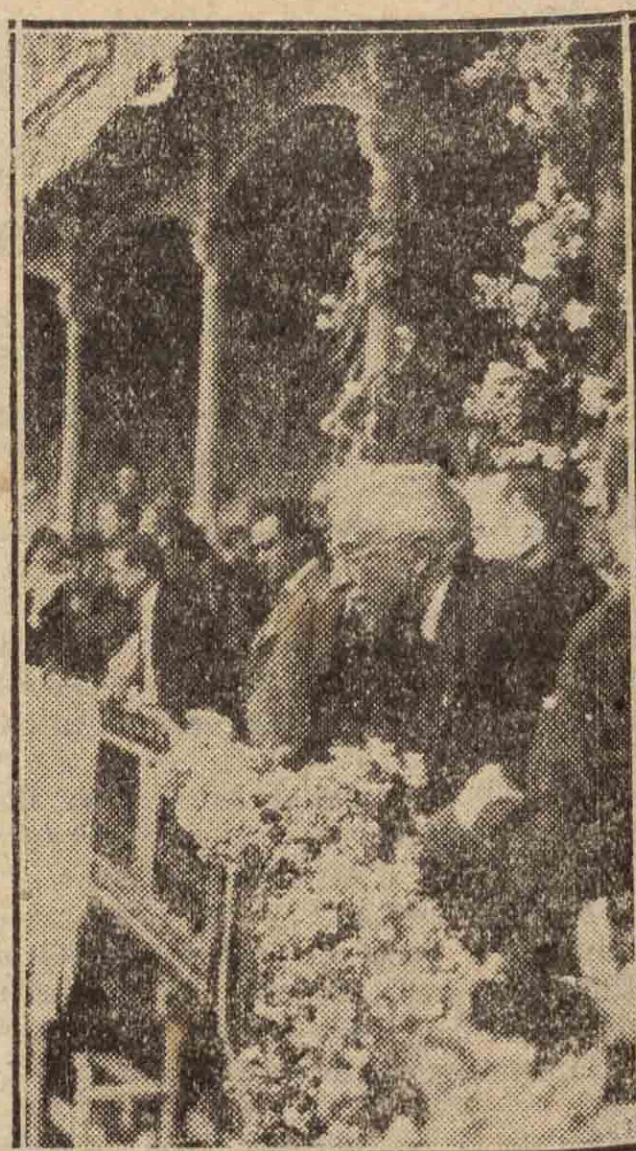
Y en el palco de la plaza de toros, contesta a las afectuosas demostraciones de la muchedumbre.

escuelas. Haremos nuevos maestros, porque la generación inmediata traerá nuevas ideas. La única aristocracia que reconoce la República es la del pensamiento.