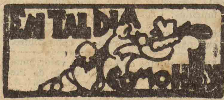
SAN SEBASTIAN HACE 30 AÑOS

Se convoca a todos los asociados a asamblea general extraordinaria para hoy, miércoles, en nuestro domicilio social (calle de Birmingham, X, bajo), y en particular a los