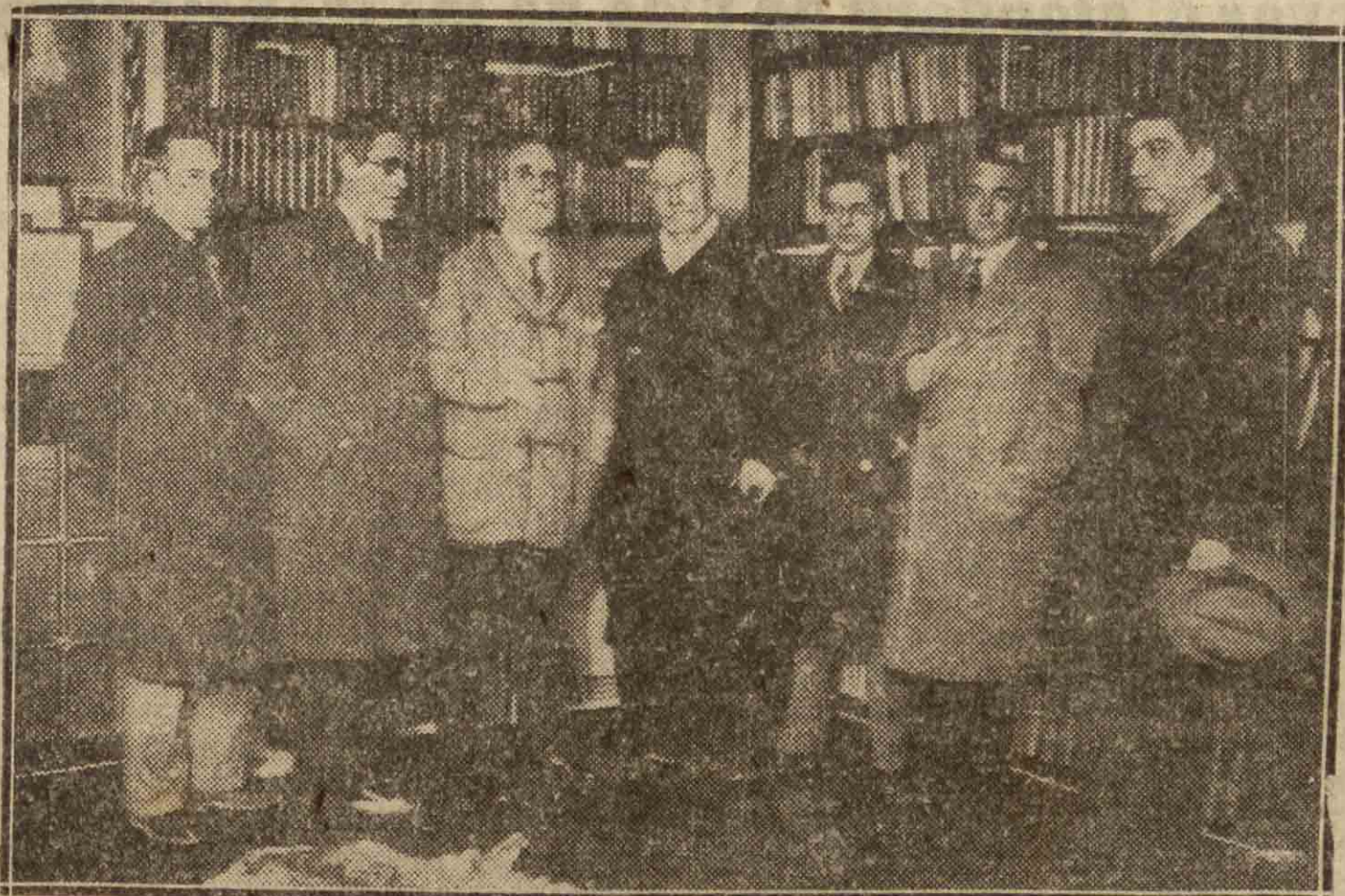
La Junta directiva de la Asociación de la Prensa de Madrid, presidida por el señor Lerroux, entregando al veterano periodista don José Sánchez Guerra el "Homenaje a la Vejez", que se le concedió el pasado año.