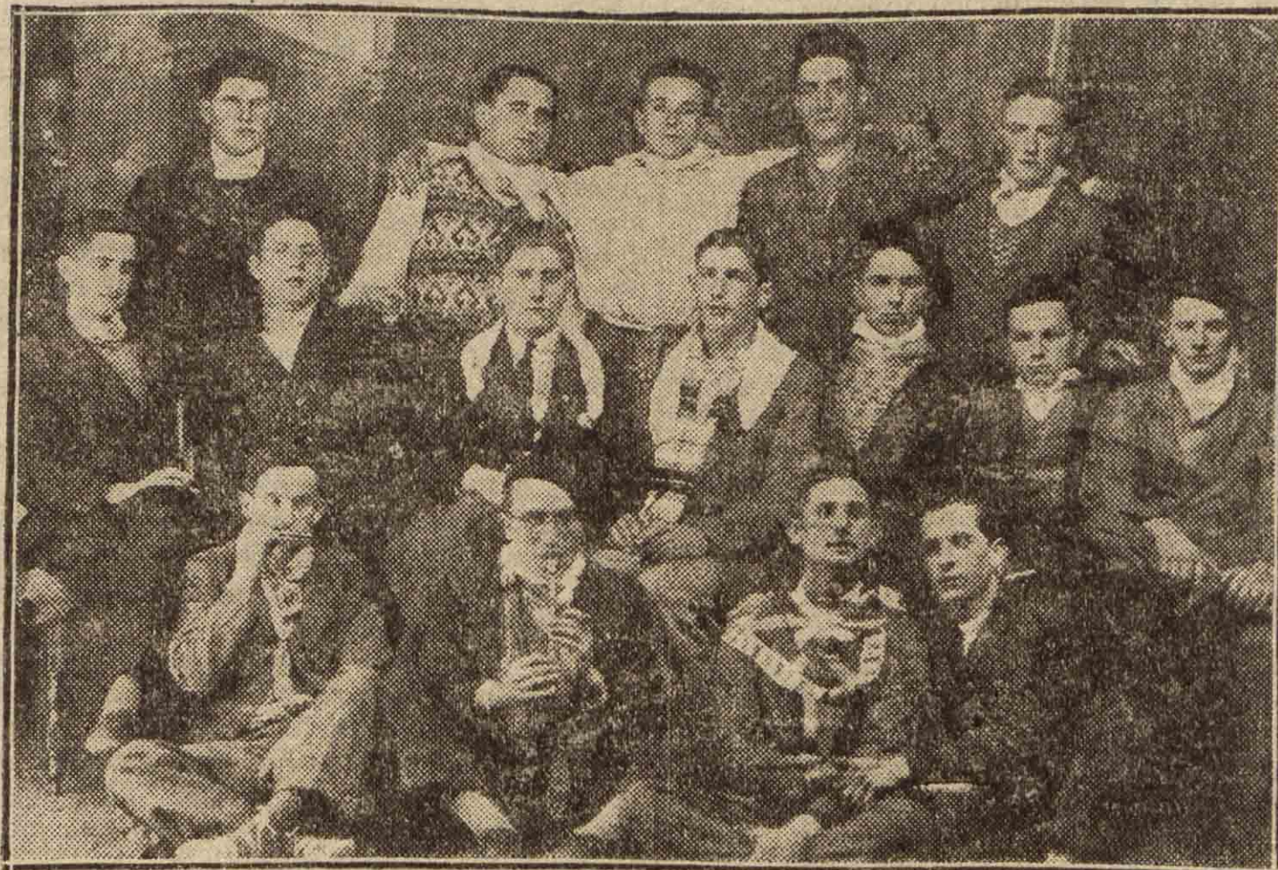
BEASAIN. — Grupo de jóvenes de la localidad que han celebrado su alistamiento a filas con un suculento banquete.

Los partidos jugados ayer en el frontón Euskalduna dieron los resultados siguientes: Onaindía y Ardanza ganaron por siete tantos a Lizarralde y Echeverría. Pastor y Orrandía vencieron por seis tantos a Gaviaría y Somorrostrero.