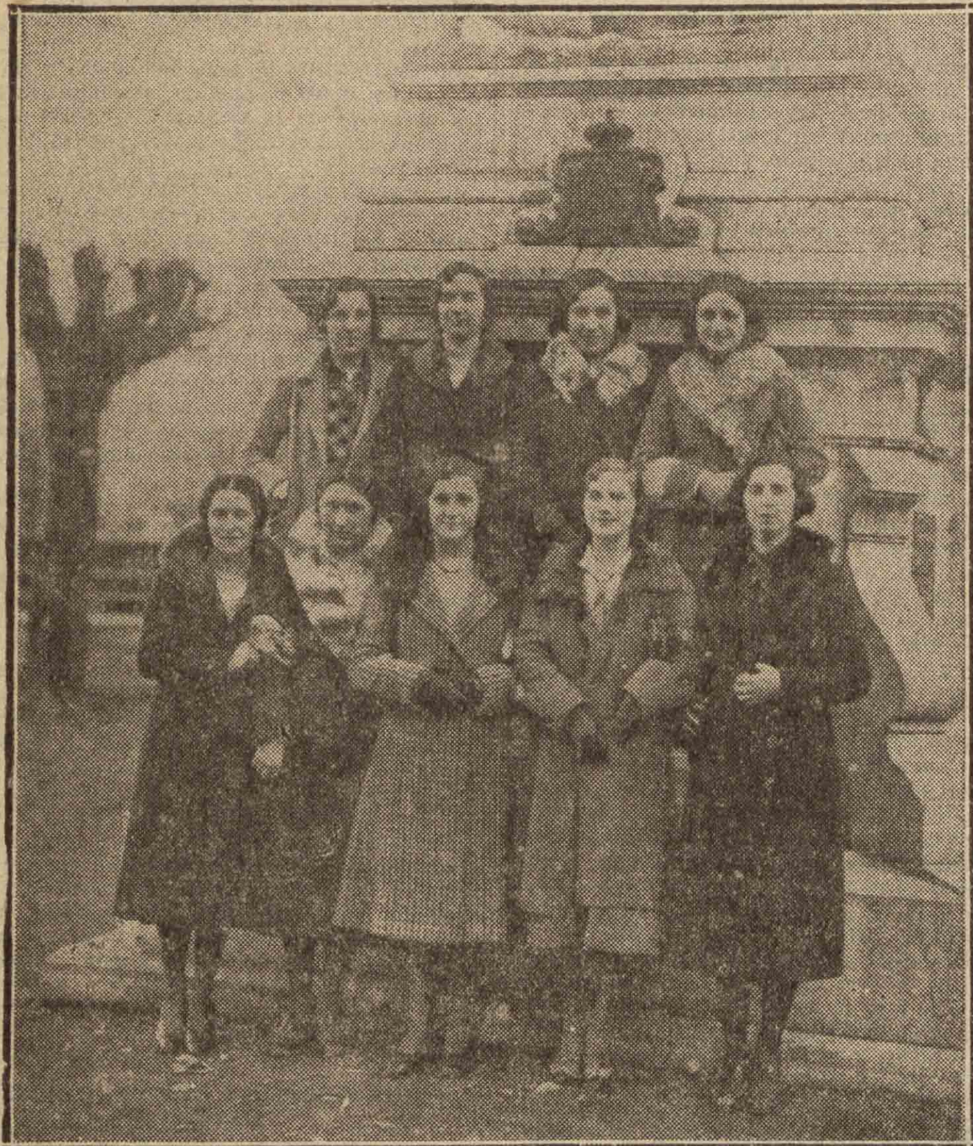
Grupo de simpáticas modistillas donostiarras que fueron a Villafranca de Oria a celebrar el santo de su Patrona Santa Lucía.

Los acontecimientos políticos de estos días han desplazado de nuestras columnas - momentáneamente - la nota pimpante y bulliciosa de la alegre modistería guipuzcoana que el domingo se acogió a su tradicional Santa Lucía para echarse a la calle - a la calle, al campo, al restaurant, al "dancing" - y divertirse lo más fácilmente posible, sin acordarse para nada del resto de los mortales, que permanecíamos pendientes de las idas y venidas de don Manuel Azaña y Díaz. - Guapas, alegres, desbordantes de juventud, nuestras "lucianettes", añadieron felizmente una fiesta más al breve sumario de su vida. - ¡Santa Lucía les conserve esos ojos! - Ved algunos grupos de ellas en esta página