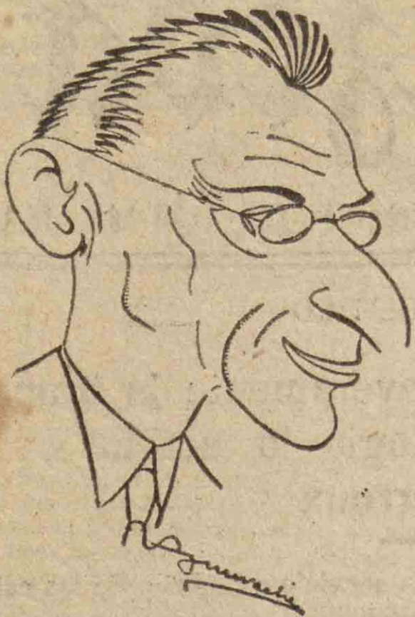
D. LUIS DE ZULUETA nuevo ministro de Estado

diera como un hecho definitivo el nombramiento de dicho señor, pues era una cuestión que había de dilucidar por la noche. Añadió que si hubiera algo en concreto él mismo llamaría a los periódicos para dar la noticia.