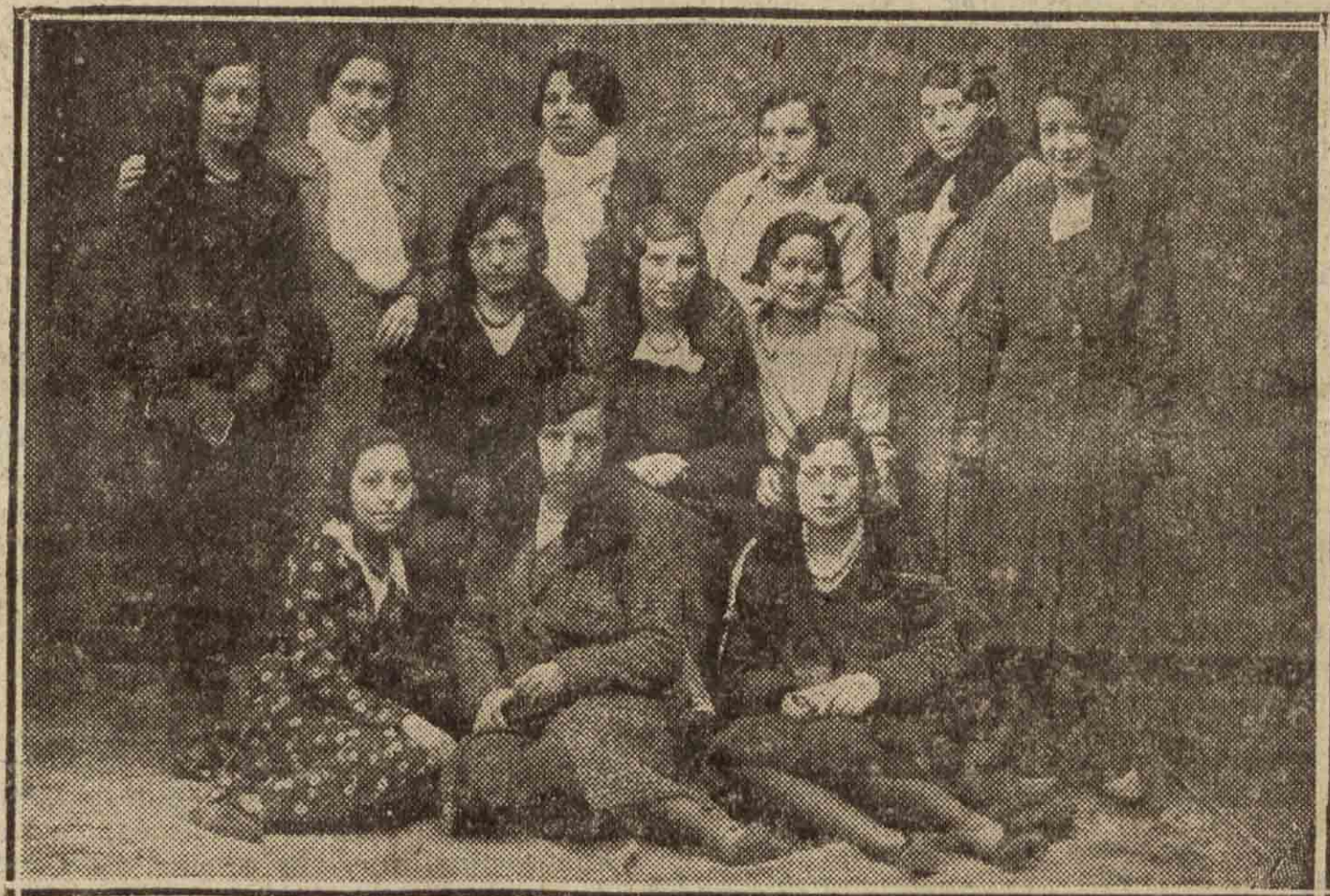
Jóvenes tolosanas que festejaron el día de Santa Lucía con una excursión a Tolosa.