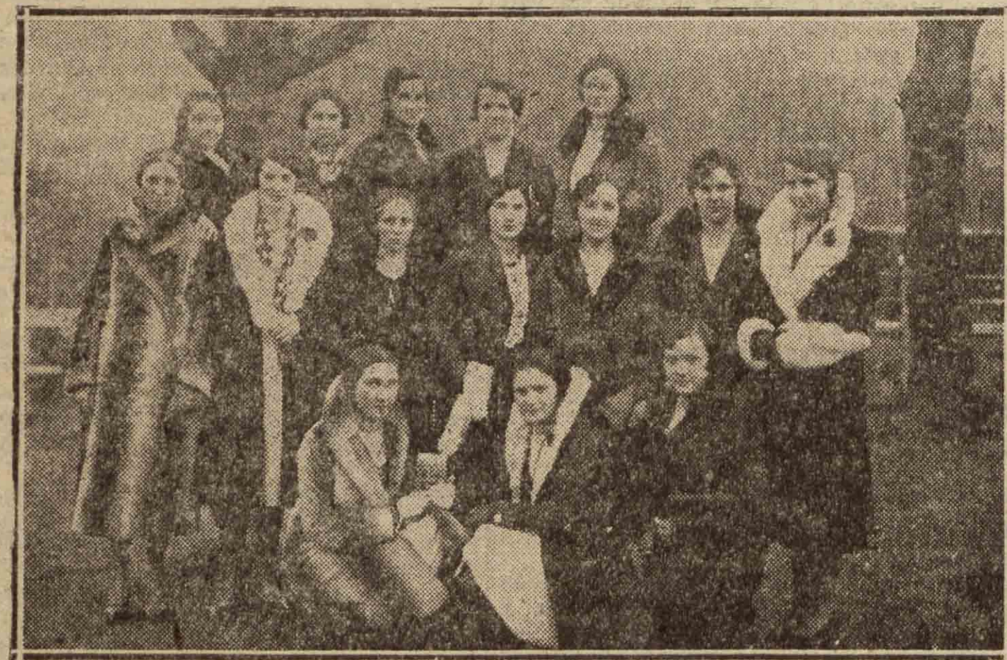
Simpáticas modistillas de Hernani que celebraron el día de su Patrona Santa Lucía en Villafranca de Oria.