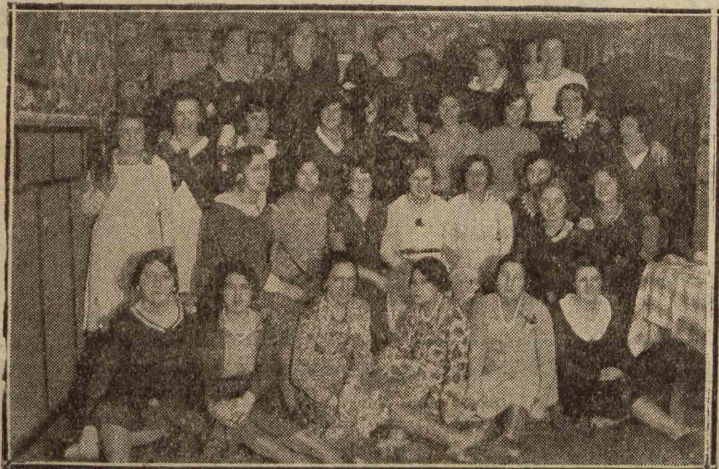
Un grupo de modistillas donostiarras en el barrio de Loyola.