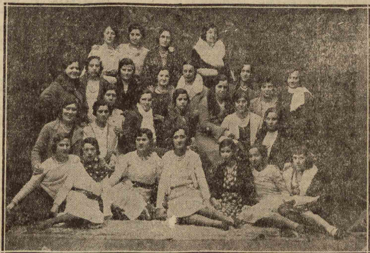
Grupos de modistas tolosanas que celebraron alegremente el día de Santa Lucía.