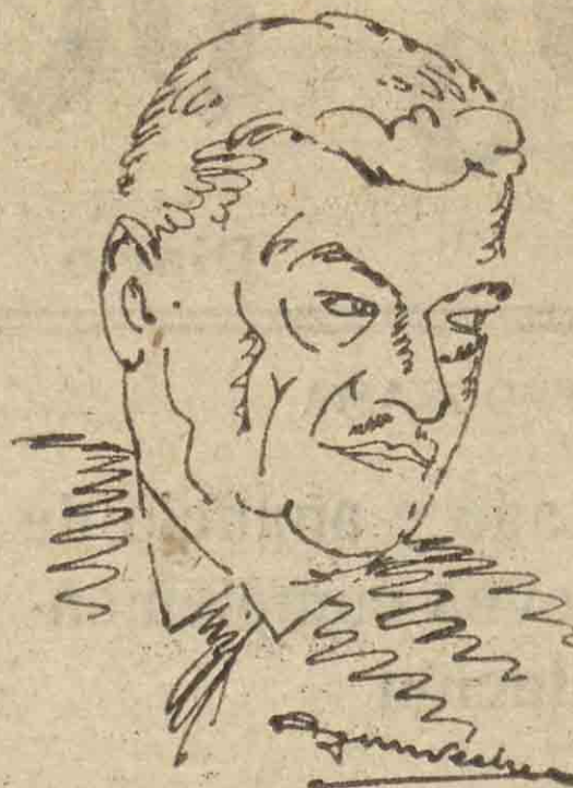
DON JOSE CARNER nuevo ministro de Hacienda

—Eso no se puede decir. Parece que el señor Lerroux y yo no estamos muy distantes; pero esto ocurre en la trayectoria circunstancial del momento. Mas adelante parecerá, quizás, todo lo contrario. Pero ya veremos lo que ocurre.