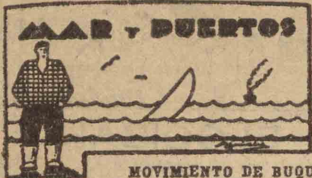
MOVIMIENTO DE BUQUES

Ayer entró en nuestro puerto el vapor "Rio Arillo", que tras carga general, procedente de Bilbao; también entró en la bahía, amarrando a una de las boyas próximas al muelle, el gabarrón a vapor "Lagun-Bi", que viene, en lastre, de Zumaya, y que esperaba la marea para entrar en la dársena.