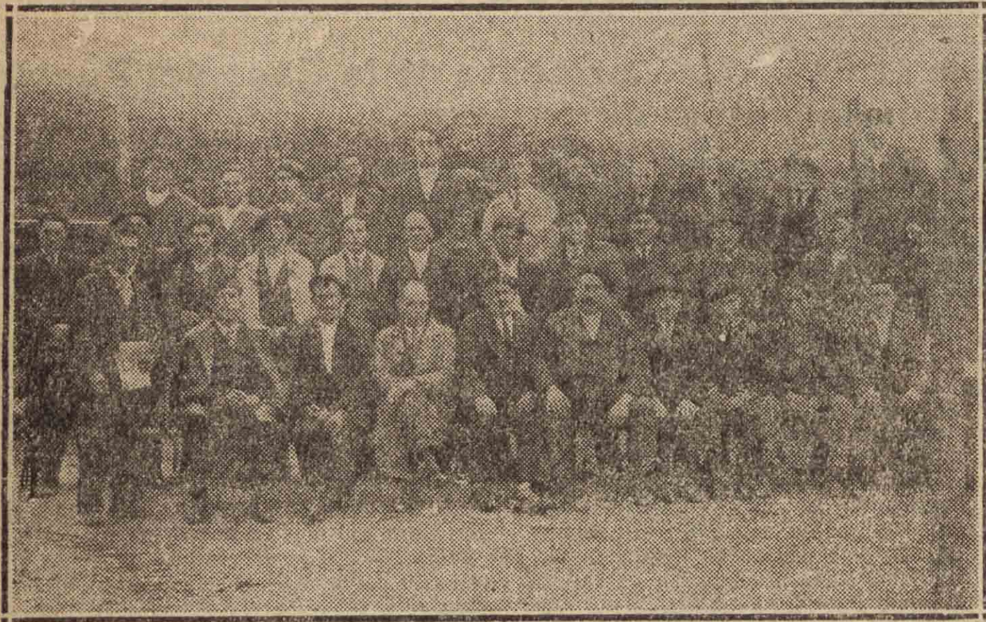
LEZO.— Grupo de entusiastas republicanos de esta Universidad que se reunieron el pasado domingo y aprobaron el reglamento para el nuevo Centro.