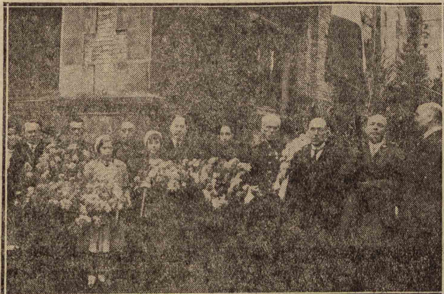
SAN SEBASTIAN. — En la Casa de Francia se celebró ayer la acostumbrada ceremonia conmemorativa del Armisticio. Junto a la bandera de los Combatientes se encuentra el cónsul de Francia, rindiendo este homenaje a los muertos en la granguerra.