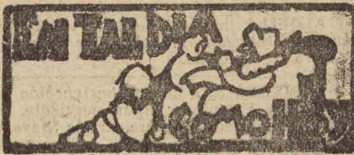
SAN SEBASTIAN HACE 30 AÑOS

12 NOVIEMBRE 1901. «En la bahía ni en la dársena no entró en este día ni un solo barco, ni chico ni grande, con carga para nadie. Era un caso que solía darse muy pocas veces.